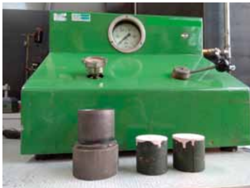
Rys. 1. Aparat do badania przyczepności powłok ochronnych wraz z umieszczoną próbką Fig. 1. Apparatus and sample for testing the adhesion of protective coatings

the jet of compressed air. The test was performed on a Multiserw Morek apparatus for testing the adhesion of protective coatings to the surface of moulds and cores, when subjected to the flow of compressed air in the pressure range of 0–1 MPa (Fig. 1).