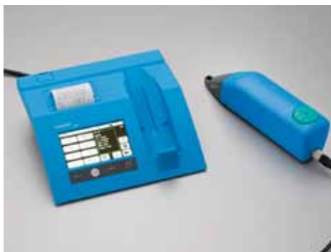
Rys. 3. Urządzenie do pomiaru chropowatości HOMMEL-ETAMIC W20 Fig. 3. HOMMEL-ETAMIC W20 roughness measurement instrument

After knocking out and sand blasting of castings, the surface roughness was measured. The measurement was carried out in accordance with the ISO 11562 Standard using a HOMMEL-ETAMIC W20 instrument from Jenoptik (Fig. 3). The results of roughness measurements are compared in Table 6.