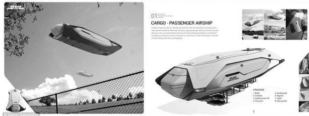
Rysunek 2. Sterowiec doceniony w konkursie DHL Blue Sky Transport Design Award

Ważnym procesem usprawnienia transportu jest innowacyjność koncepcyjna przyszłości, pozwalająca zagospodarować przestrzeń już istniejącą oraz tę, która do tej pory nie była brana pod uwagę jako element rozwoju infrastrukturalnego. Pierwszym takim przykładem jest wprowadzenie statków powietrznych, mających wykorzystać przestrzeń nisko powietrzną niekolidującą z transportem lotniczym. Cykl realizacji tego projektu koncepcyjnego pozwala na wykorzystanie energii słonecznej i wiatrowej jako źródła napędu, co w dużym stopniu pozwoli na zmniejszenie emisji CO 2 . Transport ten to nie tylko alternatywa pod względem infrastruktury, ale również ładowności i szybkości realizacji zamówień. Przewiduje się, że jeden taki statek powietrzny będzie rozwijał 250 km/h przy ładowności 500 ton ładunku.