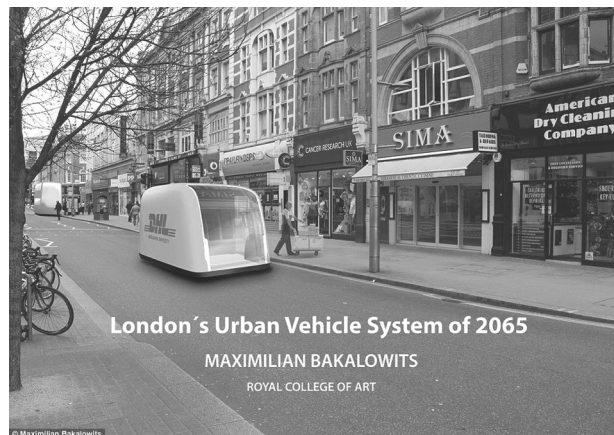
Rysunek 3. Lekki samochód dostawczy

następnym pokoleniom możliwość korzystania z dóbr i zasobów, ze szczególnym uwzględnieniem zasobów nieodnawialnych (Duraj, 2010, s. 61).