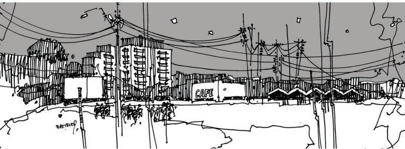
Rys. 3 Przedmieścia Brasílii; rys. B. Malinowska-Petelenz. Fig. 3 Suburbs of Brasília, drawings by B. Malinowska-Petelenz