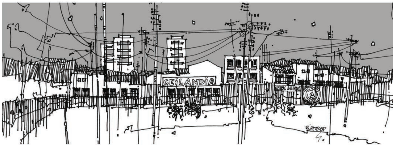
Rys. 5 Przedmieścia Brasílii; rys. B. Malinowska-Petelenz. Fig. 5 Suburbs of Brasília, drawings by B. Malinowska-Petelenz