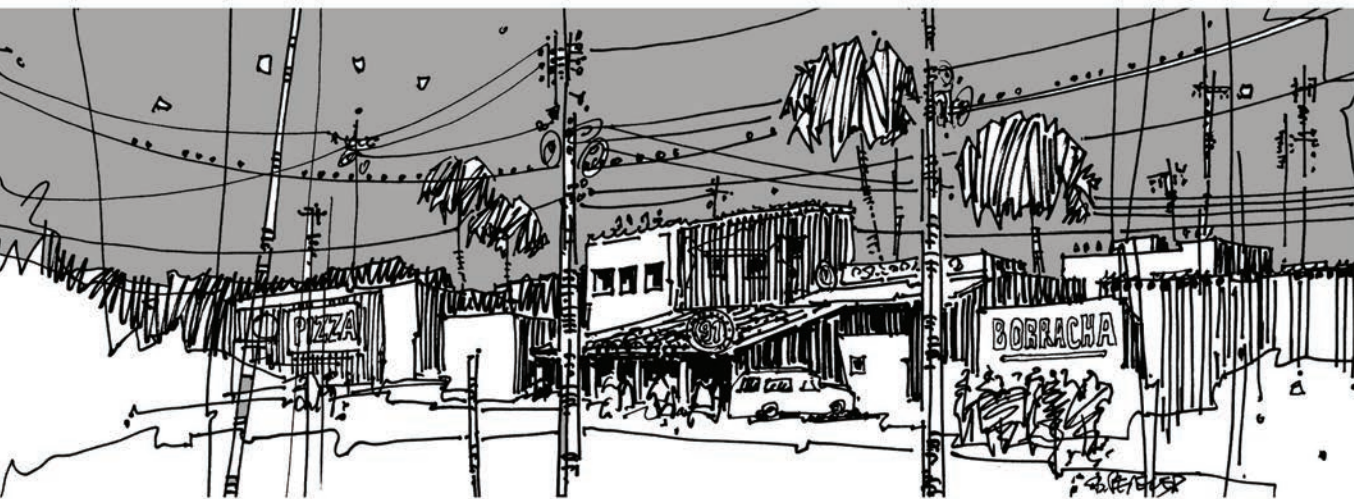
Rys. 1 Przedmieścia Brasílii; rys. B. Malinowska-Petelenz. Fig. 1 Suburbs of Brasilia, drawings by B. Malinowska-Petelenz

wyjścia programu modernizacji kraju, której założenia wypisano na brazylijskiej fladze w postaci hasła: „Ordem e Progresso”, czyli „Ład i Postęp” – hasła nośnego szczególnie w okresie powojennym, kiedy wydawało się, że możliwe jest wykreowanie nowego, lepszego społeczeństwa [Kubitschek, 1975].