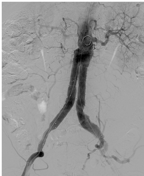
Rys. 2 Zaimplantowany stentgraft do aorty brzusznej, obraz z badania angiograficznego (faza po podaniu środka kontrastującego)

Dużym plusem dla pacjenta są niewielkie cięcia w okolicach obu pachwin, przez które wewnątrznacyniowo wprowadzana jest proteza. Zaletą jest również znieczulenie podpajęczynówkowe, stosowane przy tego rodzaju operacjach, które jest mniej obciążające niż zabieg w znieczuleniu ogólnym, stosowany podczas operacji klasycznej [15, 16].