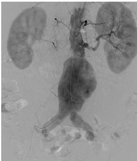
Rys. 1 Tętniak aorty brzusznej, obraz z badania angiograficznego (faza po podaniu środka kontrastującego)

Współcześnie uznaje się złożoną etiologię tętniaka. Jego powstanie jest związane z osłabieniem ścian naczyń, które może być związane z obciążeniem genetycznym [4]. Na powstanie tętniaka ma również wpływ miażdżycy, która powoduje stopniowe uszkodzenie włókien kolagenowych i miejscowy wzrost czynników prozapalnych, w konsekwencji czego dochodzi do zmniejszania się syntezy elastyny. Ma to bezpośredni wpływ na wytrzymałość ścian naczyń [5]. Równie ważnymi czynnikami ryzyka są: palenie papierosów, nadciśnienie tętnicze, przewlekła obturacyjna choroba płuc, uraz tętnic, wiek, płęć męska oraz zaburzenia gospodarki lipidowej [6-8].