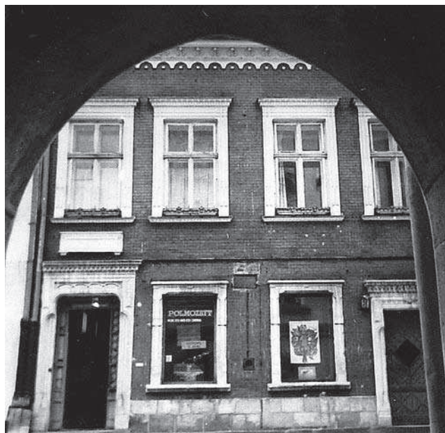
Rys. 3. Fasada kamienicy Rynek 3 XX w.

Najstarsze zapisy, świadczące o powstaniu budynku sięgają roku 1678, gdy był on w posiadaniu rodziny