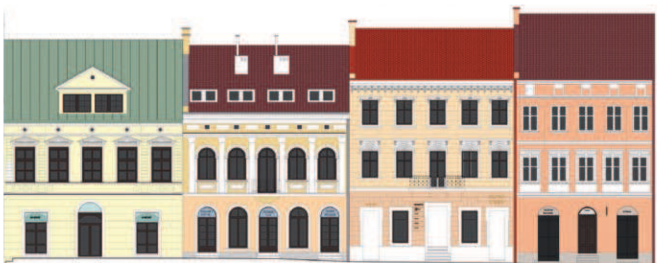
Rys. 10. Fragment projektu reklam na zabytkowych kamienicach w Rzeszowie – autor I. Majewska, nadzór naukowy M. Gosztyła

w skrajnych osiach zostały podwojone, a detal architektoniczny wzbogacony o motywy secesyjne. W 1949 roku, w wyniku działań wojennych, kamienica uległa zawaleniu [1] [3] [5].