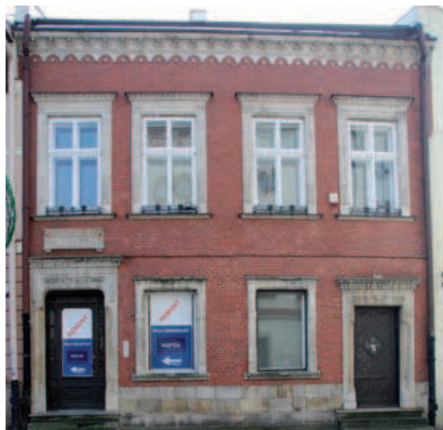
Rys. 4. Fasada kamienicy Rynek 3 – stan obecny

Rzeżyckich. Z upływem lat nieruchomość wielokrotnie zmieniała właścicieli, a wraz z nimi swoją pierwotną formę. Początkowo budynek charakteryzował się drewnianą konstrukcją, która podczas pożaru w 1708 roku została całkowicie zniszczona. Wraz z odbudową w 1778 roku obiekt zyskał miano kamienicy. Z tego okresu pochodzą pierwsze murowane elementy budynku. Dom charakteryzujący się drewniano-murowaną konstrukcją posiadał w parterze sklep z podcieniem. Dodatkowo do kamienicy przylegał ogródek, studnia i spichlerz. W końcu XIX wieku nowym właścicielem, któremu zawdzięczamy dzisiejszą formę architektoniczną kamienicy,