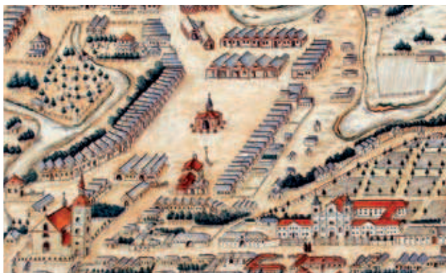
Rys. 2. Fragment planu Wiedemanna z 1762 r.

pozostałej części kamienic. Charakter przeprowadzonych zmian obrazuje plan Wiedemanna z 1762 r. Całkowite przebudowanie pierzei Rynku zapoczątkowane w XIX w. spowodowało przekształcenie istniejących budynków w pełni murowane kamienice. Prowadzone w tym czasie prace budowlane obejmowały zazwyczaj swym zakresem częściową wymianę fundamentów, nadbudowanie kondygnacji oraz wznoszenie nowych elewacji. Fasady nowo powstałych kamienic charakteryzowały się stylem eklektycznym lub kształtowane były jako bezstylowe z elementami klasycyzującymi w postaci detali architektonicznych. Koniec XIX w. przyniósł ze sobą kolejne zmiany: strome dachy obniżono i pokryto papą, a szerokie okapy zastąpiono ściankami kolankowymi. Dotychczas obce w pierzei rzeszowskiego Rynku balkony pojawiły się w niektórych elewacjach kamienic, zmieniając charakter modernizowanych obiektów. W większości obiektów w latach 50. i 60. XX w. przeprowadzono prace budowlane, które poprzez całkowite przemurowanie otworów okiennych w parterze przyczyniły się do zatarcia stylu architektonicznego fasad, tworząc dysharmonię pomiędzy poszczególnymi kondygnacjami [1] [2] [3] [4].