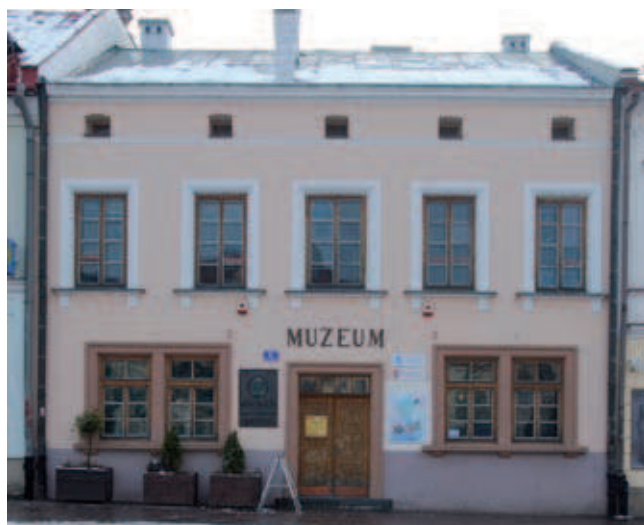
Rys. 6. Fasada kamienicy Rynek 6 – stan obecny