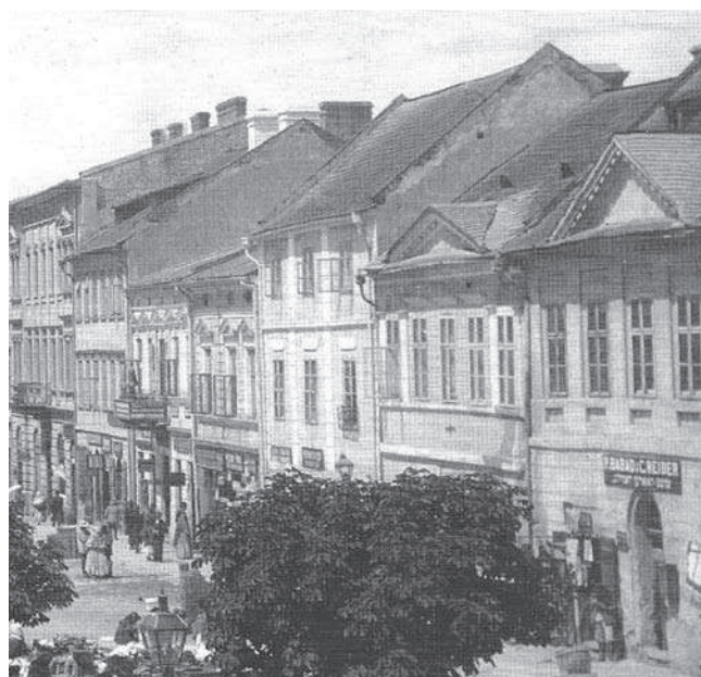
Rys. 7. Fasada kamienicy Rynek 22, XIX w.