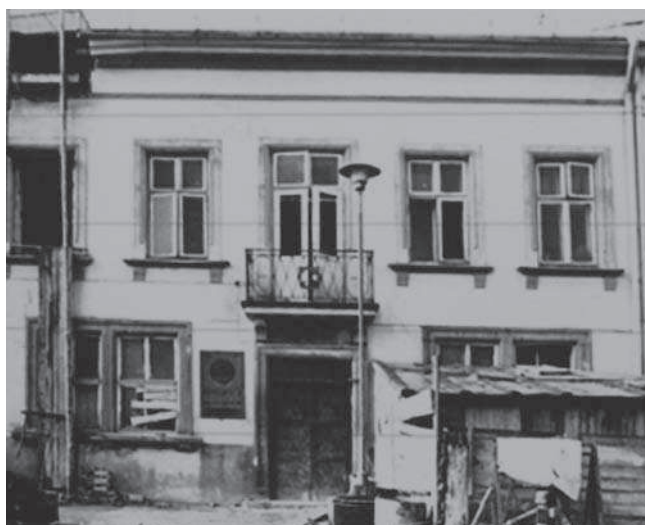
Rys. 5. Fasada kamienicy Rynek 6, XIX w.

Kamienica, której początki sięgają 1611 roku, znajdowała się od roku 1689 w rękach Matkiewiczów. Pierwotnie budynek wzniesiony w konstrukcji drewnianej uległ całkowitemu zniszczeniu w wyniku pożaru w 1708 roku. Obiekt odbudowany został dopiero w 1715 r. zyskując formę parterowej kamienicy, która charakteryzowała się drewniano-murowaną konstrukcją. Pod koniec