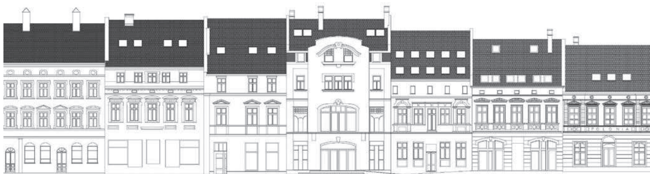
Pierzeja północna proponowane rozwiązanie