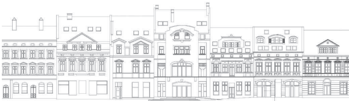
Pierzeja północna stan istniejący

Rys. 9. Fragment koncepcji rewitalizacji piątej elewacji w Rynku w Rzeszowie – autor W. Ogonek, nadzór naukowy M. Gosztyła