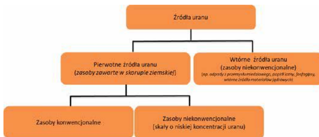
Rys. 1. Źródła uranu

opłacalne. Obecnie, za opłacalną, uważa się eksploatację bogatych rud uranu, pozwalających na produkcję tego pierwiastka po cenach niższych niż 130 USD/kg U_3O_8 . Według ostatniego wydania OECD/NEA Red Book takich zasobów uranu jest na świecie 5,7 mln ton [1]. Zasoby niekonwencjonalne, to są skały i materiały o bardzo niskiej zawartości uranu, w których występuje on przeważnie obok innych, wartościowych pierwiastków i uzyskiwany jest jako produkt uboczny przy wydobywaniu głównego surowca [2]. Do zasobów niekonwencjonalnych zaliczane są również produkty pośrednie z przemysłu i odpady zawierające uran.