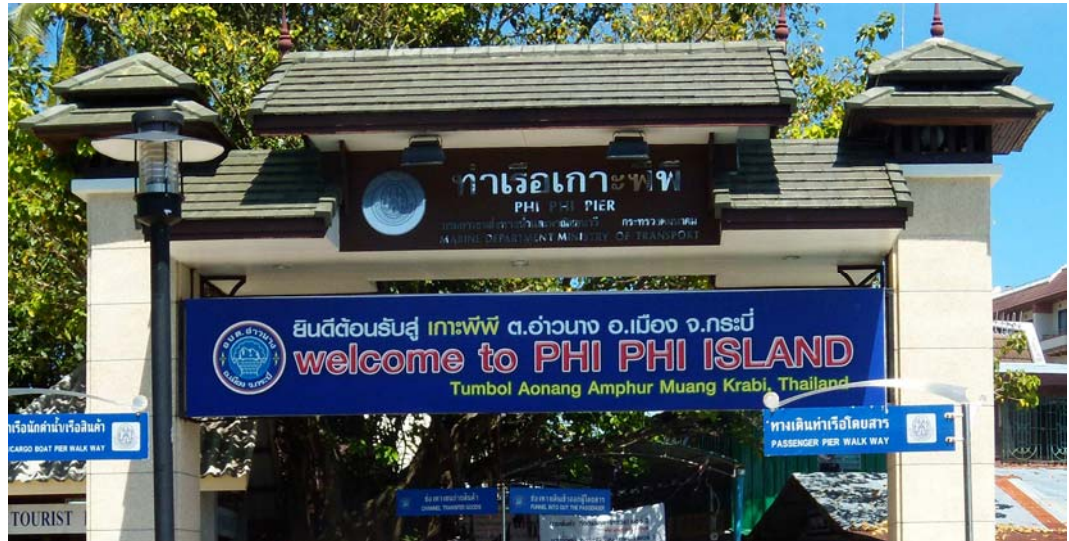
Fig. 2. Ko Phi Phi Don.

Ryc. 2. Ko Phi Phi Don.