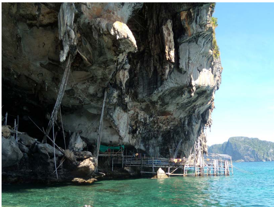
Fig. 8. Viking Cave.

The Tham Phaya Nak cave is also place where edible bird nests by the Swiftlet can be found. Due to the presence of the bird nest collectors, the access to the cave is strictly forbidden . [6] When travelling by boat it is possible to admire the cave, because most of the tour boats are stopping by the cave or slow down.