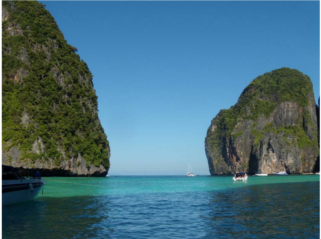
Fig. 5. Ko Phi Phi Lee, the view from Maya Bay. Ryc. 5. Ko Phi Phi Lee, widok z zatoki Maya.