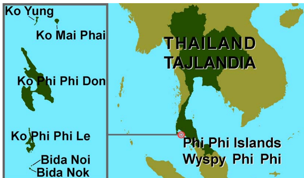
Fig. 1. Location of Phi Phi Islands.

The Phi Phi Islands are located on the Andaman Sea, in the south west of Thailand (fig. 1). These islands belong to the province of Krabi. Krabi is one of the 76 provinces of Thailand, known for its natural beauty. There are 6 islands in the Phi Phi Islands; these are: Ko Phi Phi Don, Ko Phi Phi Lee, Bida Nok, Bida Noi, Ko Mai Phai i Ko Yung.