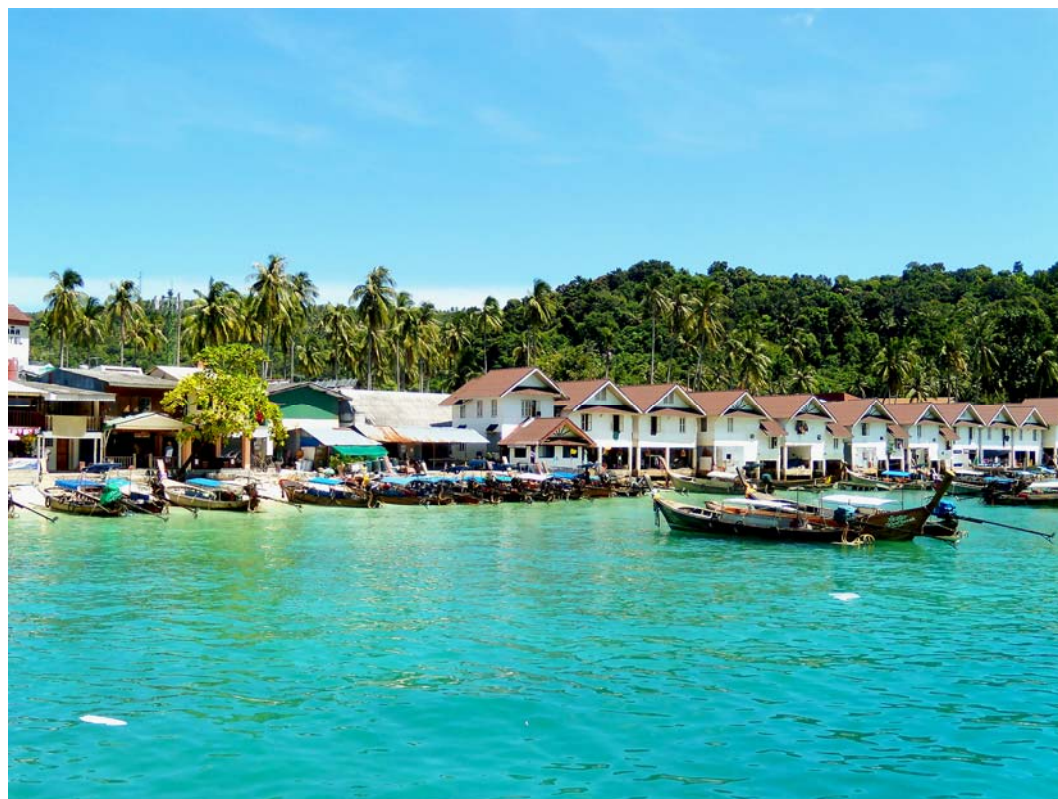
Fig. 9. Buildings on Ko Phi Phi Don.

Traditional wooden boats, one or just a few, can add charm to a seaside location. Unfortunately, when there is an excess, instead of an interesting addition to the landscape there is a huddle of boats, as shows two figures with number 11.