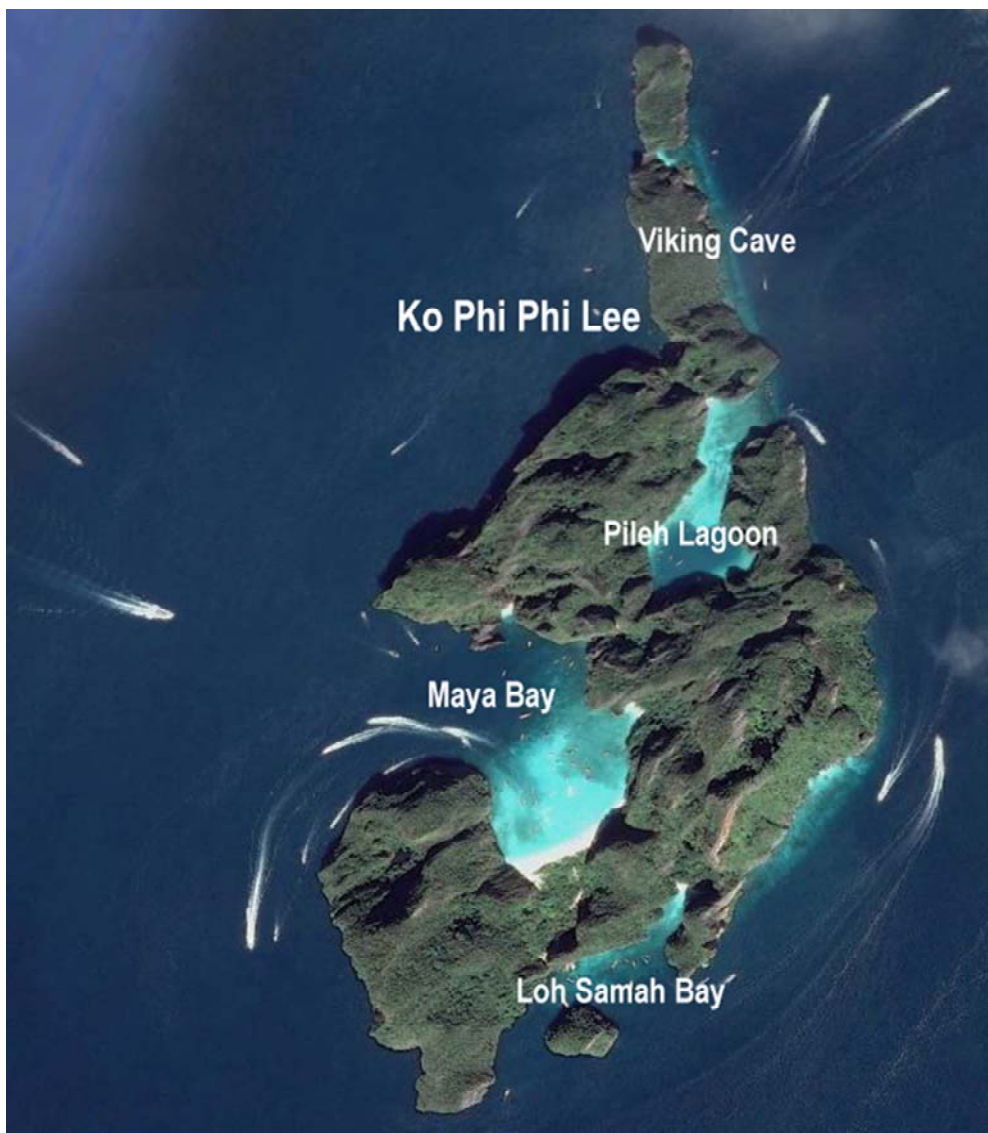
Fig. 4. Ko Phi Phi Lee, the view from Maya Bay.

Ko Yung, also called Mosquito Island, is located in the north of the archipelago, 5 km from Ko Phi Phi Don. It is a small island, about 700 meters long, with a sandy beach surrounded by cliffs and forest. Its common name is associated with the mosquitoes that appear on the island at sunset. In the cove in the north sharks can be seen.