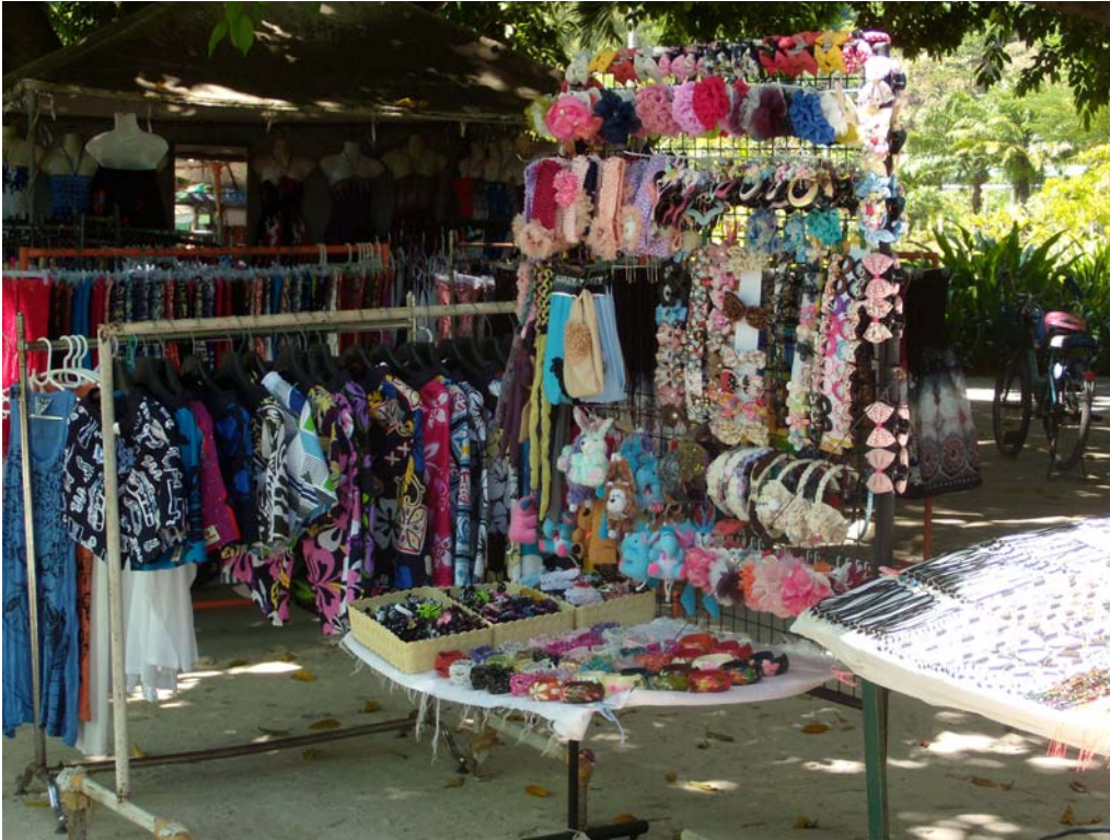
Fig. 13. Sales stand on Ko Phi Phi Don.

Ryc. 13. Stanowisko sprzedażna na Ko Phi Phi Don.