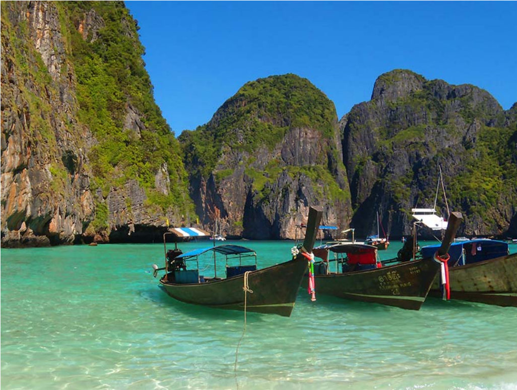
Fig. 6. Ko Phi Phi Lee, traditional boats.

Ryc. 6. Ko Phi Phi Lee, tradycyjne łodzie.