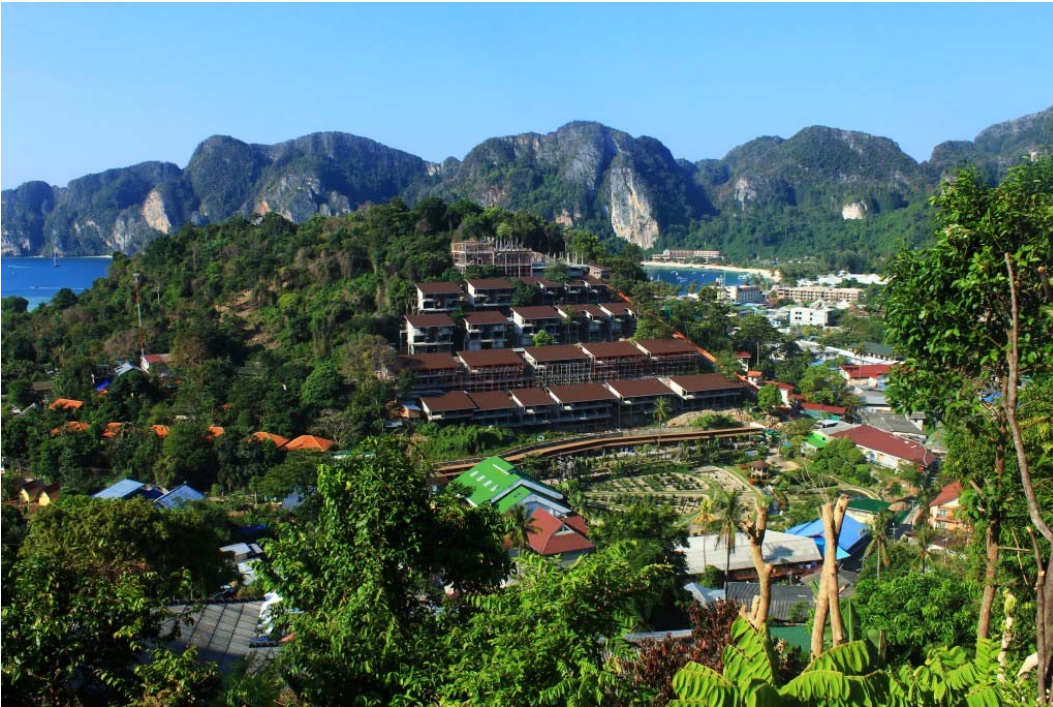
Fig. 10. View on Ko Phi Phi Don.

The buildings fit into the unchanged terrain, but the place where they are located is devoid of greenery. Each additional building placed in such a unique environment influences the perception of visitors and residents of this place.