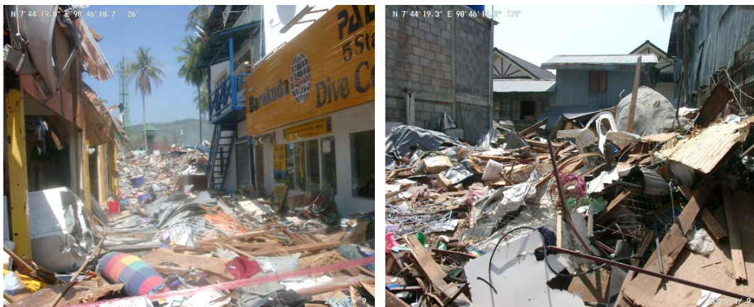
Fig. 14. View on Ko Phi Phi Don after Tsunami. Source: [26]

If tourism will not be limited, future generations may not have the opportunity to admire the islands in their present form. When contaminating the waters, admiring sea fauna and flora may not be possible (fig. 15). Being in the crowd does not allow the reception of space and nature in a calm and pleasant way. Phi Phi islands, the greatest advantage of being natural and wild can lose due to too big influx of people. This unique and beautiful landscape should be protected, to be as long as possible admired by subsequent visitors.