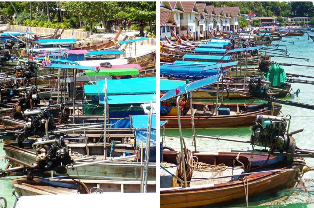
Fig. 11. Boats on Ko Phi Phi Don. Source: the author.

Ryc. 10. Widok na Ko Phi Phi Don. Źródło: [25].