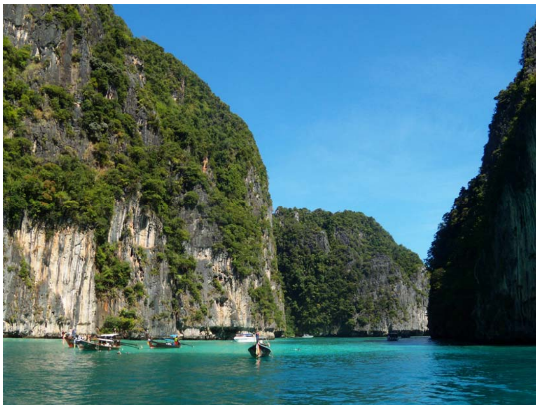
Fig. 12. Phi Phi Islands.

Water transport is often in poor technical condition, causing water pollution. Old diesel engines are releasing hundreds of liters of oil to the water during the launch, the water around Phi Phi Island is filled with oil stains. [3 p. 79-80] To prevent this, the legal rules are not enough. People need to be aware that inadequate equipment and ships are a threat to the environment and for themselves. Unfortunately, often the desire for profit or lack of opportunity to replace equipment or parts has terrible consequences.