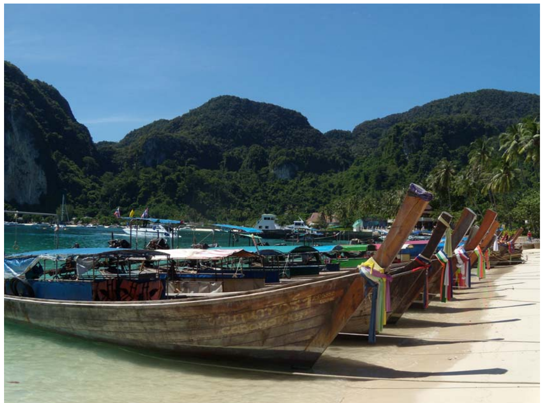
Fig. 3. Boats on Ko Phi Phi Don.

Ryc. 2. Ko Phi Phi Don.