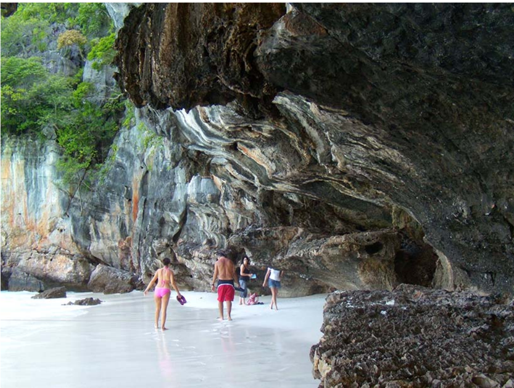
Fig. 7. Ko Phi Phi Lee, Maya Bay.

Ryc. 6. Ko Phi Phi Lee, tradycyjne łodzie.