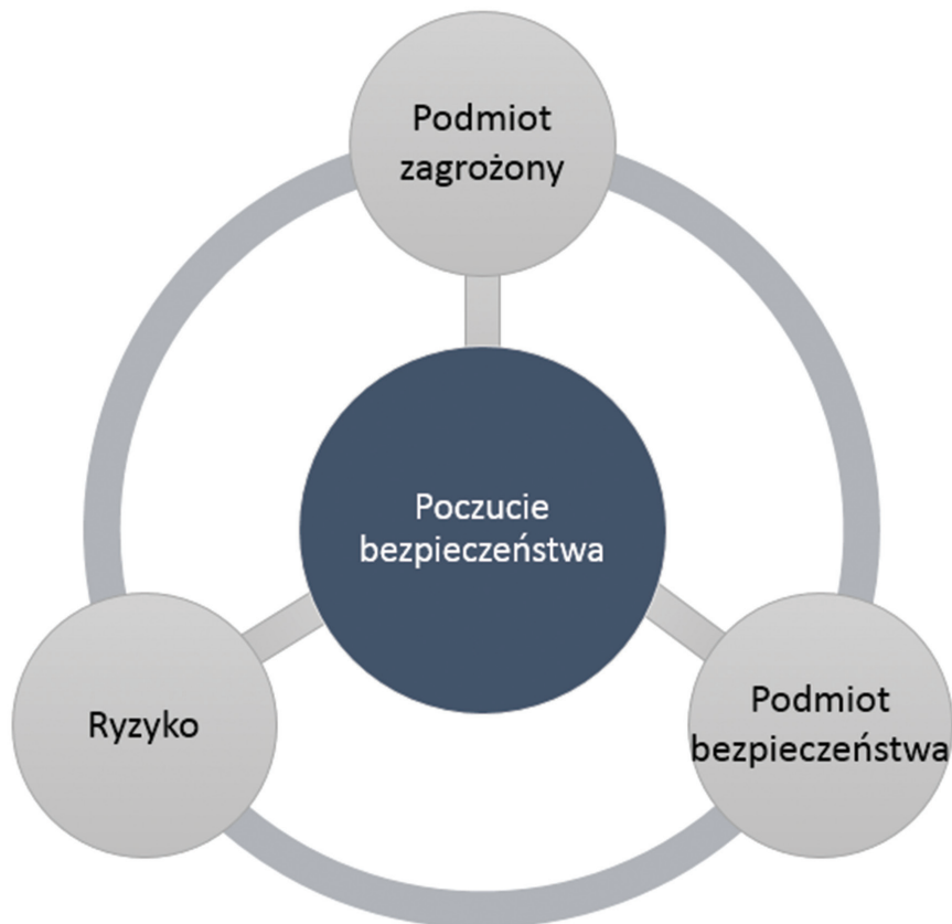
Rys. 1. Społeczne ujęcie poczucia bezpieczeństwa – model ogólny

Opisane powyżej modelowe ujęcie ogólne poczucia bezpieczeństwa na potrzeby nauk o bezpieczeństwie ukazano schematycznie na rysunku 1.