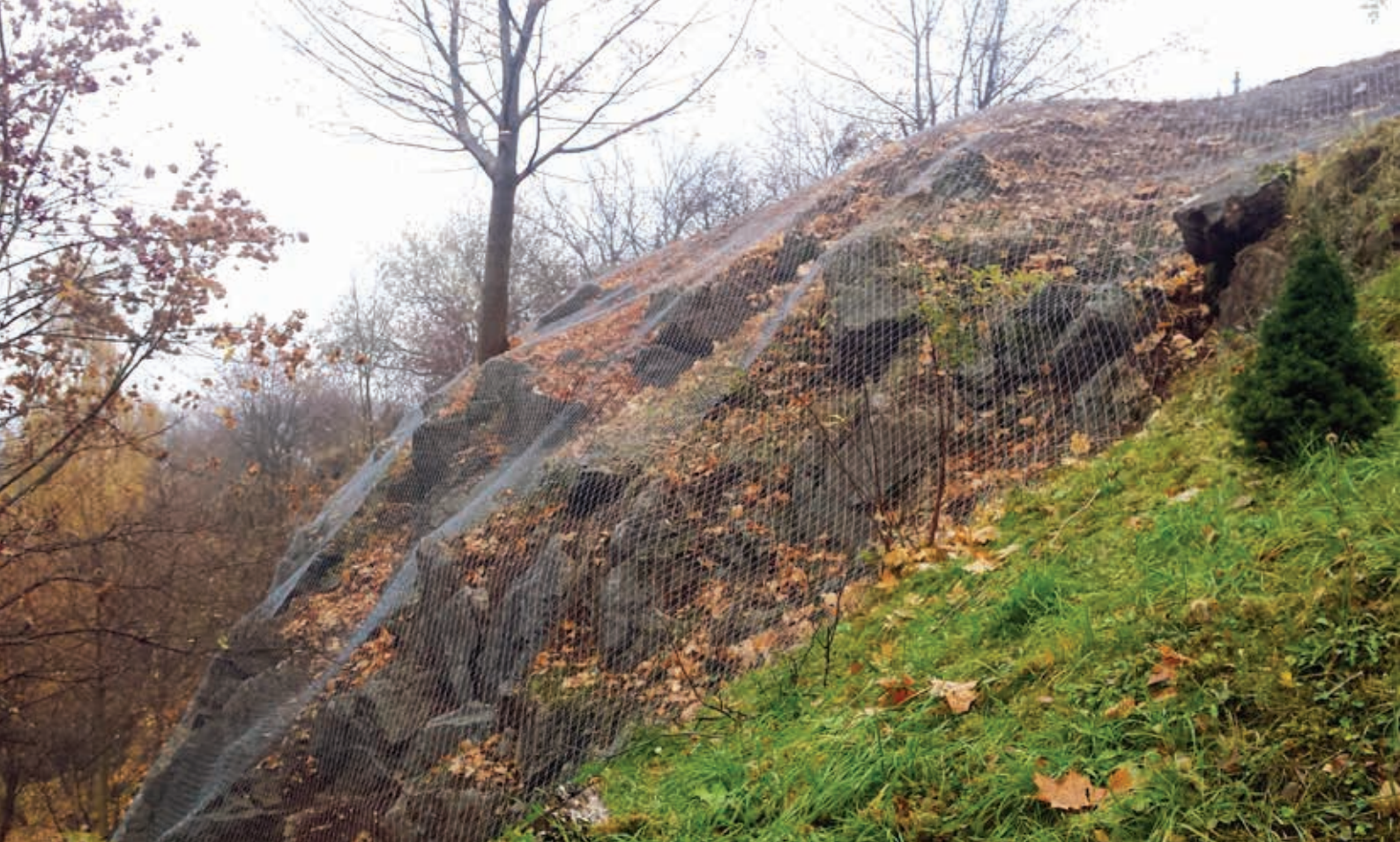
Kadzielnia, Kielce, kurtyna skalna TECCO G65/3 firmy Geobrugg