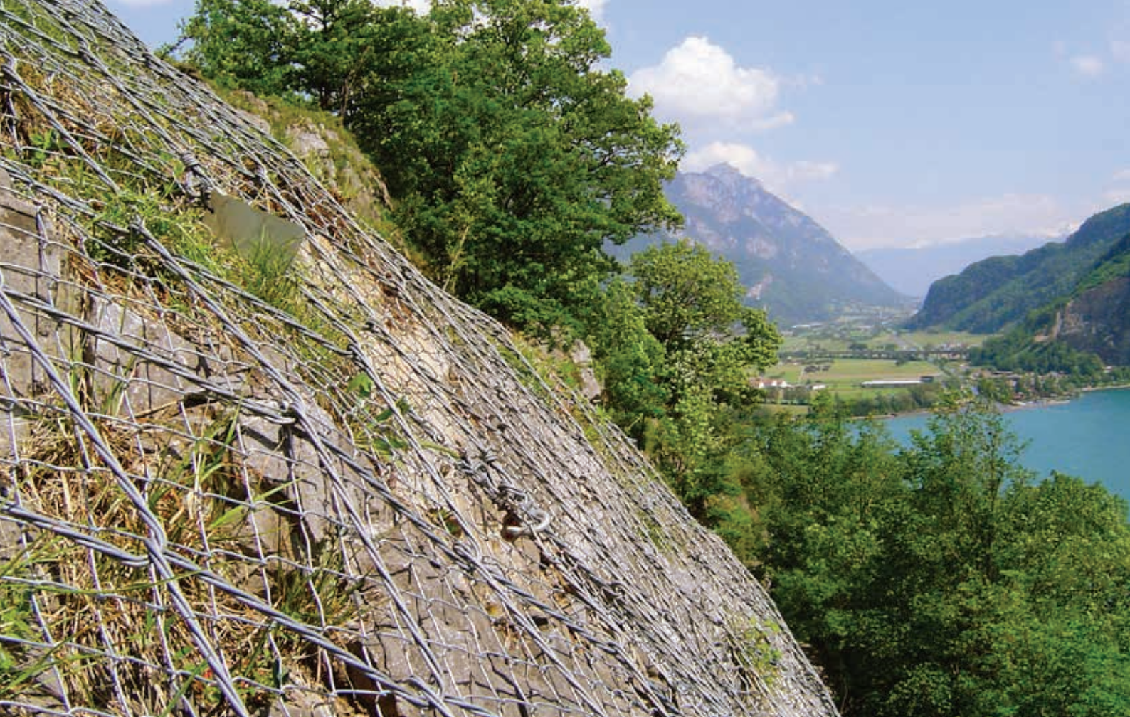
Walenstadt, Szwajcaria, siatka Spider S4-230 firmy Geobruigg