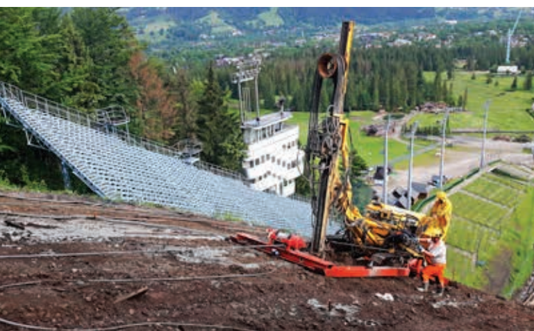
Wzmocnienie i przebudowa zeskoku Wielkiej Krokwi w Zakopanem przy pomocy systemu samowierzących mikropali iniekcyjnych TITAN, czerwiec 2017 r.

materiały gruntopodobne (odpady poprodukcyjne, żużle itp.), do których wprowadza się elementy metalowe, z tworzyw sztucznych lub inne, formując je w konstrukcje oporowe z gruntu zbrojonego. Oprócz skutecznego zabezpieczenia stateczności skarp i zboczy jednym z podstawowych walorów konstrukcji oporowych jest struktura zbliżona do naturalnego środowiska gruntowego.