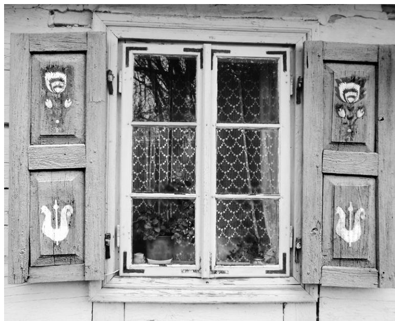
Ryc. 3. Okiennice; fot. autorka, 2014

wypełnić spiżarnię. W pokoju na środku stoi wielki stół, a na ścianach wiszą obrazy, lampy naftowe, a nawet stare aparaty fotograficzne, nie zabrakło również starych rodzinnych zdjęć oraz zegarów z kukułką. Pod oknem, koło łóżka stoi wielki zielony kufer. W drugiej części domu, gdzie mieszkała ciotka gospodarza, można znaleźć kołowrotek, drewnianą szafę i starą pryczę (ryc. 5). Na półkach w całym domu można zresztą zobaczyć przedmioty z różnych epok – wszystko ma tu swoje miejsce.