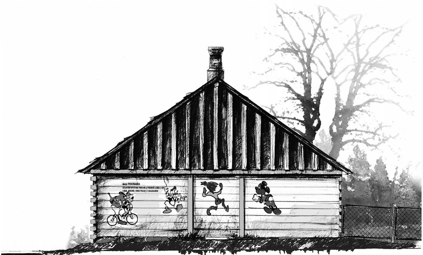
Ryc. 10. Elewacja północna; rys. autorka