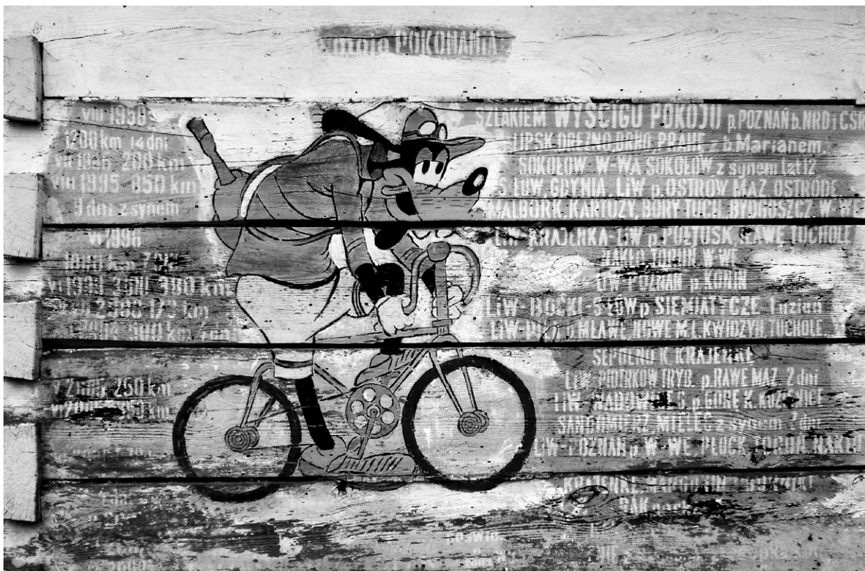
Ryc. 7. Fragment elewacji północnej; fot. autorka, 2014