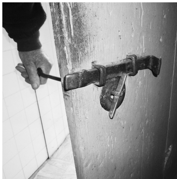
Ryc. 4. Klucz wykonany w XIX wieku; fot. autorka, 2014