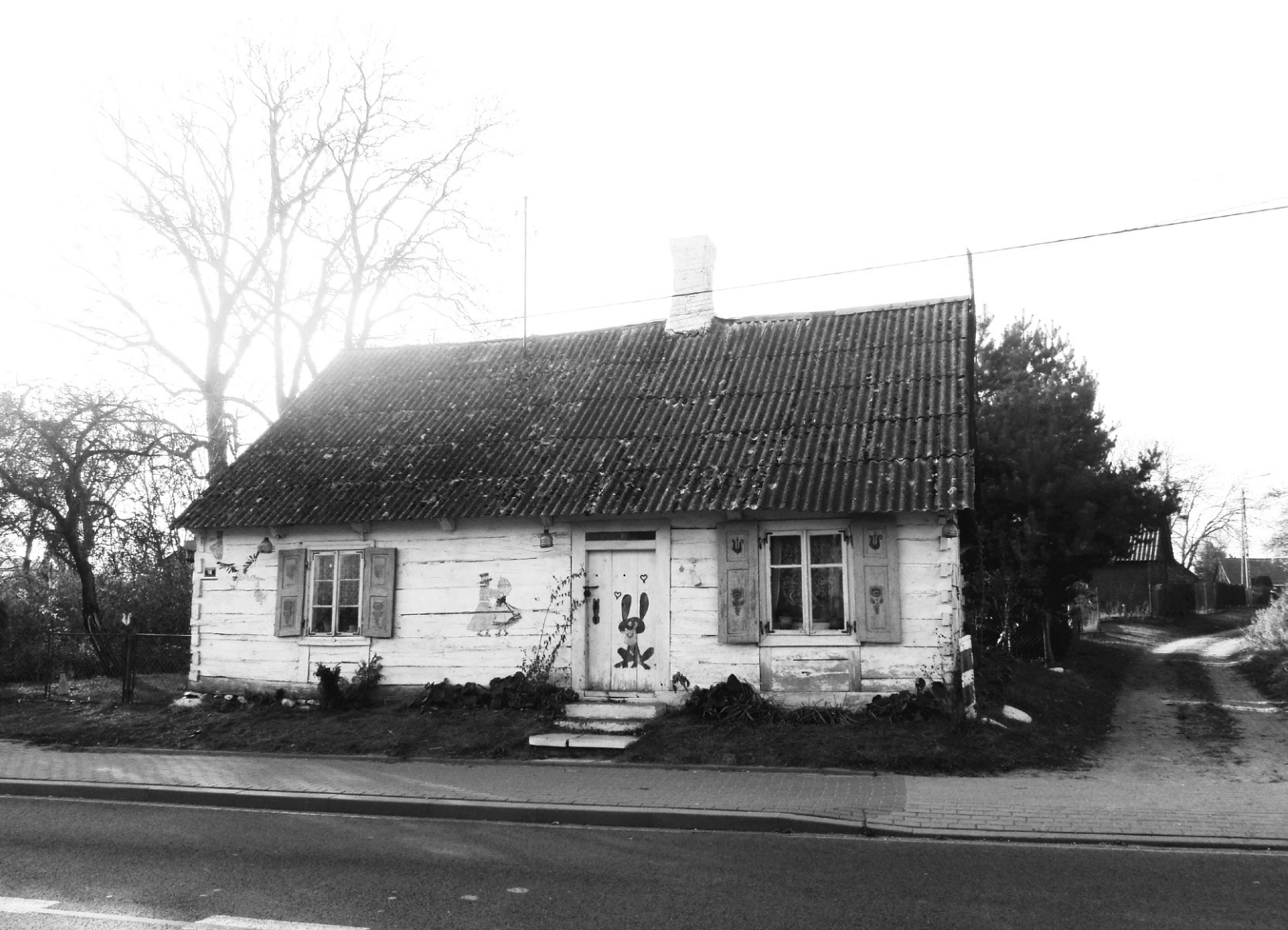
Ryc. 1. Widok domu od ulicy Nowomiejskiej; fot. autorka, 2014