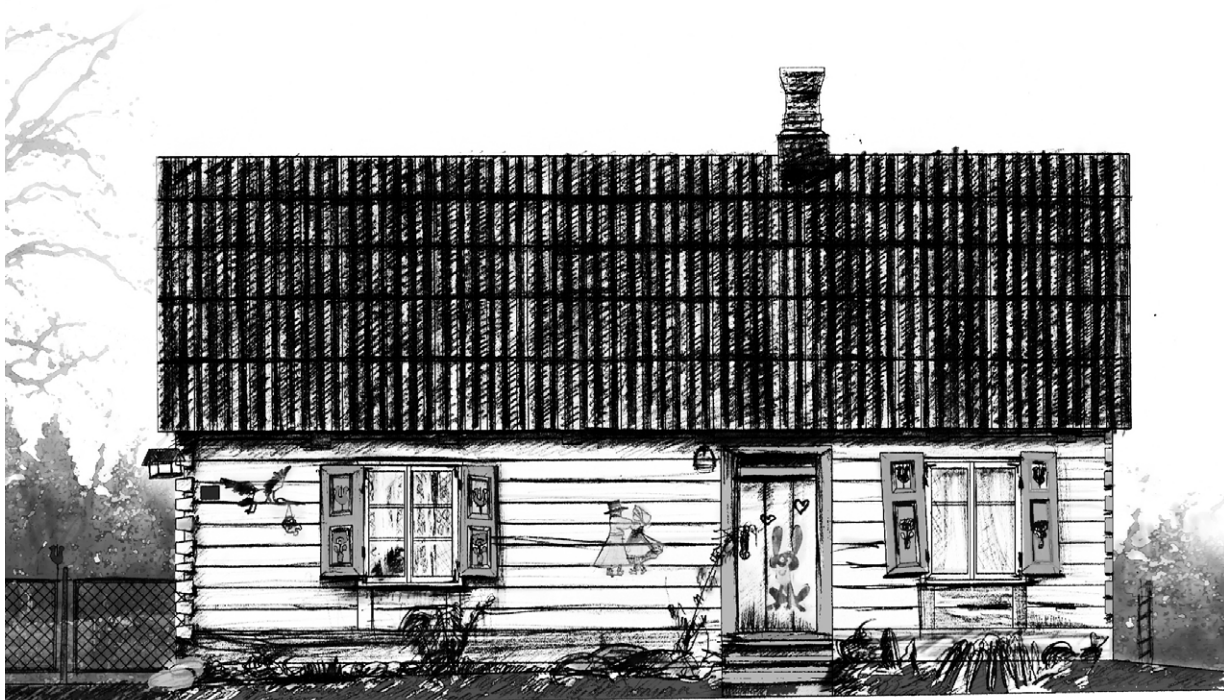
Ryc. 8. Elewacja wschodnia; rys. autorka