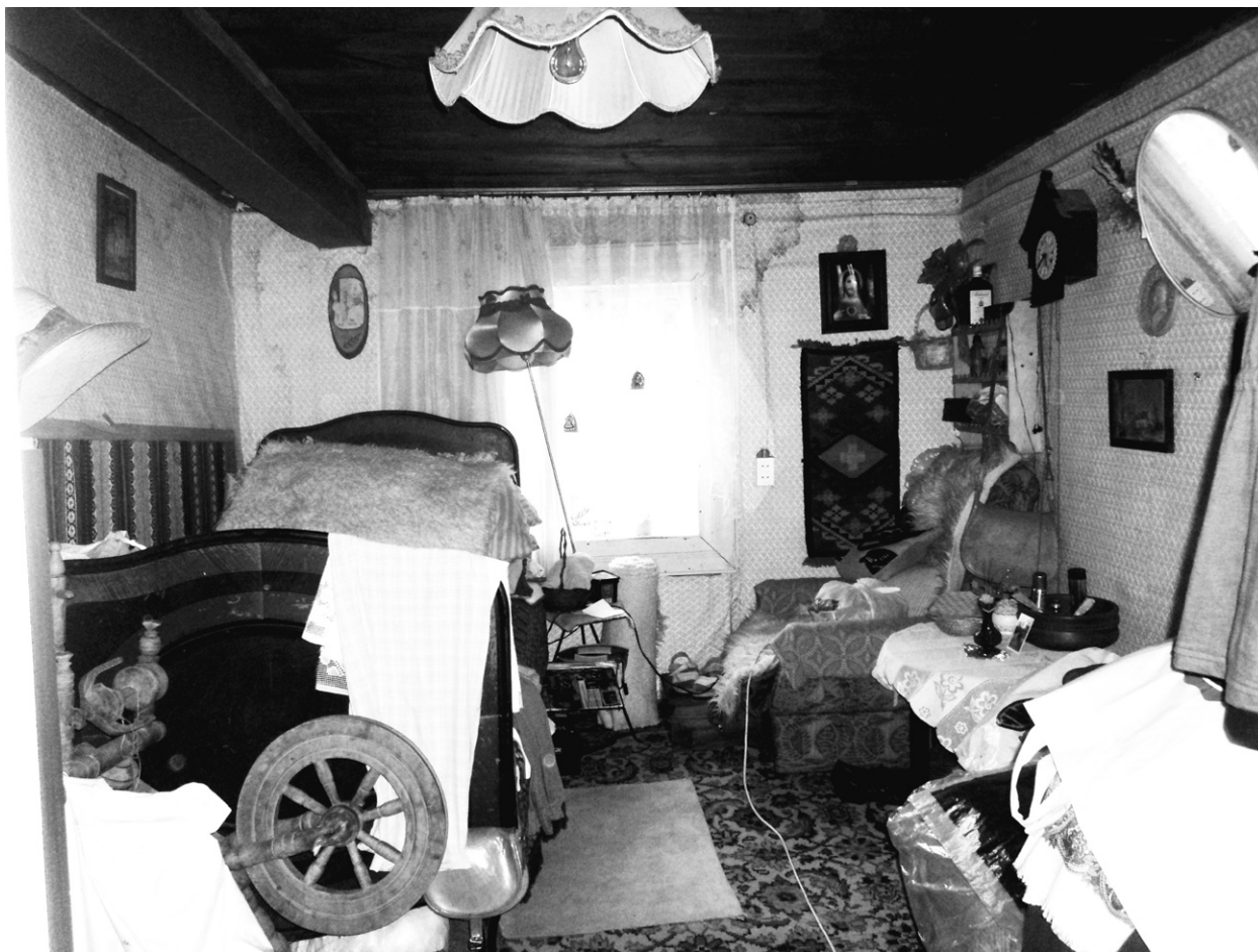
Ryc. 5. Kolowrotek i prycza; fot. autorka, 2014