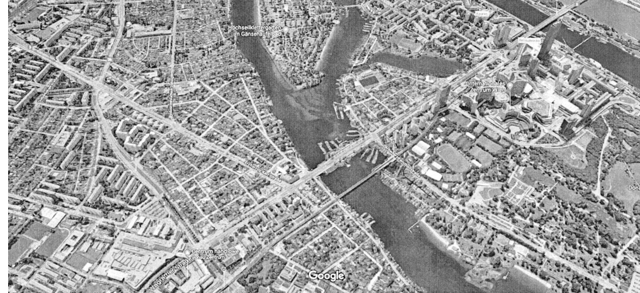
il. 1. Dunaj w Wiedniu. Zdjęcie lotnicze Google Maps / Danube River in Vienna

może to spowodować zniszczenie systemu wodnego ważnego dla łęgów naddunajskich. Wiedeńczycy mają nadzieję, że w trakcie konsultacji społecznych, podobnie jak z Łęgami tak i z tą inwestycją uda się rozwiązać sprawę zgodnie z zasadami zrównoważonego rozwoju, zachowując unikatowe wartości rejonu. Kilka istotnych informacji na temat zawartości i potencji zespołu wiedeńskiego nazwanego Zielonym Wiedniem. Na obszarze tym zajmującym 50 % terytorium miasta jest około 850 parków, wielki teren obejmujący Zielony Prater to 6 mln. m 2 powierzchni. Są też: ogród botaniczny z kilku tysiącami gatunków roślin alpejskich w ramach ogrodu alpejskiego, rezerwat biosfery Las Wiedeński o powierzchni 1350 km 2 z bogactwem gatunków roślin i zwierząt. W ramach terenów zielonych miasta, władze Wiednia podają liczbę zieleni wysokiej w ilości ponad 600 tysięcy drzew. [il.1.]