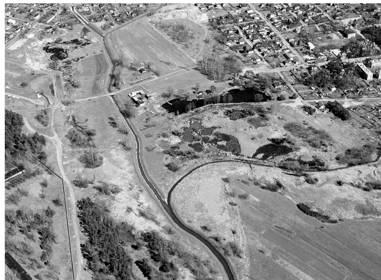
il. 3. Ner w Łodzi. Zdjęcie lotnicze / Ner River in Lodz