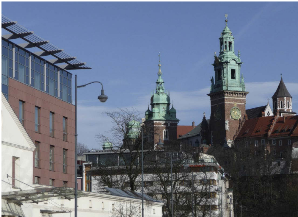
II. 5. Przeskalowane i obce w formie bryły hoteli zbudowane w przedpolu widokowym Zamku Królewskiego na Wawelu od strony ulicy Powiśle i zakola Wisły.