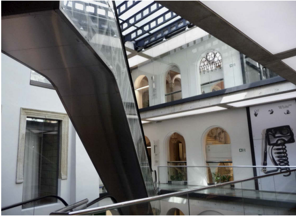
II. 3. Kraków, pasaż handlowy Rynek 13, adaptacja zabytkowej kamienicy i dziedzina na obiekt handlowy.