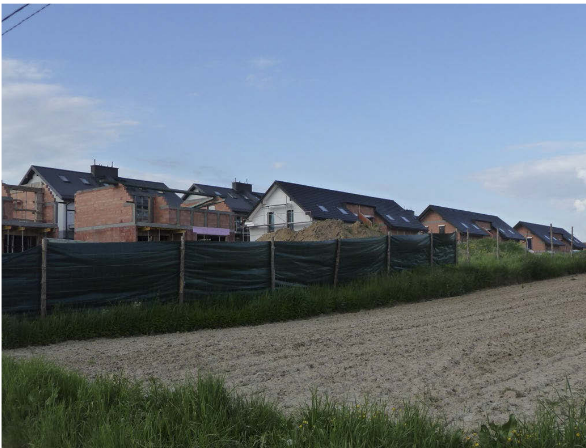
Il. 12. Szereg budynków indywidualnych, powstających na niedawnych terenach rolnych na północ od Krakowa.