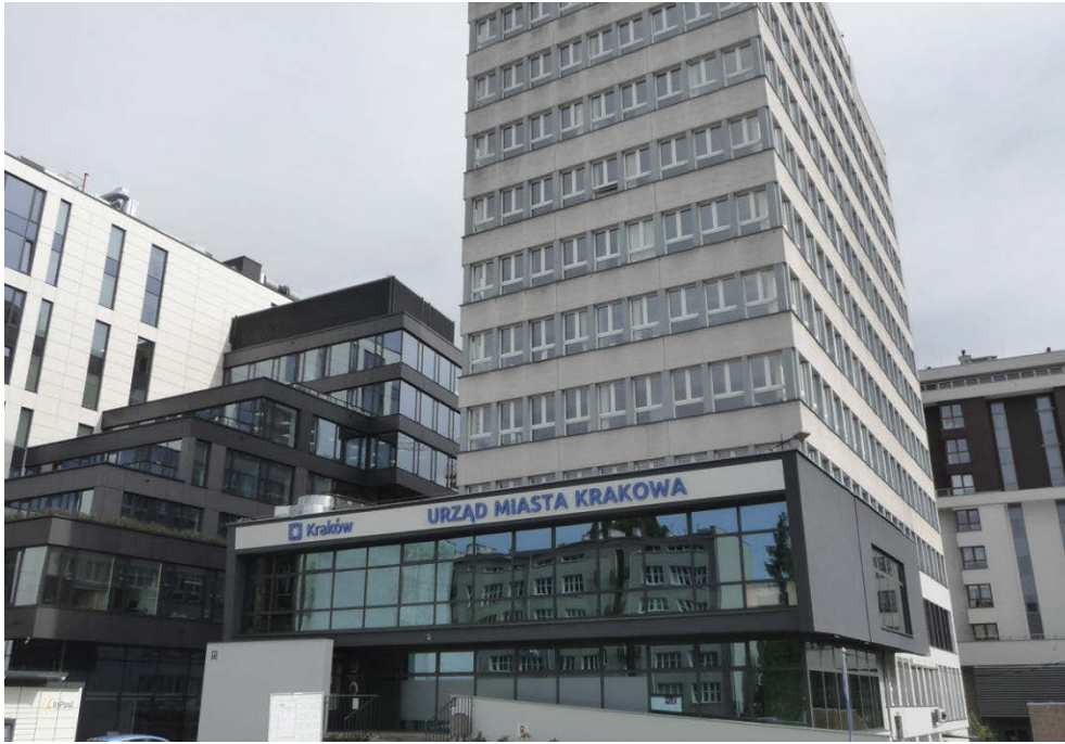
II. 7. Chaotyczne nagromadzenie przypadkowych kubatur wokół budynku Urzędu Miasta Krakowa — siedziby Wydziału Planowania Przestrzennego przy ulicy Mogilskiej.

III. 7. The seat of the Spatial Planning Department in Mogilska Street — a chaotic agglomeration of structures surrounding the Krakow City Hall.