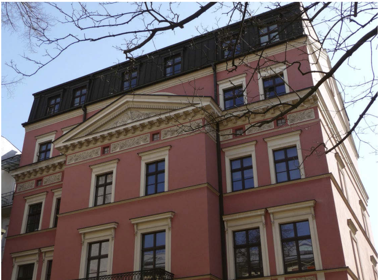
II. 2. Obecnie tzw. „Pałacyk Pod Orłem” z XVIII wieku. W 2004 roku nadbudowany o dwie kondygnacje stracił proporcje i swój charakter. Ulica Krupnicza w Krakowie.