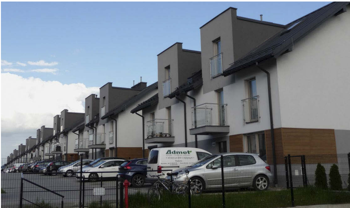
Il. 11. Ciąg budynków mieszkalnych poza zainwestowaniem miejskim, na północ od Krakowa, okolice ulicy Pękowickiej (fot. B. Bartkowicz).