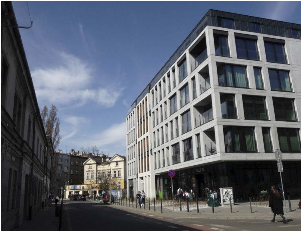
II. 4. Kraków, ulica Dolnych Młynów. Przeskalowana brutalna kubatura apartamentowca w sąsiedztwie zabytkowych kamieniczek i dawnych zakładów tytoniowych.