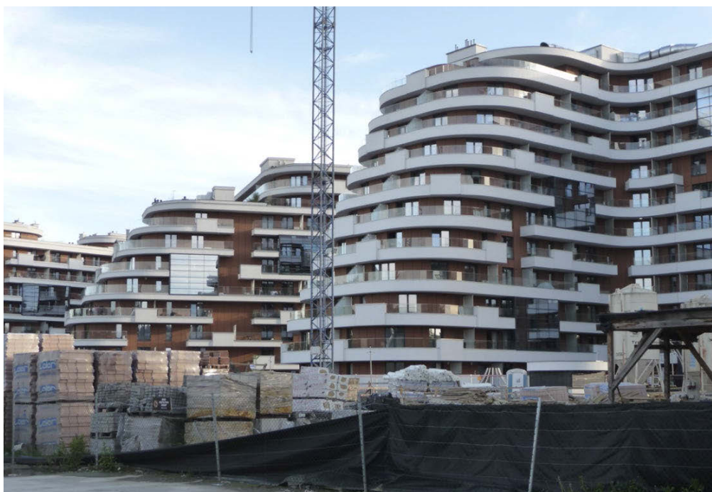
II. 6. Kraków, śródmieście. Ogromne i nieestetyczne bryły obiektów mieszkalnych — „Wiślane Tarasy” — na terenie dawnych zakładów Zieleniewskiego w sąsiedztwie domu społecznego tych zakładów (potem kino Związkowiec, obecnie Teatr Varieté) w rejonie ulicy Grzegórzeckiej.