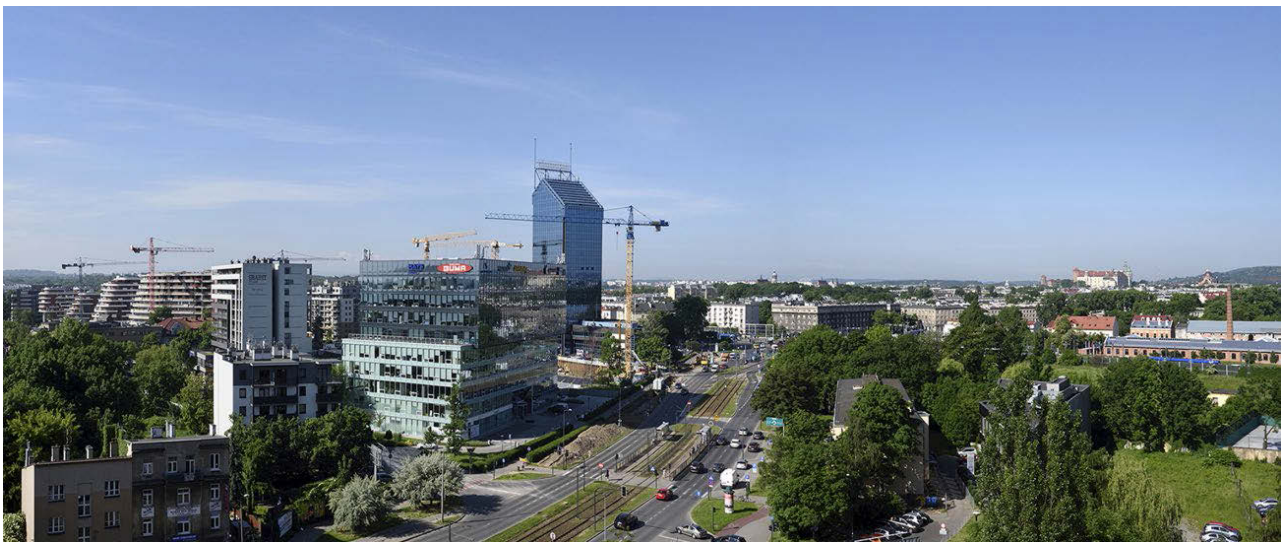
II. 10. Śródmieście Krakowa, rejon ronda Grzegórzeckiego. Konglomerat chaotycznej zabudowy mieszkaniowo-biurowej pozostający w ostrym konflikcie z widoczną częścią panoramy Starego Miasta i sylwetą Wawelu.

III. 9. A large cluster of dense development twice as high as the average of the vicinity, downtown Krakow, Mogilska Street area.