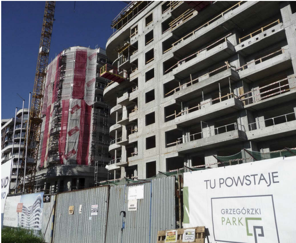
II. 8. Nagromadzenie zagęszczonej przeskalowanej zabudowy mieszkaniowej bez miejsca na zielen, nazwanej „Grzegórzki Park”, pomiędzy ulicami Francesco Nullo a Cystersów w Krakowie.

III. 7. The seat of the Spatial Planning Department in Mogilska Street — a chaotic agglomeration of structures surrounding the Krakow City Hall.