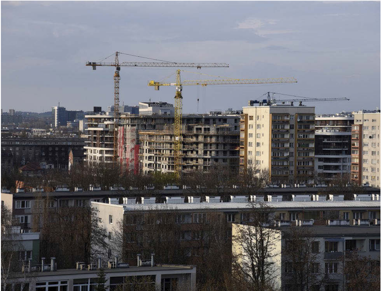
II. 9. Rozbudowywane duże skupisko zagęszczonej zabudowy dwukrotnie wyższej od istniejącej w sąsiedztwie, śródmieście Krakowa, rejon ulicy Mogilskiej.

III. 9. A large cluster of dense development twice as high as the average of the vicinity, downtown Krakow, Mogilska Street area.