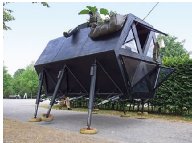
1. Walking House (Spacerujący dom) autorstwa pracowni N55, 2009. Obiekt osiąga maksymalną prędkość 60 m/godz.

Działania te obejmują szereg projektów-realizacji ale i koncepcji, które choć nie zostały wcielone w życie, wzbogacają obszar działań architektonicznych o nowe elementy w formie utopijnych wizji, czy też symbolicznych kreacji. To działania/obiekty/projekty, które nie dają się jednoznacznie zaklasyfi-