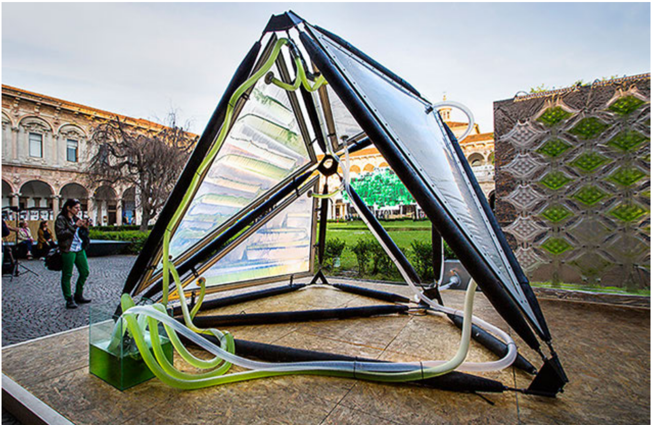
3. Prototyp Urban Algae Canopy autorstwa EcoLogicStudio, EXPO Milano, 2015.