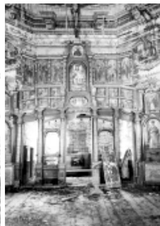
Ikonostas przed demontażem w 1964 roku, dziś w Muzeum zamku w Łańcucie