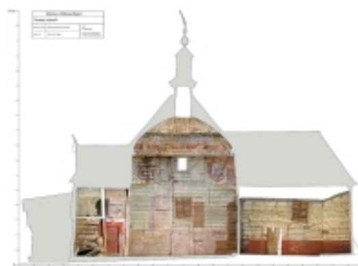
Dokumentacja laserowa wnętrza cerkwi, KOBiDZ 2006