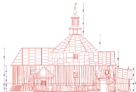
Elewacja północna cerkwi, pomiar cyfrowy IHAiKZ WAPK, 2006