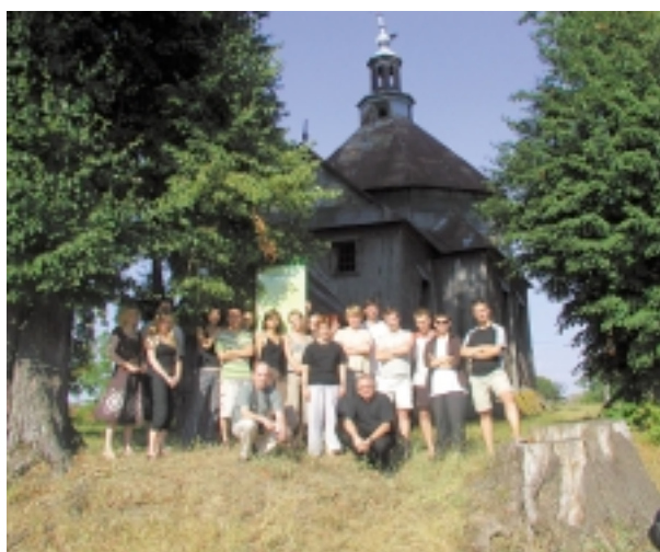
Grupa studentów Politechniki Krakowskiej na praktyce wakacyjnej pomiarowej w Miękiszu Starym, lipiec 2006