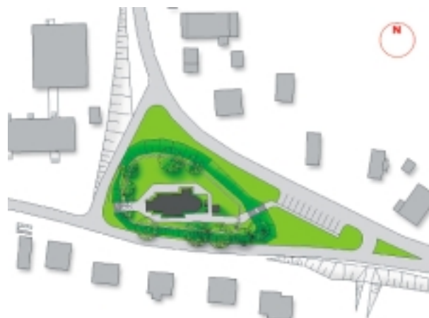
Plan sytuacyjny, projekt zagospodarowania