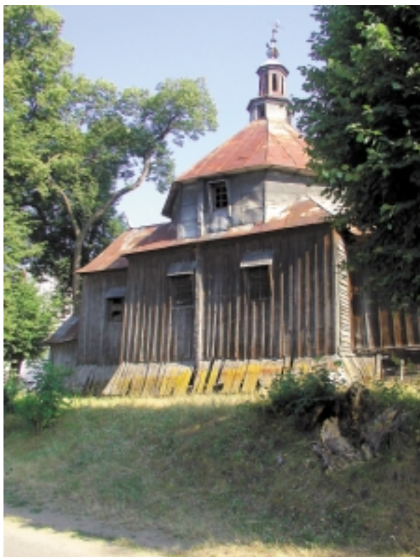
Widok cerkwi od południa, stan z roku 2006