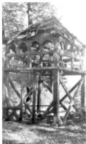
Zniszczona, nieistniejąca dziś dzwonnica cerkwi, stan z 1964 roku

Kolejną fazą badań było wykonanie kompleksowej dokumentacji inwentaryzacyjnej.