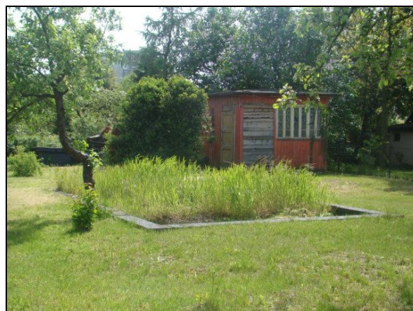
Fot. 2. Przykład "sztucznie" użytkowanej działki w ROD im. Chociszewskiego. Photo 2. Example of "the "artificially" used plot in Chociszewski ROD.