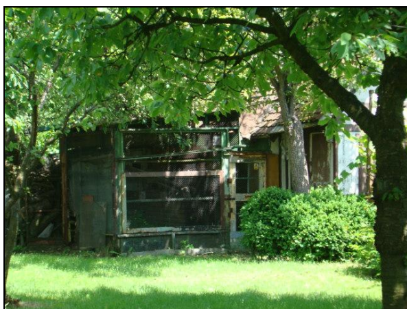
Fot. 3. Przykład "sztucznie" użytkowanej działki z pozostałością po kurniku w ROD im. Chociszewskiego. Photo 3. The example of "the "artificially" used plot with the destroyed cote in Chociszewski ROD.