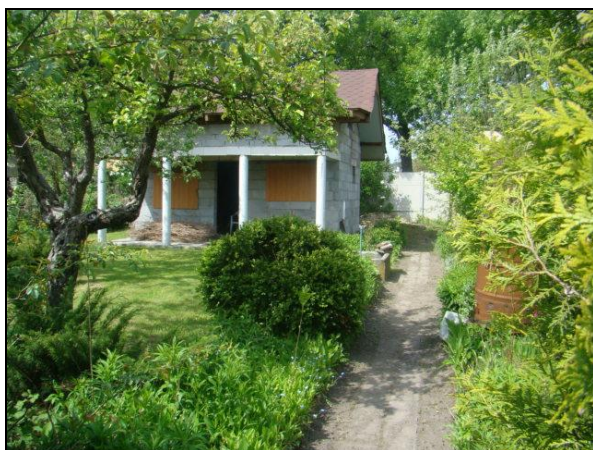
Fot. 5. Niedokończona budowa altany ogrodowej w ROD im. Chociszewskiego. Photo 5. Unfinished build of a garden bower in Chociszewski ROD.