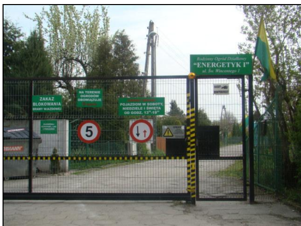
Fot. 1. Wejście do ROD "Energetyk I". Photo 1. Entrance to "Energetyk I" ROD.