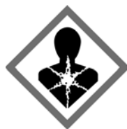
Rys. 1. Piktogram ostrzegawczy – zagrożenie dla zdrowia