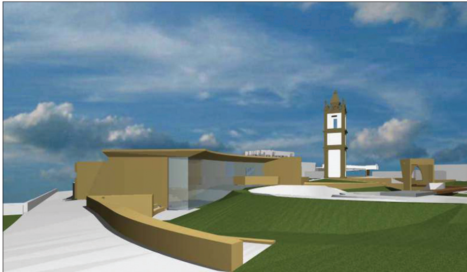
9. Projektowany budynek muzeum przy zachodnim stoku fortyfikacji, w obszarze opracowania znajduje się wieża zegarowa, z projektowanym wejściem-portykiem, portal dawnego cmentarza oraz budynek pomocniczy z belwederem.