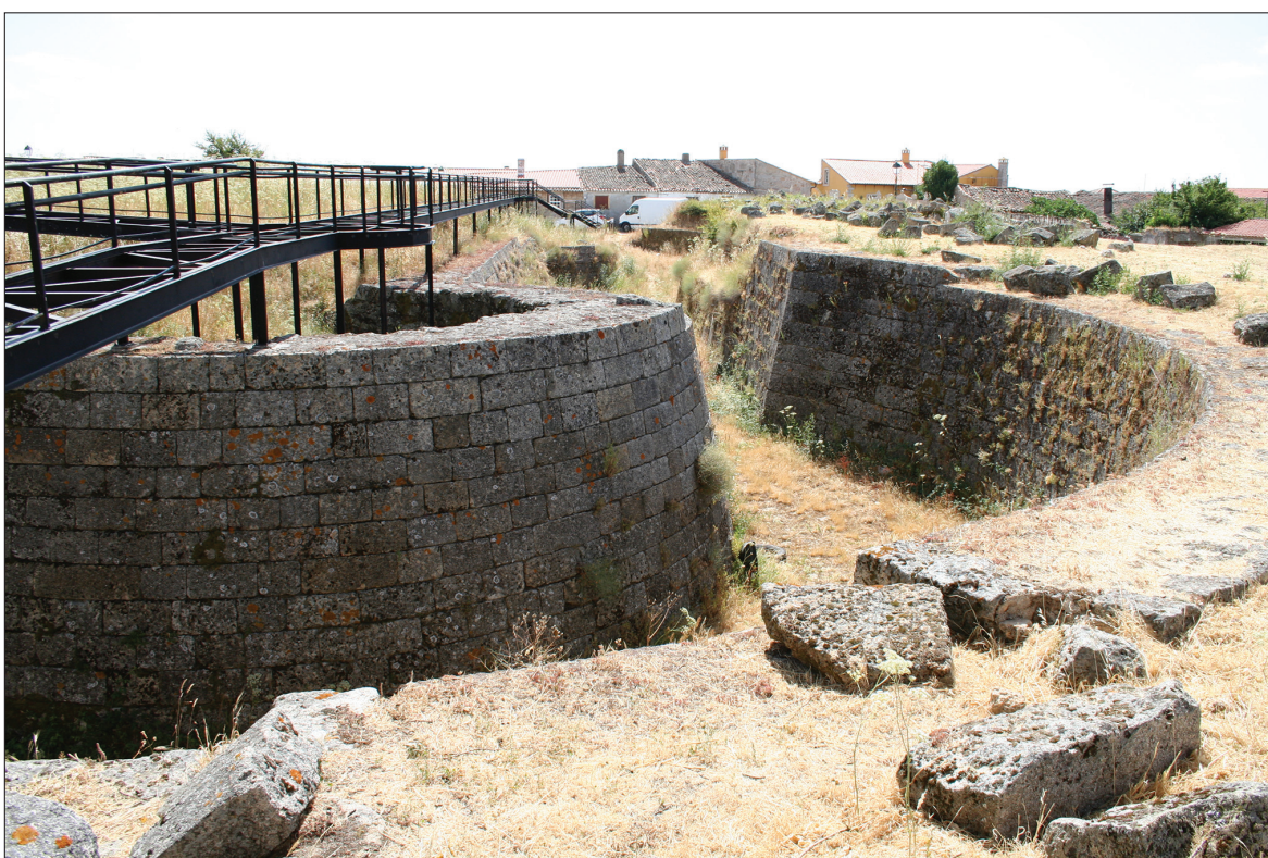
4, 5. Stan zachowania obszaru zamkowego po pracach konserwatorskich przeprowadzonych w latach 40. i 70. XX w.

4, 5. Present state of the site after the conservation works in 1940s and 1970s.