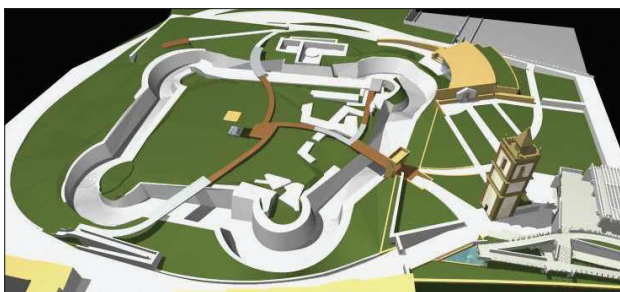
1. Wizualizacja planu ochrony obszaru wokół zamku (miejsce wykopaliisk archeologicznych). Oprac. autor 1. General perspective of the rehabilitation urban plan (archaeological site). Prepared by the author

Można zadawać pytanie, czy istotnie stanowisko archeologiczne jakim jest obszar dawnego zamku, zaniedbane i niekompletne – może posłużyć do odtworzenia faz jego budowy i określenia cech architektury obronnej od średniowieczna do czasów nowożytnych. Naturalnie jest to możliwe pod warunkiem, że oprócz posłużenia się dokumentacją historyczną uważnie obserwujący badacz-architekt znajdzie klucz do odtworzenia mowy kamieni oraz elementów krajobrazu zachowanych in situ i wokół twierdzy. Historyczne znaczenie obiektu dla architektury Portugalii upoważnia do podjęcia próby jego odtworzenia, ponieważ zamek króla Dinisa jest jednym z najważniejszych przykładów architektury wojskowej w stylu manuelińskim, określanym jako „przejściowy” (il. 1).