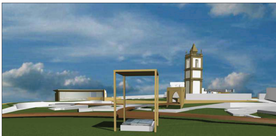
12. Dominanty kompozycyjne koncepcji projektu (widok ze środka ruin zamku). Oprac. autor 12. Most expressive points of the proposed intervention (view from the centre of the Castle's ruins). Prepared by the author