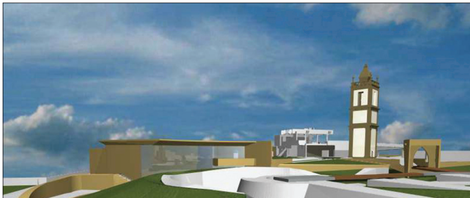
10, 11. Muzeum i jego położenie w relacji do stoku obronnego północno-wschodniego narożnika fortecy.