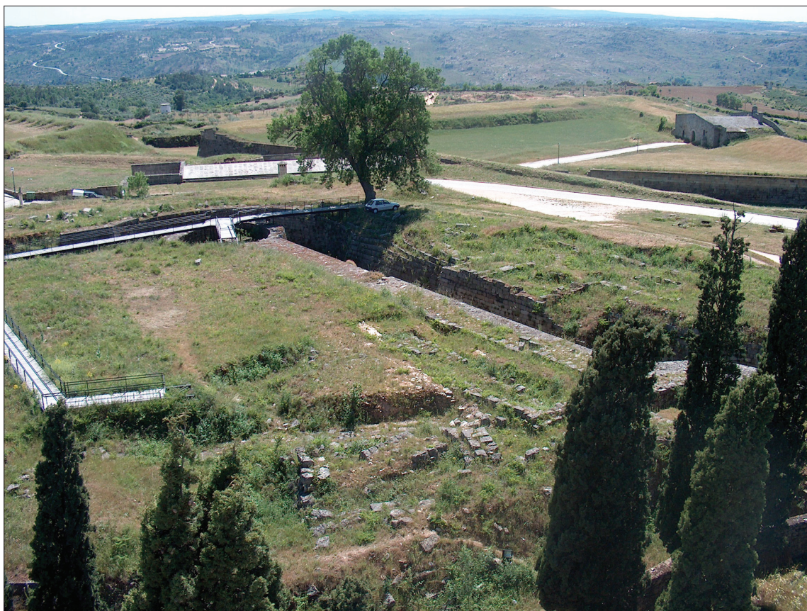
2, 3. Pozostałości średniowiecznych fortyfikacji, widok z wieży kościoła. 2, 3. The remains of the medieval fortification, view from the tower of the church.