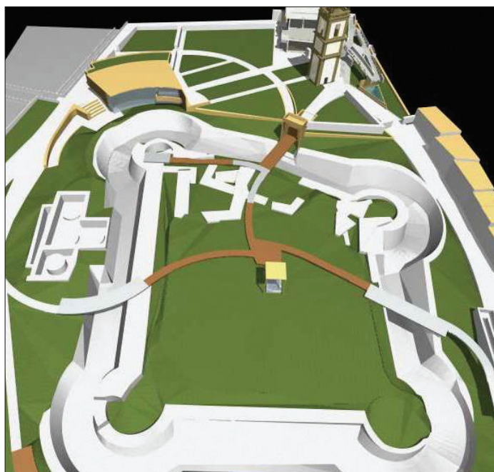
13. Widok ogólny od strony południowej. Oprac. autor 13. Overview from the south. Prepared by the author

wstanie nowej zabudowy, zasłaniającej istniejące obiekty niepasujące charakterem do miejsca, która pomieściłaby sprzęt i infrastrukturę na potrzeby odwiedzających. Ze względu na położenie zabudowa ta będzie miała wspaniały panoramiczny widok na malowniczy i do dziś nie zdegradowany krajobraz Mesety, wyżynno-górskiej krainy położonej w centrum Półwyspu Iberyjskiego.