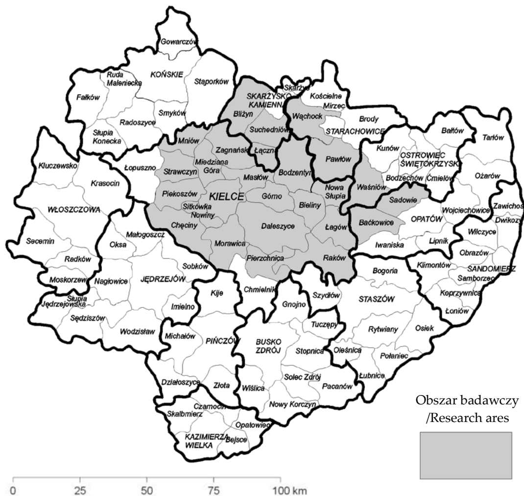
Ryc. 1. Region Gór Świętokrzyskich – podział administracyjny.