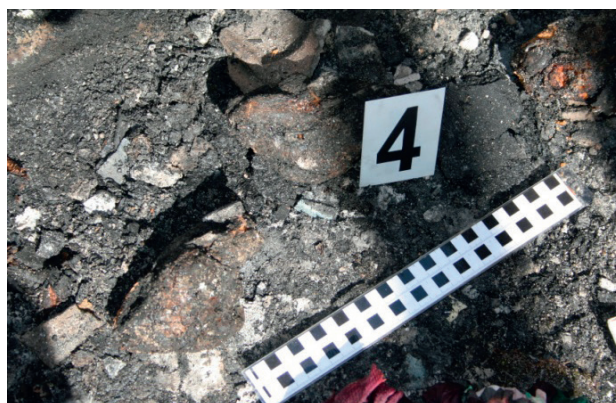
Ryc. 12. Fragment nadpalonej stopy ludzkiej. Fragment nadpalonej stopy ludzkiej, z kawałkiem ciała zawierającego tkankę kostną, mięśniową oraz część skóry

Fig. 12. Fragment of a partially burnt human foot.