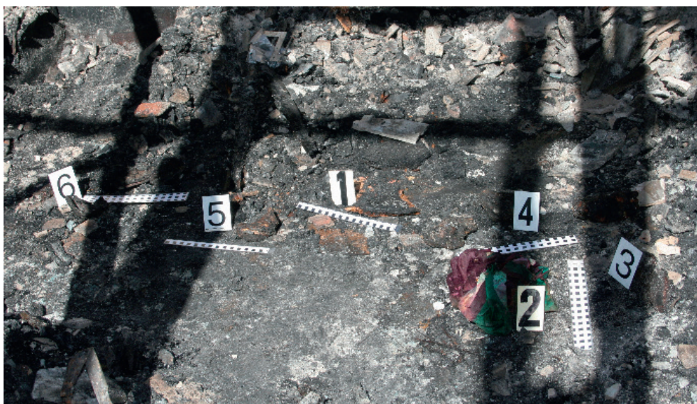
Ryc. 8. Obraz ogólny rozmieszczenia poszczególnych śladów w miejscu znalezienia zwłok (szczątków ludzkich)