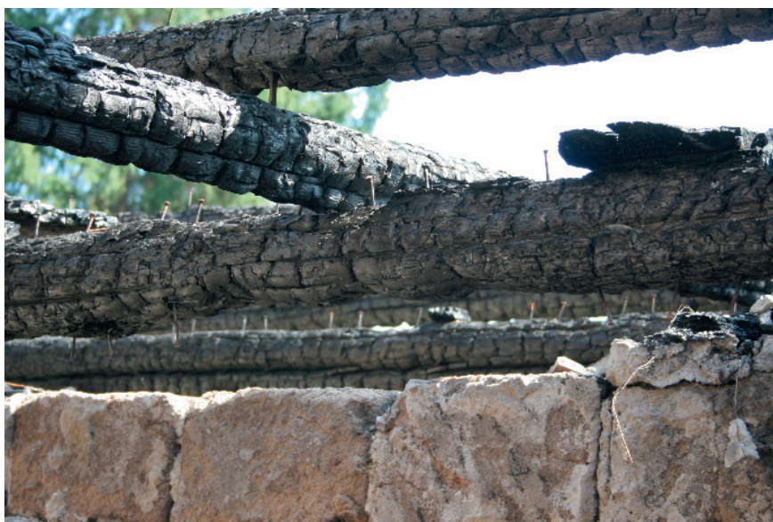
Ryc. 3. Zbliżenie przewężenia belki konstrukcyjnej nad otworem drzwiowym Fig. 3. A close up view of a constricted construction beam above the door opening

drzwiowym (widoczne przewężenia belki konstrukcyjnej; ryc. 3) i analogicznie – po przeciwnej stronie otworu po drzwiach (ryc. 4).