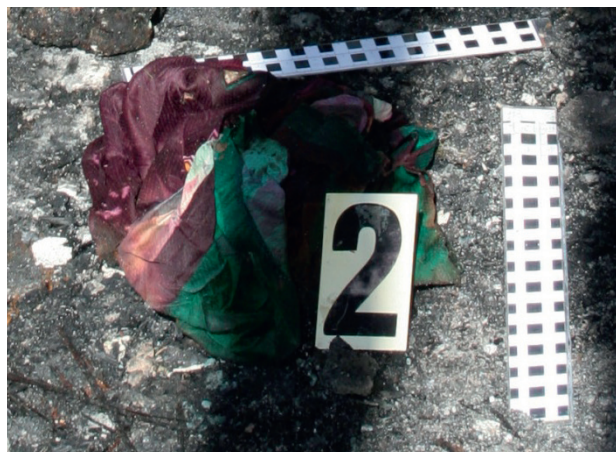
Ryc. 10. Fragment kolorowej koszulki o słabo wyczuwalnej woni substancji ropopochodnej

Fig. 10. Fragment of a coloured t-shirt with a barely perceptible odour of oil products