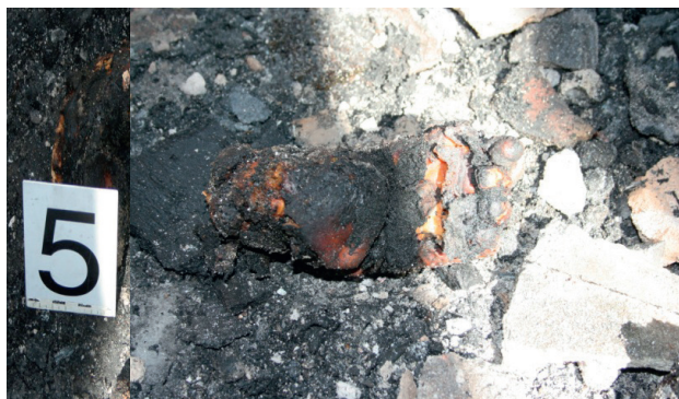
Ryc. 13. Fragment nadpalonej stopy ludzkiej. Fragment nadpalonej stopy ludzkiej, z kawałkiem ciała zawierającego tkankę kostną, mięśniową oraz część skóry

Fig. 13. Fragment of a partially burnt human foot.