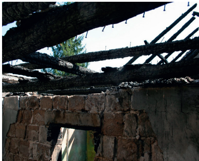
Ryc. 4. Widok belek konstrukcyjnych w prawie doszczętnie spalonym pokoju, w którym później znaleziono szczątki ofiary zdarzenia

Fig. 4. Scene of construction beams in an almost completely burnt room, in which the remains of a victim were later found