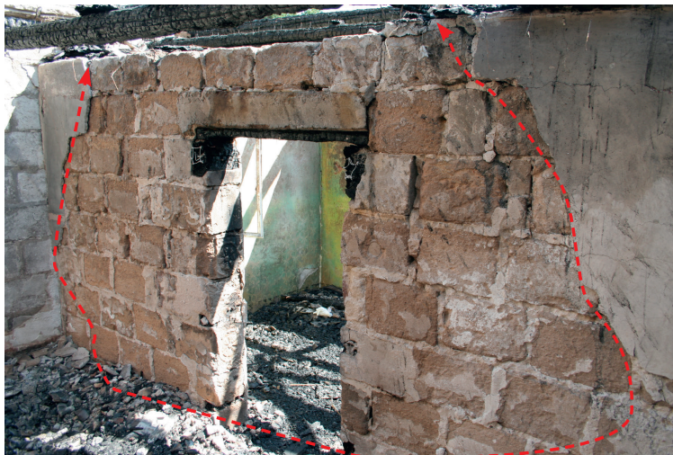
Ryc. 5. Widok ubytków tynku na ścianie pokoju (zaznaczono tak zwany: „śląd stożka pożarowego”)

tw. stożka pożarowego (ryc. 5). Ślad ten obejmował około 70% powierzchni pomieszczenia, dzięki czemu i zaobserwowanym tam zmianom określono w tym miejscu wystąpienie najwyższej temperatury.