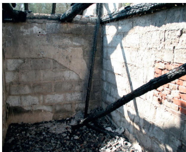
Ryc. 6. Wnętrze spalonego pokoju, w którym znaleziono szczątki zwłok ludzkich

wydzielała słabą woń przypominającą zapach substancji ropopochodnej. Fakt ten zdecydował o pobraniu fragmentu tejże płyty i zabezpieczeniu próbek do dalszych badań laboratoryjnych (ryc. 9). Na posadzce przy łóżku, pod: gruzem, pozostałościami po stropie i dachu (ryc. 6) – znaleziono zwęglone szczątki ludzkie (części ciała, pojedyncze tkanki), reszki odzieży, obuwia, ślady substancji łatwopalnej (na szkicu zaznaczone czerwonym obrysem, z jasnoczerwonym tłem; ryc. 7) oraz leżącą w ich obrębie – nadpaloną matę słomianą (ryc. 8).