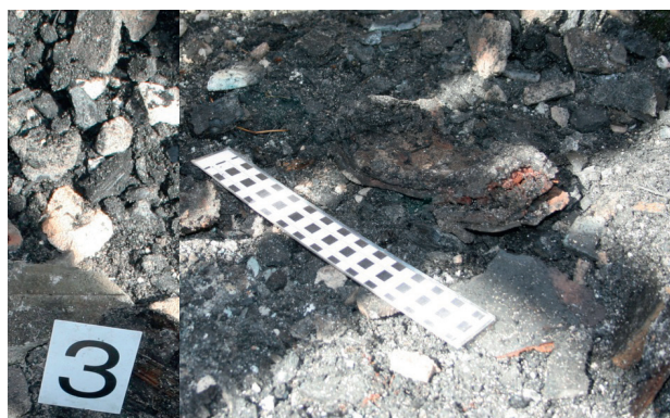
Ryc. 11. Fragment nadpalonego buta

Fig. 11. Fragment of a partially burnt shoe