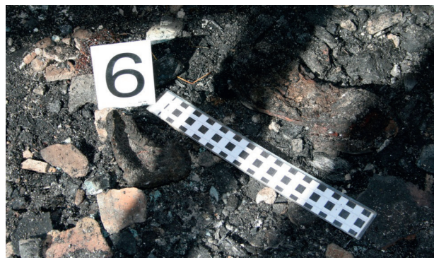
Ryc. 14. Fragment (wielkości dłoni) nadpalonej skóry z głowy ludzkiej pokrytej włosami

Fig. 14. Palm sized fragment of partially burnt skin from a human head, covered with hair