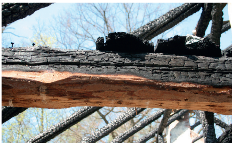
Ryc. 2. Widok sposobu nadpalenia belki w przedpokoju budynku, w którym podłożono ogień

do podpalenia. Podczas tych oględzin ustalono, iż belki konstrukcyjne uległy nadpaleniu od strony strychu (ryc. 2).