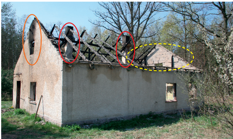
Ryc. 1. Widok domu i jego usytuowania w terenie, wraz z oznaczeniem pomarańczowym owalem okna – wydostawania się dymu, czerwonym – nieczynne przewody kominowe oraz zaznaczeniem żółtą obwódką miejsca po pokoju, w którym znaleziono szczątki zwłok ludzkich

nim runęły do wnętrza obiektu. Natomiast w ocalałych a murowanych elementach tego domu – były jedynie widoczne puste otwory po oknach i pojedynczy w ścianie szczytowej – stanowiący otwór po drzwiach wejściowych (ryc. 1).