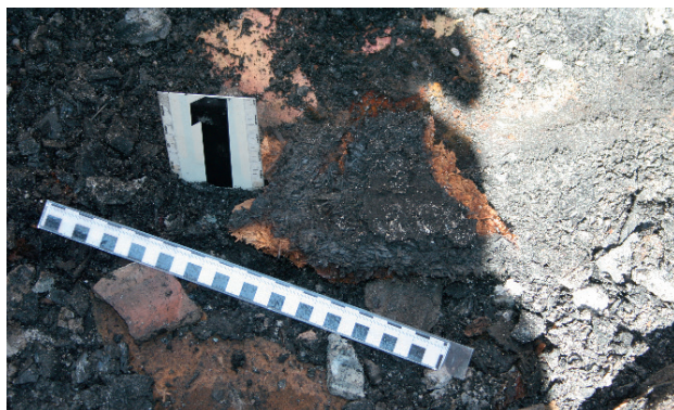
Ryc. 9. Fragment płyty paździerzowej pochodzącej z krawędzi łózka

Fig. 9. Chipboard fragment from the edge of a bed