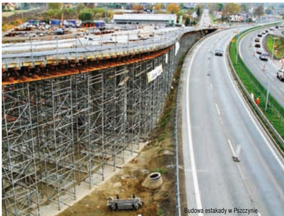
Budowa estakady w Pszczynie

Ostatnie półtora roku było dla przemysłu budowlanego i firm działających w jego otoczeniu bardzo niekorzystne. Spadki produkcji budowlano-montażowej w połączeniu z ujemnymi wynikami mocno przerzedziły konkurencję na rynku. Wiele firm zbankrutowało lub zostało zmuszonych do restrukturyzacji, co w szeregu przypadkach łączyło się ze zwolnieniem części załogi. Najnowsze dane wskazują jednak na nadchodzącą fazę stabilizacji na rynku z perspektywami na większe ożywienie w 2015 r.