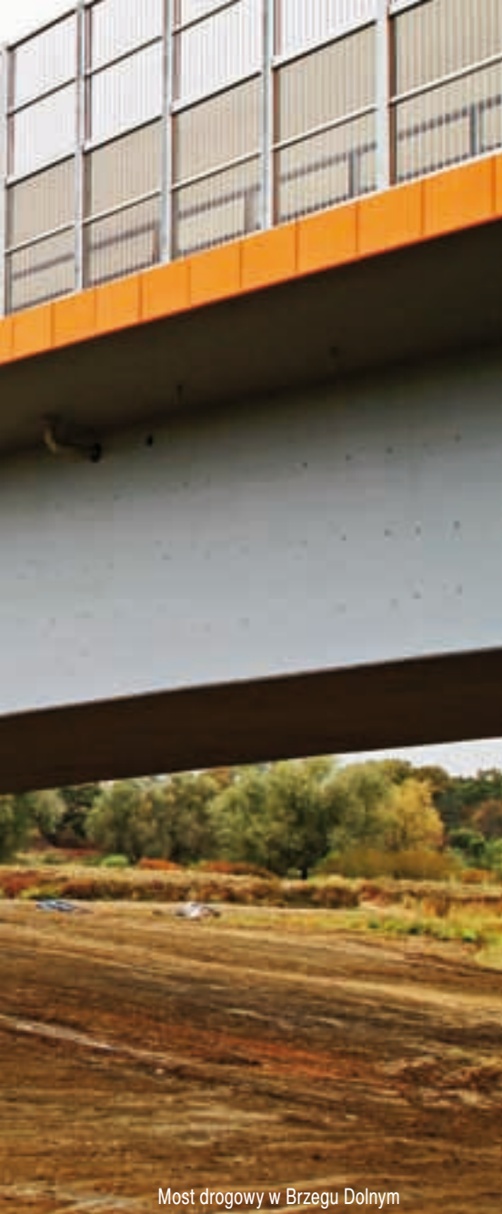
Most drogowy w Brzegu Dolnym