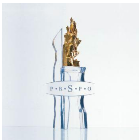
Rys. 5. Statuetka Słoweńskiej Nagrody Jakości

W ostatnim etapie, kandydatury rozpatruje Słoweński Komitet ds. Jakości, w skład którego wchodzi najwyższe jednostki decyzyjne w kraju: minister gospodarki, minister nauki i szkolnictwa wyższego, minister administracji i cyfryzacji, przewodniczący Słoweńskiej Izby Rzemieślniczej, przedstawiciel Słoweńskiej Izby Gospodarczej, przedstawiciel Związków Zawodowych, dwóch dyrektorów przedsiębiorstw i dwóch dyrektorów firm z sektora publicznego. Słoweński Komitet ds. Jakości decyduje o przyznaniu nagrody. Firma, która otrzymała nagrodę w konkursie otrzymuje statuetkę pokazaną na rysunku 5.