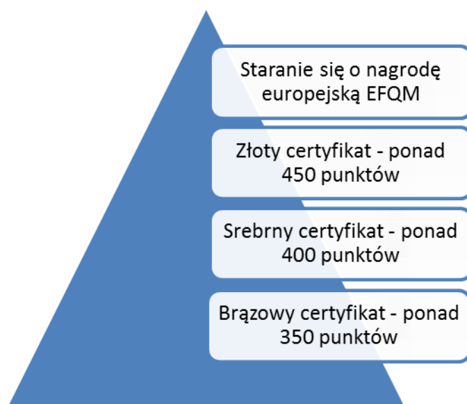
Rys. 2. Poziomy certyfikatów w słoweńskiej nagrodzie jakości

Zasady te zostały syntetycznie przedstawione na rysunku 2. Uzyskanie brązowego certyfikatu jest swoistą zachętą dla organizacji w zakresie poprawy swego poziomu doskonałości i dążenia do poprawy poziomu jakości systemu zarządzania. Zwiększając liczbę punktów w kierunku uzyskania złotego certyfikatu, organizacja może w przyszłości starać się o uzyskanie wyróżnień lub nagród w konkursie europejskim EFQM.