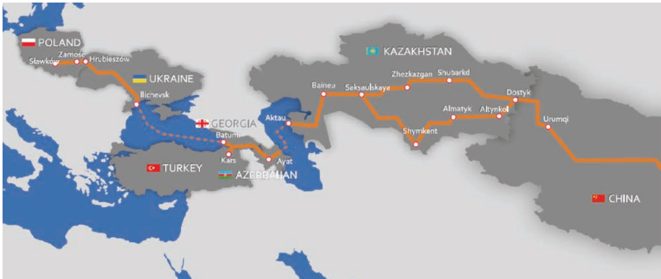
Rys. 3. Korytarz TMTM [9]