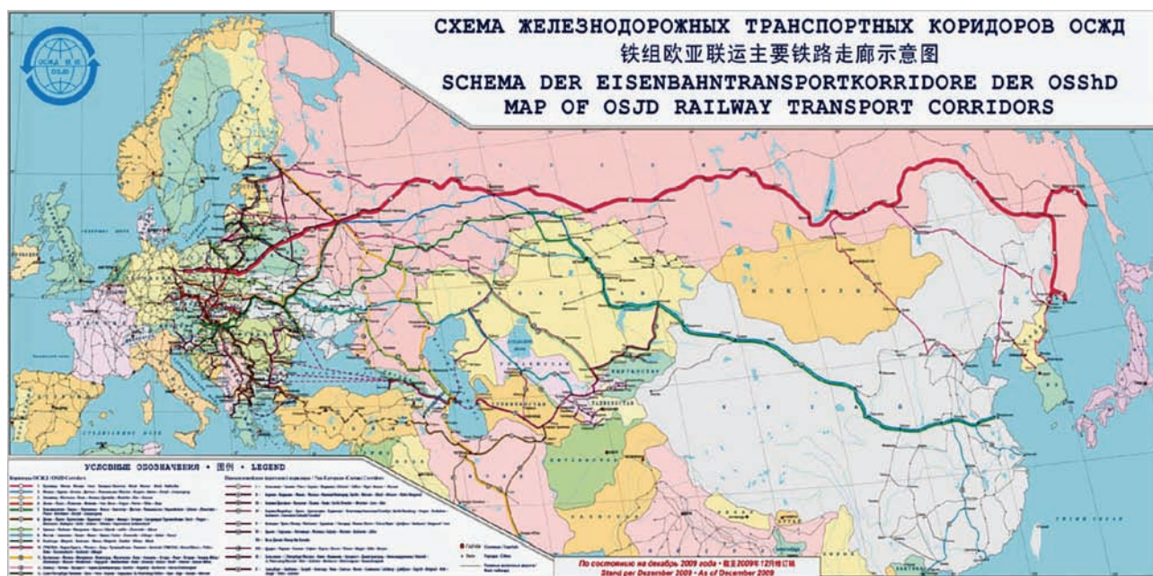
Rys. 2. Korytarze transportowe OSŻD [7]

Zainteresowane kraje podpisały Memorandum 8 w sprawie współpracy i rozwoju korytarzy. Stało się ono podstawą do skoordynowanych działań państw w zakresie reorganizacji i modernizacji odpowiednich