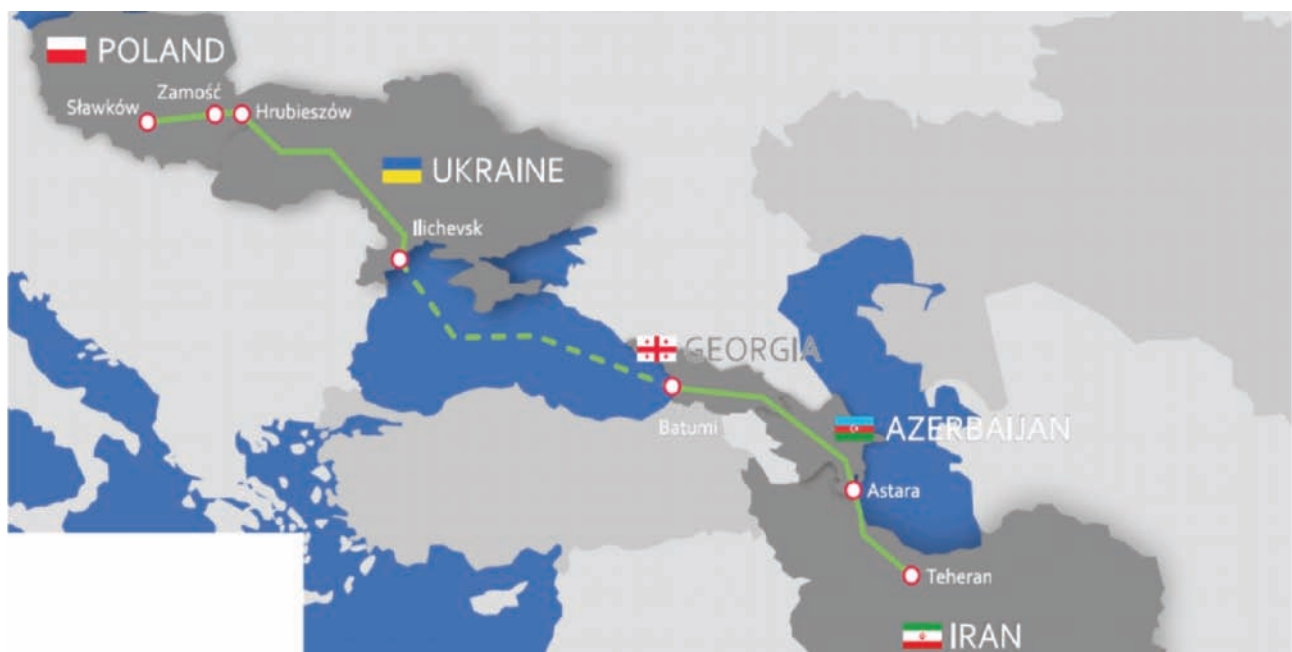
Rys. 4. Korytarz z Iranu [9]

Wymiana handlowa pomiędzy Wschodem i Zachodem jest jednym z głównych czynników determinujących rozwój przewozów towarowych także z wykorzystaniem transportu kolejowego [10]. Według danych Eurostat, wartość dwustronnej wymiany handlowej w 2019 r. wyniosła 644,4 mld euro. Chiński eksport do Unii w 2019 r. był wart 419,2 mld euro i był wyższy o 6,1% niż w 2018 r., natomiast wartość importu z krajów UE do Chin wyniosła 225,5 mld euro, co stanowiło wzrost o 6,6% RdR. Spośród członków UE jedynie trzy kraje: Finlandia, Irlandia i Niemcy odnotowały nadwyżkę w wymianie towarowej z Chinami, natomiast obroty towarowe Polski z Chinami w 2019 r. osią-