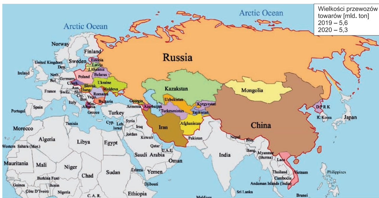
Rys. 6. Wielkości przewozu towarów w krajach OSŻD [8]