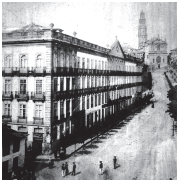
Ryc. 6. Widok na pałac i pasaż das Cardosas od strony wschodniej w 1880 roku Fig. 6. View of the palace and passage das Cardosas from the east in 1880