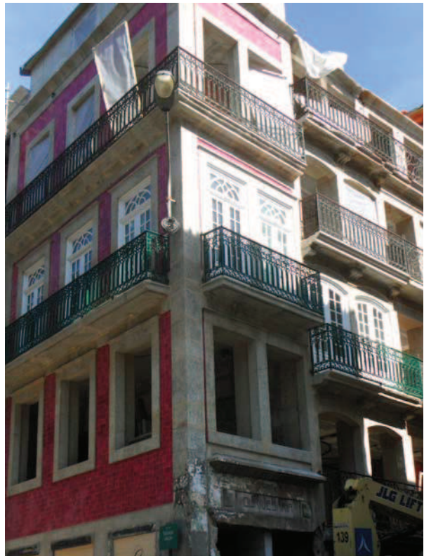
Fig. 17, 18. Tenement houses constituting the quarter das Cardosas during conservation work, photo D. Kuśnierz-Krupa, 09.2012