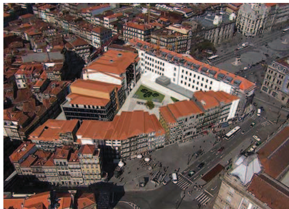
Ryc. 10. Widok z lotu ptaka na zrewaloryzowany kwartał das Cardosas [w:] materiały Urzędu Miasta Porto, jedn. Porto Vivo SRU

Fig. 12. Fragment of architectonic detail, discovered during archeological work in the quarter Cardosas [in:] materials of the City of Porto Office, Porto Vivo SRU