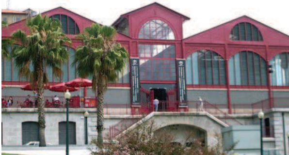
Ryc. 3. Widok na adaptację Mercado Ferreira Borges, gdzie obecnie znajduje się centrum kulturalno-wystawowe, fot. D. Kuśnierz-Krupa, 09.2012 Fig. 3. View of the adaptation of Mercado Ferreira Borges, which currently house the cultural-exhibition centre, photo D. Kuśnierz-Krupa, 09.2012