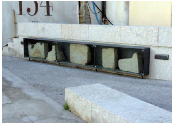
Ryc. 16. Widok współczesną ekspozycję zabytkowych detali architektonicznych odnalezionych podczas prac archeologicznych na terenie kwartału, fot. D. Kuśnierz-Krupa, 09.2012