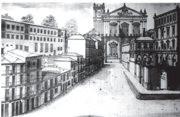
Ryc. 8. Widok placu i na drugim planie klasztoru S. Bento w latach 80. XVIII wieku

Fig. 7. An archive postcard. View of the street Rua das Flores from the north at the turn of the 19 th and 20 th