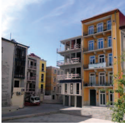
Ryc. 13, 14. Widok na wnętrze kwartału das Cardosas podczas interwencji konserwatorskiej, fot. D. Kuśnierz-Krupa, 09.2012