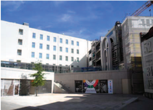
Ryc. 15. Widok na wnętrze kwartału das Cardosas podczas interwencji konserwatorskiej, fot. D. Kuśnierz-Krupa, 09.2012