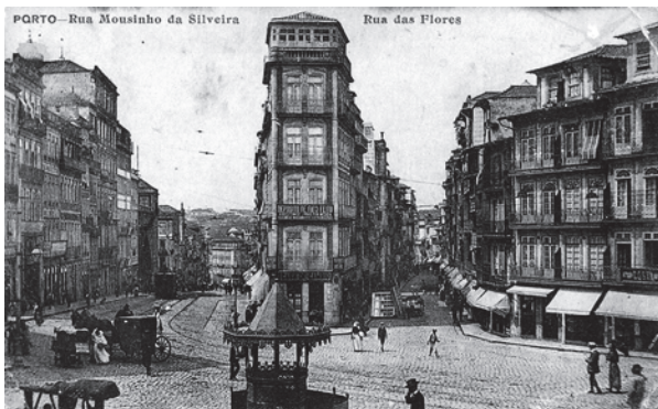
Ryc. 7. Archiwalna pocztówka. Widok na ulicę Rua das Flores od strony północnej na przełomie XIX i XX wieku

Fig. 7. An archive postcard. View of the street Rua das Flores from the north at the turn of the 19 th and 20 th