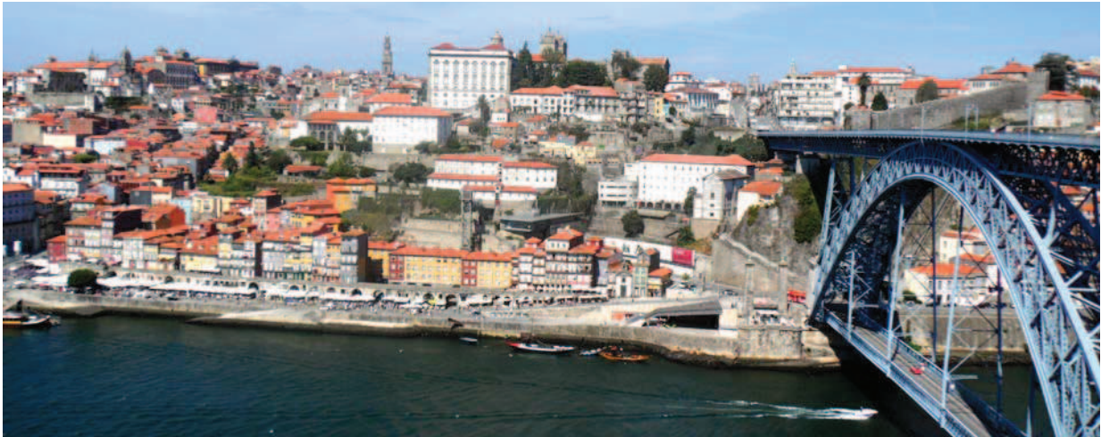
Ryc. 1. Widok na najstarszą część Porto, położoną na prawym brzegu rzeki Douro, fot. D. Kuśnierz-Krupa, 09.2012 Fig. 1. View of the oldest part of Porto, located on the right bank of the river Douro, photo D. Kuśnierz-Krupa, 09.2012