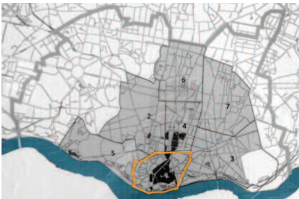
Ryc. 2. Mapa Porto. Zaznaczono historyczne centrum, w którym położony jest kwartał das Cascosas [w:] materiały Porto ViVO SRU Fig. 2. Map of Porto. Marked historic centre where the quarter das Cascosas is located [in:] materials Porto ViVO SRU