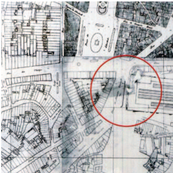
Ryc. 9. Fragment planu Porto z początku XX wieku, na planie zaznaczono dawną lokalizację klasztoru S. Bento [w:] Muzeum Historii Porto, s.v.

Fig. 8. View of the square with S. Bento monastery in the background, during the 1780s [in:] Museum of History of Porto, s.v.