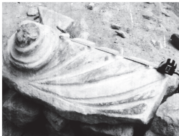
Fig. 11. Archaeological excavations in the quarter Cardosas