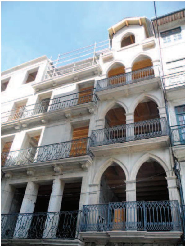
Ryc. 17, 18. Kamienice tworzące kwartał das Cardosas podczas prac konserwatorskich, 09.2012