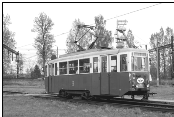
Fot. 2. Zabytkowy tramwaj na tle kopalni węgla kamiennego w Kazimierzu. Przejazd specjalny wagonem typu 4N, jaki odbył się w 50. rocznicę budowy tej linii tramwajowej.

Photo 1. Tram line 27 of the anthropogenic reservoir between Porąbka and Kazimierz.