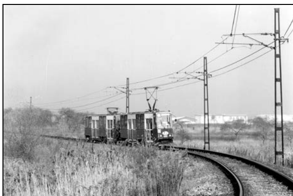
Fot. 1. Tramwaj linii 27 nad zbiornikiem antropogenicznym pomiędzy Porąbką a Kazimierzem.

Szczególnie ciekawym fragmentem trasy jest odcinek od Klimontowa do Kazimierza. W trakcie przejazdu, oprócz zlikwidowanej już kopalni, mija się to co jest charakterystyczne dla tych terenów i jednocześnie odmienne od klasycznego miejskiego krajobrazu: zapadliska powstałe wskutek działalności górniczej, antropogeniczny zbiornik wodny czy wreszcie nieużytki, będące niegdyś polami uprawnymi (fot. 1). Sama pętla tramwajowa również zlokalizowana jest nie wewnątrz dzielnicy mieszkaniowej, przy nadal czynnej, ostatniej kopalni węgla kamiennego w Zagłębiu (fot. 2). Intensywne procesy urbanizacyjne sprawiły, że w skali kraju niewiele jest tras tramwajowych gdzie na większą skalę w granicach miast występują krajobrazy charakterystycznych dla obszarów wiejskich, zwłaszcza w połączeniu z krajobrazami przemysłowymi. Trasa linii tramwajowej nr 27 na odcinku od Sosnowca do Kazimierza jest swoistym przekrojem przez mozaikę wszystkich typów krajobrazu kulturowego spotkanego na obszarze konurbacji katowickiej – od pozostałości terenów o użytkowaniu rolniczych i podmiejskich terenów otwartych, aż do krajobrazów zurbanizowanych, industrialnych i postindustrialnych (por. Myga-Piątek, 2008).