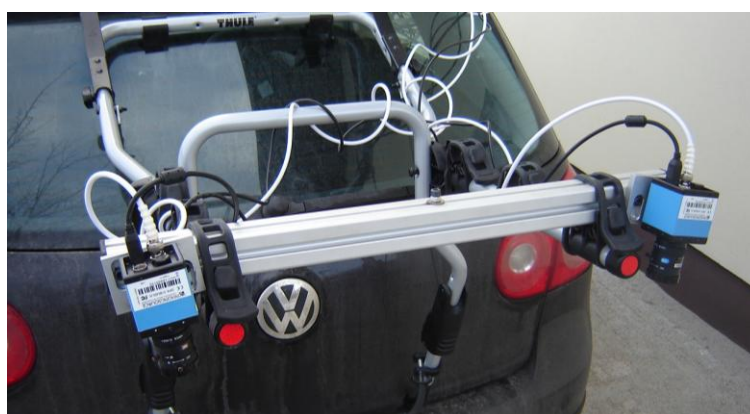
Rys. 3. Stereowizyjne stanowisko pomiarowe Fig. 3. Stereovision test bench

Na rysunku 3 przedstawiono system stereowizyjny zamontowany na pojeździe do rejestracji stanu sieci drogowej. Stanowisko pomiarowe zostało opracowane i wykonane przez autora tej pracy.