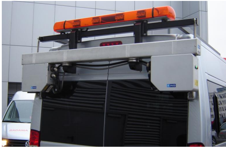
Rys. 1. Pojazd pomiarowy z rejestratorem wizyjnym stanu nawierzchni Fig. 1. Vehicle with video recorder to register road pavement conditions

Pojazd laboratorium z zastosowaną aparaturą do automatycznej wizyjnej oceny stanu nawierzchni przedstawia rys. 1.