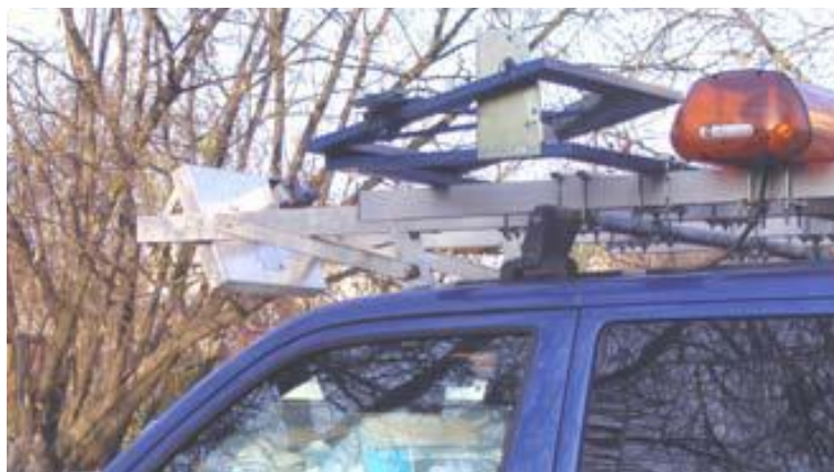
Rys. 2. Rejestrator SOWA3 Fig. 2. SOWA3 device

Pojazd laboratorium drogowego GDDKiA z aparaturą SOWA3 przedstawia rys. 2.