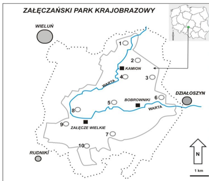
Rys.1. Załęczański Park Krajobrazowy wraz z otuliną; stanowiska badawcze: 1–10 (opracowanie autorskie)