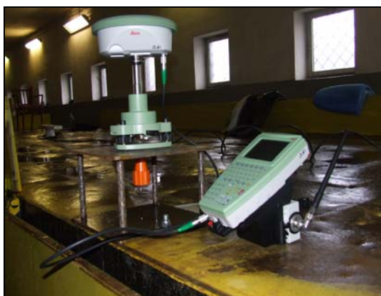
Rys. 1. Zestaw pomiarowy: SmartAnten typu ATX1230GG oraz kontrolera RX 1250

Projekt zakładał symetryczne rozmieszczenie czterech zestawów pomiarowych GNSS na platformie kolejowej. Na zestaw składał się odbiornik Leica System 1200 SmartRover, złożony ze SmartAnten typu ATX1230GG oraz kontrolera RX 1250 (rys. 1).