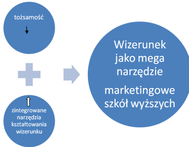
Rysunek 3. Wizerunek - mega narzędzie marketingowe szkoły wyższej.

Kształt tego zintegrowania przedstawia rysunek 3.