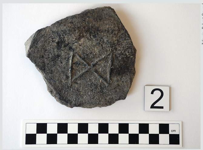
Fot. 2. Fragment oznaczony symbolem O-2

jest wygładzona, delikatnie szorstka, z wyczuwalnymi drobinami piaskowej domieszki schudzającej i czytelnymi śladami toczenia w postaci koncentrycznych smug. Przełom jest ciemnoszary, niejednorodny, z punktowymi niemal czarnymi przebarwieniami. Do schudzenia gliny użyto piasku, tłucznia ceramicznego i prawdopodobnie marglu. Naczynie wykonane zostało z zastosowaniem techniki taśmowo-ślizgowej na kole garncarskim, któremu nadano dużą rotację. Posadowione na kole garncarskim najpewniej na podkładce 8 z wrytym motywem klepsydry. Wypał był pełny i równomierny, przeprowadzony w atmosferze redukcyjnej. Fragment wykazuje ślady okopcenia powstałego zapewne w trakcie użytkowania naczynia bądź w wyniku kontaktu z ogniem w następstwie pożaru. Po stronie wewnętrznej zachował się punktowy ślad przywaru, najprawdopodobniej pochodzenia organicznego.