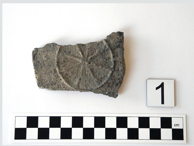
Fot. 1. Fragment oznaczony symbolem O-1