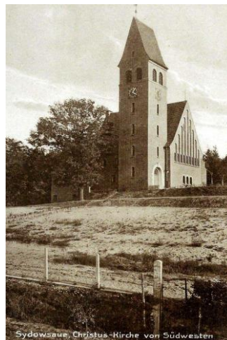
Fig. 18 Church in Żydowce (Sydowsaue)

Ryc. 17 Kościół w Podjuchach (Podejuch) – widok od wschodu