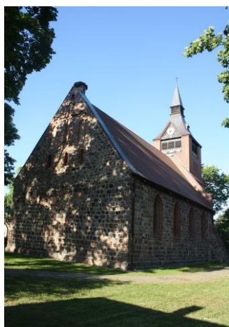
Fig. 7 Church in Wołczkowo (Volschendorf) – view from the north-east; photo M. Płotkowiak

Ryc. 6 Ruina kościoła w Karwowie (Karow) – szczegół ściany południowej z ostrołukowym portalem; fot. M. Płotkowiak