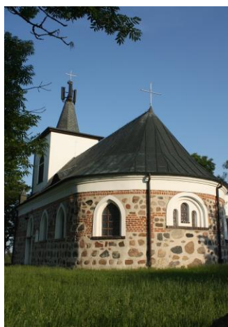
Fig. 9 Church in Stobno (Stöwen) – view from the north-east

Ryc. 8 Kościół w Wołczkowie (Volschendorf) – wystrój plastyczny szczytu wschodniego