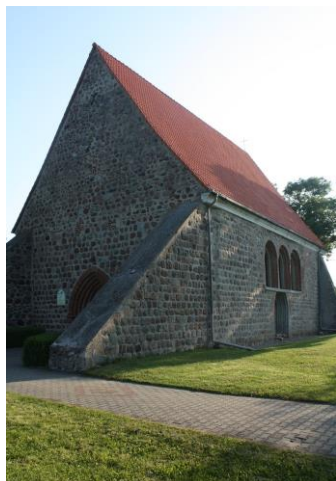
Fig. 4 Church in Będargowo (Mandelkow) – view from the south-west

the form of a ruin, the church in Karwow and the church in Wołczkowo were indoor buildings. The latter shows a certain resemblance to the solutions used in the church in Mierzyn with a triad of lanceolate windows in the eastern façade preserved in the form of legible relics and a blend in the form of a cross within the crowning top (fig. 8).