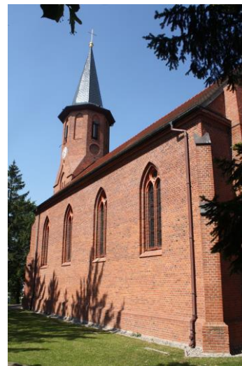
Fig. 15 Church in Warszewo (Warsow) – view from the south-east; photo M. Płotkowiak

Ryc. 14 Kościół w Warszewie (Warsow) – widok od południowego zachodu; fot. M. Płotkowiak