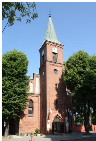
Fig. 17 Church in Podjuchy (Podejuch) – view from the east

Ryc. 16 Kościół w Zdrojach (Finkenwalde) – widok od południowego wschodu