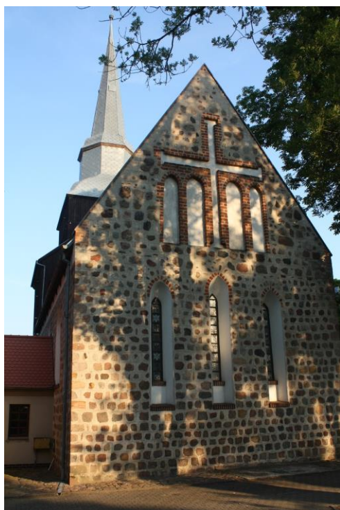
Fig. 2 Church in Mierzyn (Möringen) – view of the eastern gable wall; photo M.Plotkowiak

Ryc.2 Kościół w Mierzynie (Möringen) – widok wschodniej ściany szczytowej; fot.M.Plotkowiak