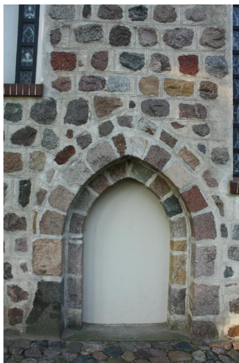
Fig. 3 Church in Mierzyn (Möringen) – ogival portal in the north wall

Ryc.2 Kościół w Mierzynie (Möringen) – widok wschodniej ściany szczytowej