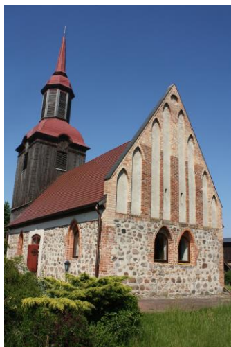
Fig. 10 Church in Przęsocin (Neuendorf) – view from the south-east; photo M. Płotkowiak Ryc. 10 Kościół w Przęsocinie (Neuendorf) – widok z południowego wschodu; fot. M. Płotkowiak