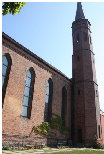
Fig. 13 Church in Golęcino (Frauendorf) – detail of the south elevation with the tower

An example of a strict artistic concept is the church in Golęcino (fig 12,13). It was given the form of a long, aisle with a separate, polygonal presbytery on the eastern side and a small vestibule adjacent to the western gable wall. The façade decoration was limited to rhythmically arranged, lancet window openings, a profile crowning the above-ground part of the foundation walls forming a kind of massive pedestal and a Romanesque arcaded frieze placed under the cornice top. In the context of the form given to other churches created in this period, which were equipped without exception in the tower on the axis of symmetry of the front gable wall - the unique location has an octagonal tower that adjoins the south elevation in the region of the south-east corner.