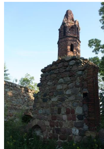
Fig. 6 Ruin of the church in Karwowo (Karow) – detail of the south wall with ogival portal

Ryc. 5 Ruina kościoła w Karwowie (Karow) – widok z południowego wschodu