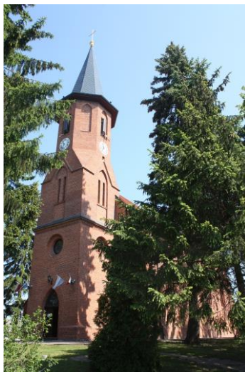
Fig. 14 Church in Warszewo (Warsow) – view from the south-west; photo M. Płotkowiak

Ryc. 13 Kościół w Golęcinie (Frauendorf) – fragment elewacji południowej z wieżą; fot. M. Płotkowiak