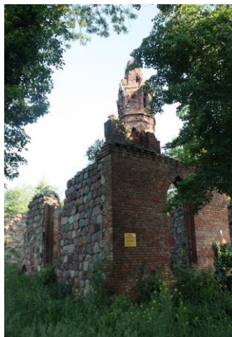
Fig. 5 Ruin of the church in Karwowo (Karow) – view from the south-east

Ryc. 4 Kościół w Będargowie (Mandelkow) – widok z południowego zachodu