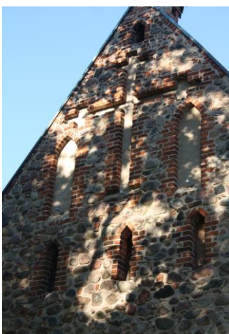
Fig. 8 Church in Wołczkowo (Volschendorf) – decoration of east gable wall

Ryc. 7 Kościół w Wołczkowie (Volschendorf) – widok z północnego wschodu