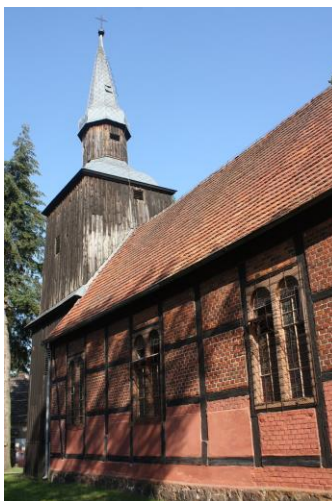
Fig. 11 Church in Płonia Bukowo (Buchholz) – view from the south-east; photo M. Płotkowiak Ryc. 11 Kościół w Płoni-Bukowie (Buchholz) – widok z południowego wschodu; fot. M. Płotkowiak