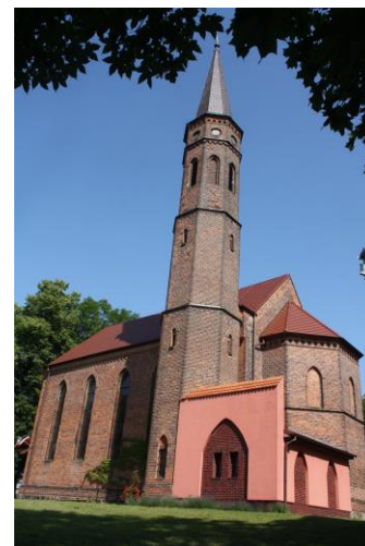
Fig. 12 Church in Gołęcino (Frauendorf) – view from the south-east Ryc. 12 Kościół w Gołęcinie (Frauendorf) – widok z południowego wschodu

An example of a slightly more advanced solution preserved to a degree that allows a more detailed description of its form is the church in Przęsocin ( fig.10), which was built with a nave on the set on a rectangular plan of 7,36x13,85m. The curtains of its walls were erected from relatively small pieces of stone, between which individual larger fragments of bricks were placed, and more often their slabs, with external corners shaped exclusively of brick. Bricks and lintels of lancet windows were also made of bricks, of which two were arranged in the side elevations and their pair on the symmetry axis of the eastern wall. Attention is drawn to the peculiar form of window openings, whose lancet external slides were intersected by the inner lintel in the form of a segmental arch or basket arch. The church also received a brick gable in a pillar-blend construction with four blend pairs flanking the pillar on the axis of the symmetry of the wall.