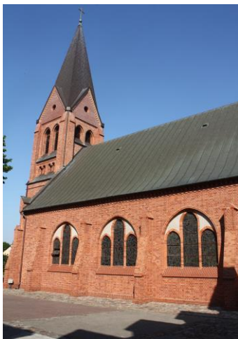
Fig. 16 Church in Zdroje (Finkenwalde) – view from the south-east; photo M. Płotkowiak

Surely, as the youngest of the village churches who found itself in the area of Great Szczecin, the church in Żydowce (fig. 18) was established in 1929. Although the building was erected at a time when the Jews wore more features of the urban district than the village settlements, its functional and spatial form as well as artistic stylistics justified the classification to a group of rural churches.