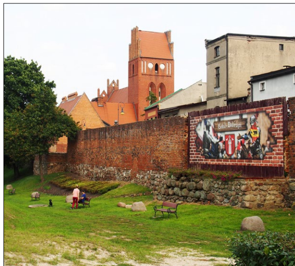
Ryc. 9. Północny ciąg średniowiecznych murów miejskich od strony ul. gen. J. Hallera poprzedzony dawną fosą, 2020

Odnowiona historyczna starówka z rynkiem, odpowiednio wyeksponowane mury miejskie i zagospodarowane bulwary nad rzeką to kluczowe realizacje, dzięki którym Golub-Dobrzyń zyska na atrakcyjności zarówno dla mieszkańców, jak i dla odwiedzających. Kolejną otwierającą się perspektywą jest połączenie miasta z zamkiem, zarówno w sensie dosłownym, jak i ideowym. Miasto i zamek powinny być połączone wygodną i dobrze oznakowaną trasą pieszą. Na zamku, gdzie przebywają biorący udział w turniejach pasjonaci, zasadne byłoby umieszczenie wizualnych odwołań do historycznego centrum, zwracających uwagę na jego walory, zabytki i atrakcje. Należy również zadbać o upamiętnienie okresu nowożytnej świetności Golubia pod rządami Anny Wazówny. Jednym