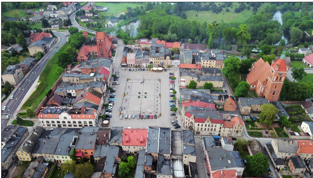
Ryc. 7. Starówka, 2021; fot. E. Sroczyńska, J. Kulasa.