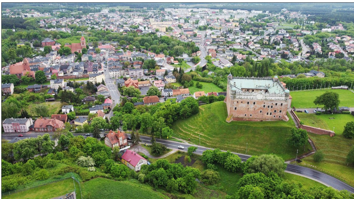
Ryc. 6. Widok na zamek i na miasto, 2021; fot. E. Sroczyńska, J. Kulasa.