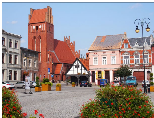
Ryc. 3. Rynek z widocznym domem „Pod Kapturem” i dawnym kościołem ewangelickim (obecnie siedziba Szkoły Podstawowej nr 1 im. Konstytucji 3 Maja), 2020; fot. J.J. Białkiewicz.

Drugą obok średniowiecznego starego miasta dominantą architektoniczną Golubia-Dobrzynia jest zamek, wzniesiony na wyniosłej skarpie po północnej stronie doliny Drwęcą [Dzieje Golubia-Dobrzynia 1979, s. 184–185; Zobolewicz 2000, s. 18–19; Katalog zabytków 1973, s. 19–25; Guerquin 1974, s. 139; Wiśniewski 2019, s. 6; Wasik 2019, s. 191–217; Wasik 2015, s. 23]. Gotycką warownię założoną na planie zbliżonym do kwadratu z czterema skrzydłami wokół wewnętrznego dziedzińca zbudowano z inicjaty-