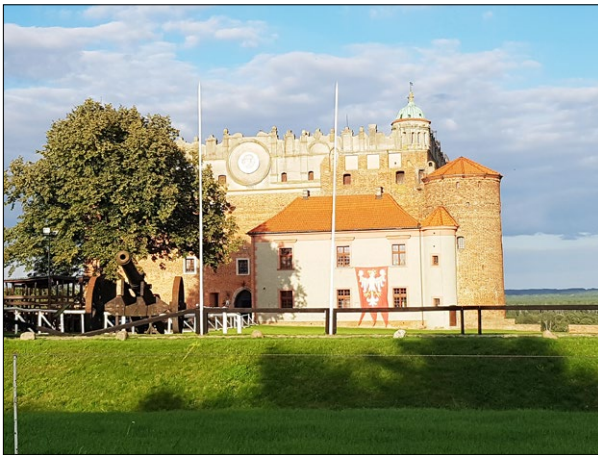
Ryc. 5. Zamek, 2020; fot. J.J. Białkiewicz.