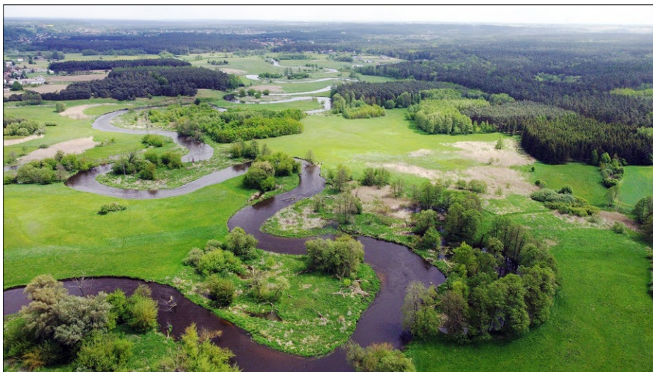
Ryc. 10. Dolina Drwęcy, 2021