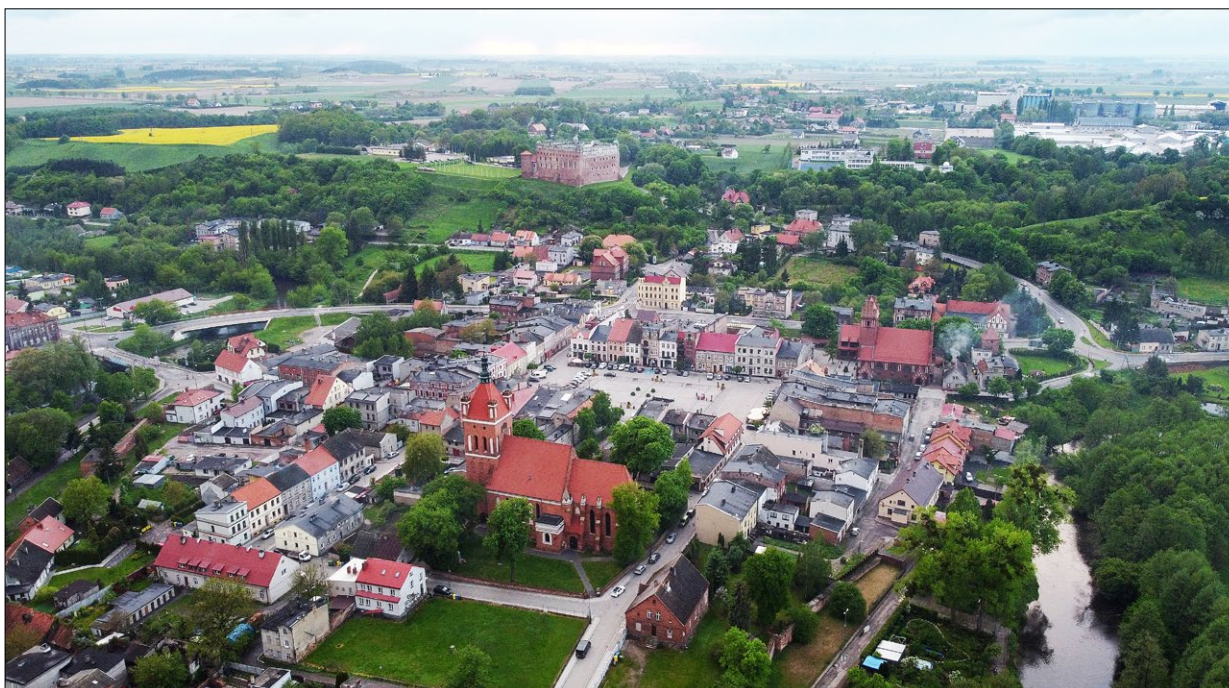
Ryc. 4. Starówka z kościołem św. Katarzyny, w tle zamek, 2021; fot. E. Sroczyńska, J. Kulasa.