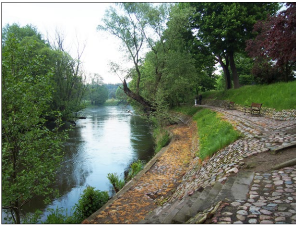
Ryc. 8. Nabrzeże Drwęcy w bezpośrednim sąsiedztwie starówki, 2021; fot. J.J. Białkiewicz.