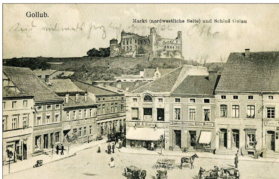
Ryc. 2. Rynek i zamek w Golubiu, początek XX w., ze zbiorów portalu Poloniae Amici – „Polska na fotografii”; źródło: polska-org.pl.