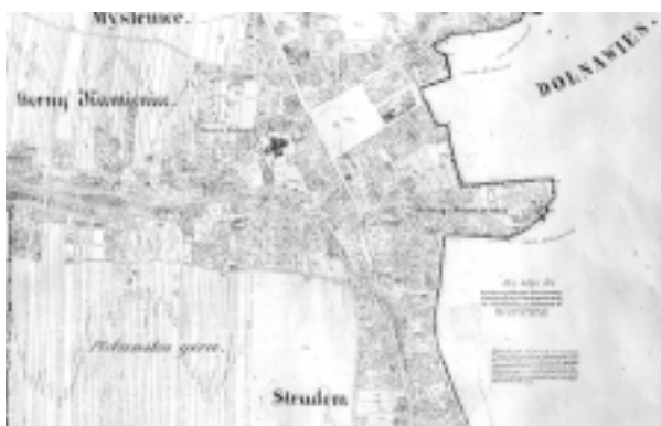
Myślenice. Fragment planu katastralnego miasta z połowy XIX wieku. Oryginał w zbiorach Powiatowego Ośrodka Dokumentacji Geodezyjnej i Kartograficznej w Myślenicach

Miasto otrzymało prosty układ urbanistyczny będący odmianą typu dziewięciopoleowego. Skła- dał się on z 9 umiarowych bloków. Największy