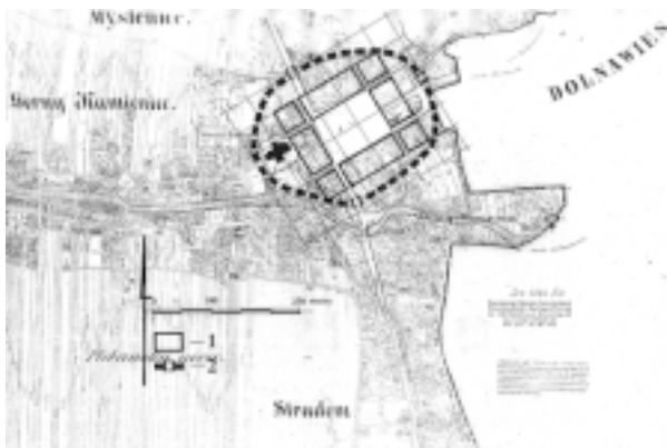
Myślenice. Analiza metrologiczna układu miasta lokacyjnego. Oprac. Autora. Legenda: 1 – bloki zabudowy mieszkalnej, 2 – hipotetyczny przebieg narysu umocnień miasta