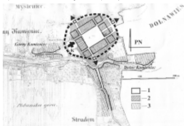
Myślenice. Rekonstrukcja układu przestrzennego miasta z końca XV wieku i początków wieku XVI. Oprac. Autora. Legenda: 1 – bloki lokacyjne, 2 – obszar miasta lokacyjnego zasiedlony w granicach jego umocnień obronnych, 3 – przedmieścia, K – kościół farny