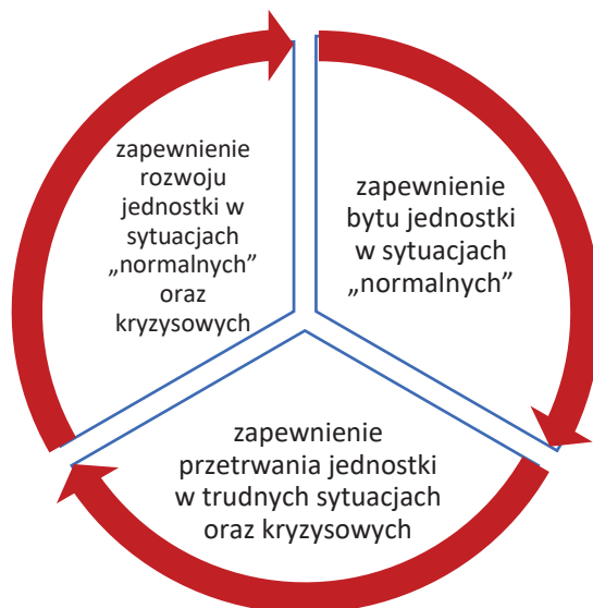
Rys. 1. Triada zadań bezpieczeństwa

Bezpieczeństwo to druga z najważniejszych potrzeb egzystencjonalnych człowieka, zaraz po potrzebach fizjologicznych [1, s. 13]. Jego zapewnienie jest jednym z nadrzędnych zadań każdego państwa. Pojęcie bezpieczeństwa jest różnie interpretowane, ale zawsze wspólnym mianownikiem pozostaje zapewnienie swobody rozwoju, ochrona wspólnych dóbr, życia osobistego jednostki, prawa człowieka oraz przynależność narodowa. Aby zrozumieć istotę bezpieczeństwa, często zadawane jest pytanie: do czego ono tak naprawdę służy i czym jest? Odpowiedź, na podstawie triady zadań bezpieczeństwa, przedstawiono na rys. 1.