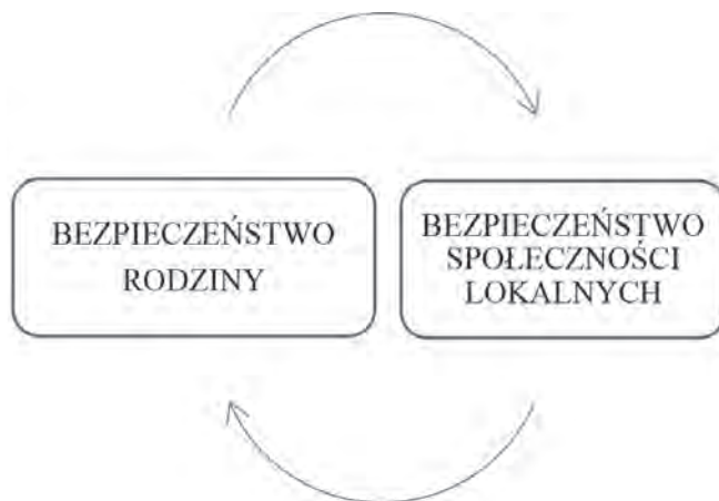
Rys. 3. Zależności bezpieczeństwa rodziny oraz bezpieczeństwa społeczności lokalnej

Zależności bezpieczeństwa rodziny oraz bezpieczeństwa społeczności lokalnych zaprezentowano w formie graficznej (rys. 3).