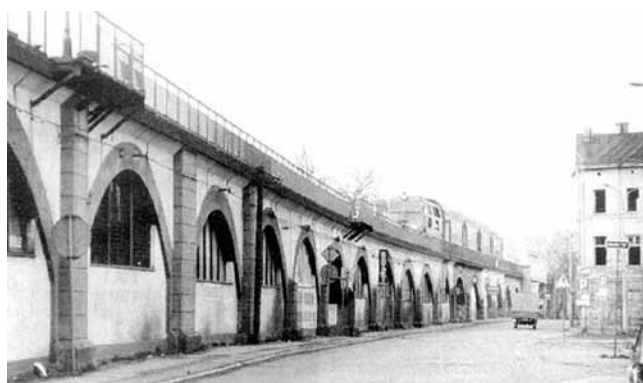
Rys. 1. Estakada w Gorzowie Wielkopolskim – widok ogólny (2001), według [8]

Estakada kolejowa od km 295,591 do km 297,707 linii nr 203 Tczew – Kostrzyn znajduje się na terenach nabrzeżnych rzeki Warty w centrum Gorzowa Wielkopolskiego. Estakada ta była jedną z czterech zrealizowanych przez koleje pruskie na terenach na wschód od Łaby. Pierwsza powstała w Berlinie, kolejna we Wrocławiu, następna w Gorzowie, a ostatnia w Strzegomiu. Wszystkie były zaprojektowane jako nowoczesne konstrukcje z najlepszych dostępnych wówczas materiałów. Główną część estakady w Gorzowie Wielkopolskim wybudowano w latach 1905–1914, w tym konstrukcje części dworcowej w latach 1911–1912. Na estakadzie ułożono dwa tory. Estakada składa się z kilku odcinków murów oporowych, przęseł ceglanych, wiaduktów stalowych, estakady