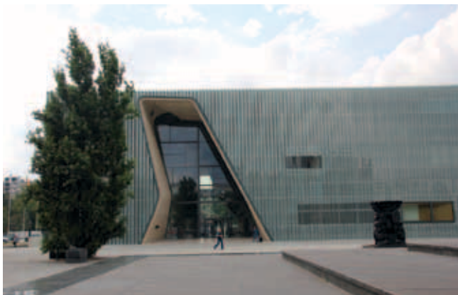
Rys. 5. Muzeum Polin – wejście główne