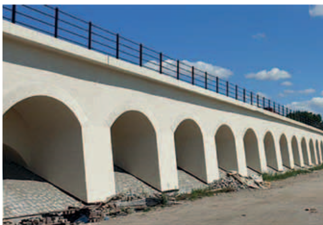
Rys. 4. Naprawiony obiekt w oryginalnym kolorze ecru

podporami. Ściany boczne mają grubość ok. 95–105 cm. Sklepienia ceglane oparto na masywnych podporach betonowych w odstępach co około 8,0 m, grubości 2,2 m i szerokości ok. 9,0 m. Podpory są posadowione bezpośrednio na gruncie. Układ przęsł w planie dostosowany został do krzywizny torowiska.