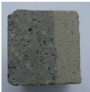
Rys. 8. Proces etapowego nanoszenia betonu natryskowego

barwiony w masie na kolor piaskowożółty (rys. 8). Używano torkretnic ALIVA 246 oraz gotowych suchych mieszanek betonowych przygotowanych wcześniej dla całego obiektu, z zastosowaniem jednolitego składu i barwy.