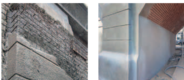
Rys. 3. Fragmenty boniowania przed naprawą i po niej