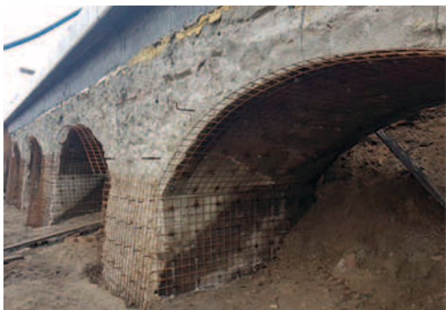
Rys. 2. Fragment estakady po oczyszczeniu z siatkami przeciwskurczowymi