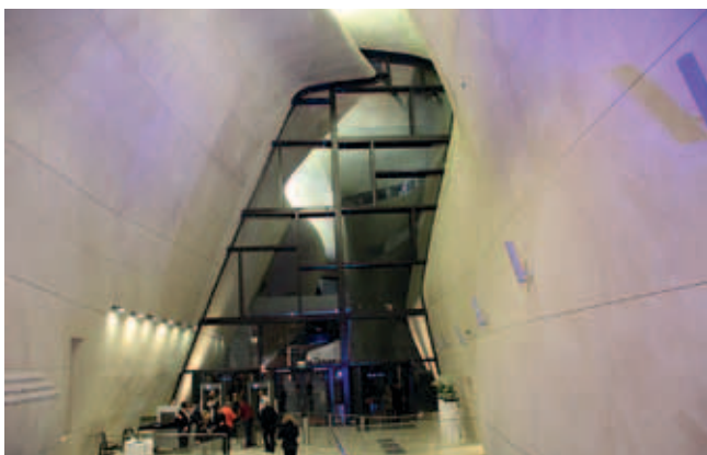
Rys. 6. Widok wnętrza hallu głównego

badaniach w Laboratorium Instytutu Konstrukcji Budowlanych Politechniki Poznańskiej przystąpiono do wykonania ścian referencyjnych na poligonie pod Poznaniem, a następnie przystąpiono do realizacji w Warszawie.