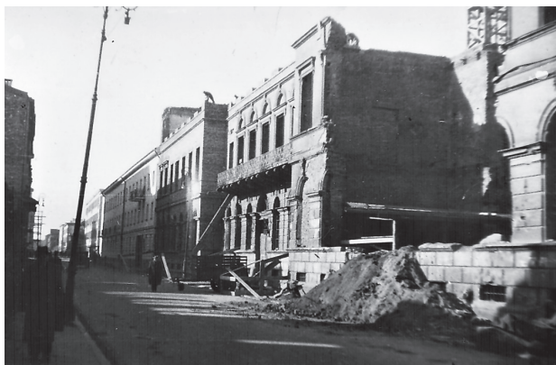
GUM w gruzach

Zaledwie 26 lat od zakończenia I wojny światowej, a także po 6 latach wyniszczającej okupacji, polska metrologia, podobnie jak cały kraj, musiała ponownie podnosić się z gruzów. Od nowa trzeba było tworzyć struktury administracji miar, gromadzić niezbędne wyposażenie i budować nowe zespoły ludzkie, tak w Warszawie, jak i w ośrodkach terenowych. Zanim jednak Główny Urząd Miar znów na stałe ulokował się w stolicy, co nastąpiło dopiero w 1949 r., początkowo struktury centralnej instytucji, stojącej na straży systemu miar, odbudowywano na Śląsku: w Katowicach i Bytomiu, gdzie były dużo lepsze warunki, przede wszystkim w postaci niezburzonych i zagospodarowanych w stopniu podstawowym budynków.