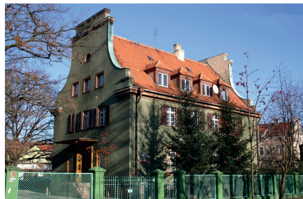
Wydział Zamiejscowy w Legnicy OUM Wrocław

Gorzej było ze sprzętem. Część mienia była wywieziona przez Niemców, jeszcze przed wkroczeniem Armii Czerwonej, a część rabowana przez Rosjan, którzy trak-