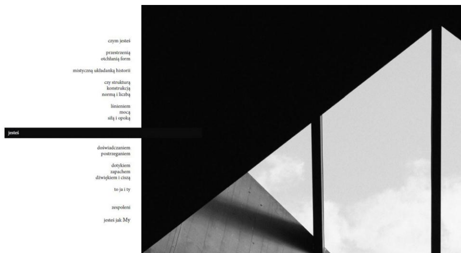
Rys. 1. Peter Zumthor, Pawilon dla rzymskich wykopalisk, Chur, Szwajcaria

Na rys. 1 przedstawiono pawilon dla rzymskich wykopalisk, autorstwa Petera Zumthora, znajdujący się w Chur w Szwajcarii. Graficzne ujęcie mocnej formy architektonicznej obrazuje bezpieczeństwo dla gromadzonych w przestrzeni obiektu artefaktów archeologicznych.