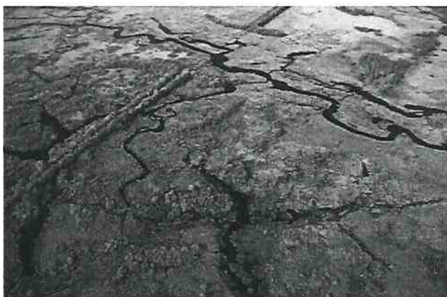
Fotografia 1.2 System rzeczny rzeki Narwa