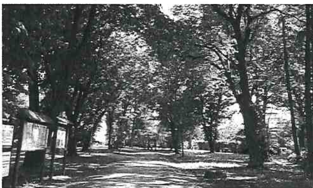
Fotografia 2.2 Przebieg ścieżki edukacyjnej w Parku Przydworskim w Kurowie

w Narwiańskim Parku Narodowym. Wśród tych zbiorowisk znajdują się siedliska poszczególnych organizmów, charakterystycznych dla danego obszaru. Ścieżka ma 1 km długości, na której znajdują się dwie trasy widokowe. Różnorodność Narwiańskiego Parku Narodowego jest zróżnicowana. Jej specyfikacja polega przede wszystkim na tym, że na danym terenie występuje przenikanie się ekosystemów lądowych z wodnymi, co jest spowodowane bogatą siecią koryt rzecznych. Zbiorowiska, które występują w parku są w niewielkim stopniu przekształcone i mają charakter naturalny. Duże zróżnicowanie takich zbiorowisk pozwala na zamieszkanie i funkcjonowanie wielu gatunków w strukturze ekosystemu, co nadaje charakter wysokiej bioróżnorodności dla danego terenu. Na tej trasie edukacyjnej występuje 13 tablic i zlokalizowano następujące przystanki: rzeka, trzciniowisko, turzycowisko, wilgotne łąki, zarośla wierzbowe i ols.