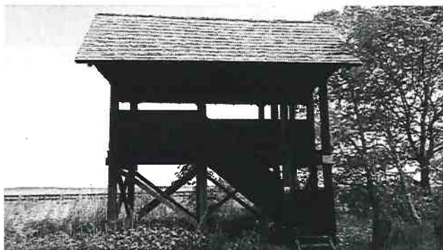
Fotografia 2.4 Punkt widokowy w miejscowości Kurowo

Do turystyki Narwiańskiego Parku Narodowego możemy również zaliczyć znajdujące się w pobliżu szlaków turystycznych wieże i punkty widokowe. Są one w pobliżu miejscowości takich jak: Suraż, Pańki, Kurowo, Waniewo, Łapy, Łapy Szołajdy, Uhowo, Wólka Waniewska, Topilec i Kolonia Topilec. Są one pomocne w trakcie początkowego zwiedzania, jak również mogą posłużyć do odpoczynku i schronienia podczas podróży szlakami turystycznymi.