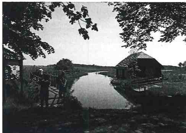
Fotografia 2.1 Kładka wśród bagien-Kurowo

Na obszarze Narwiańskiego Parku Narodowego mają miejsce 3 ścieżki przyrodnicze.