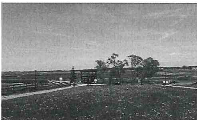
Fotografia 2.3 Fragment Kładki Waniewo-Śliwno

Park Przydworski-Kurowo jest to park zlokalizowany w pobliżu zabytkowego dworku, który pełni siedzibę Dyrekcji parku. Podczas spacerowania na tym obszarze można dowiedzieć się wielu ciekawych cech charakterystycznych dla tego terenu. Przede wszystkim można poznać historię miejsca oraz warunki życia mieszkańców. W parku znajduje się 8 tablic edukacyjnych, z których każda dotyczy konkretnej tematyki. Zawarte informacje na tych tablicach dotyczą między innymi historii dworu w Kurowie, zwiastunów wiosny, gniazd wędrowca (bociana białego), życia pszczół, czy też pozostałych skrzydlatych mieszkańców parku.