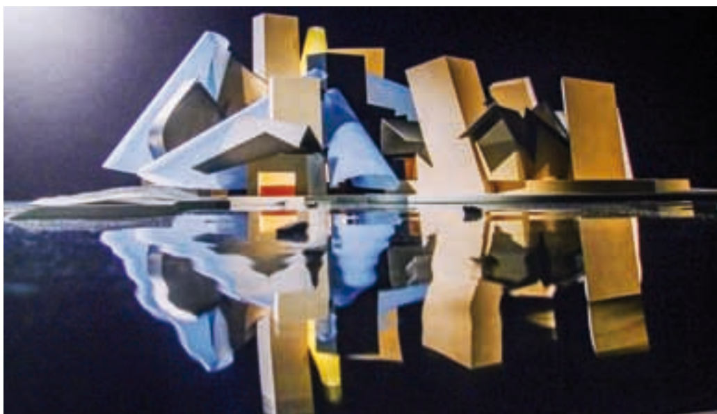
Muzeum Sztuki Współczesnej – Guggenheim Abu Dhabi

kopułą o rozwiniętej strukturze wewnętrznej. Powłoka kopuły jest elementem ażurowym, wpuszczającym rozproszone światło do zespołu nakrytych w ten sposób obiektów tworzących muzeum. Obiekty wewnętrzne pozostają w relacji z odsłoniętymi fragmentami starych budynków w obrębie stanowisk archeologicznych. Muzeum Louvre w Paryżu użyczyło swojej nazwy i zadeklarowało obecną i przyszłą współpracę (m.in. opracowywanie ekspertyz) z Louvre Abu Dhabi. Mówi się o koszcie tej kontrowersyjnej transakcji na poziomie 1 mld USD.