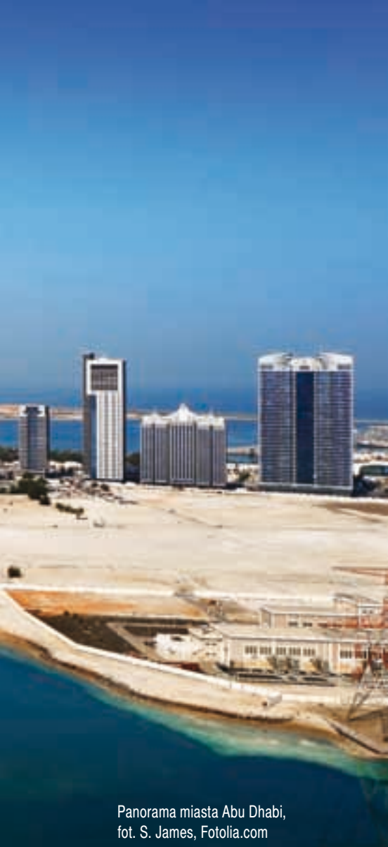
Panorama miasta Abu Dhabi

Jest to pierwsza okazja w nowoczesnym świecie do zbudowania dużej grupy obiektów monumentalnych w niedalekim, wzajemnym sąsiedztwie bez tzw. ograniczeń kontekstualnych. Architektura i urbanistyka na wyspie Saadiyat ma stanowić kontrast dla ogólnie znanej zabudowy Abu Dhabi, gdzie dominantę stanowią wieżowce ze stali, betonu i szkła.