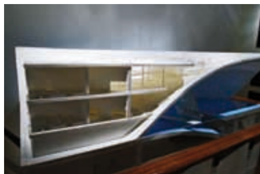
Model Muzeum Morskiego – konstrukcja obiektu