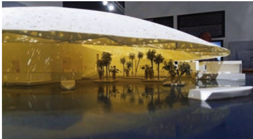
Muzeum Klasyczne (Louvre Abu Dhabi). Model obiektu oraz konstrukcja przekrycia

W artykule wykorzystano źródła własne pozyskane podczas podróży autora po Zjednoczonych Emiratach Arabskich jesienią 2012 r. oraz wybrane źródła internetowe.