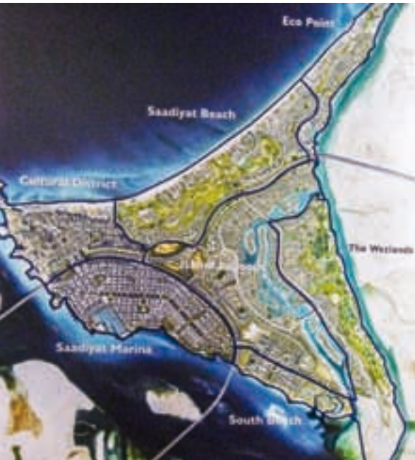
Plan zagospodarowania wyspy Saadiyat, fot. K. Ryż

Zespół muzeum tworzy pięć smukłych wież, których kształt dość czytelnie wyprowadzono z kształtu skrzydeł sokoła, ulubionego ptaka Arabów i szejka Zayed.