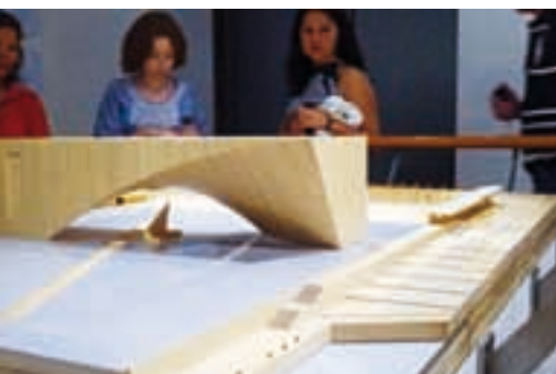
Model Muzeum Morskiego – architektura

kultury i sztuki wszystkich Arabów. Tworzone muzea sztuki mają być uniwersalne, w szczególności pozbawione cechy eurocentryzmu. Celem podjętego wysiłku stworzenia wielkiego centrum kulturalnego w tej części świata jest również chęć