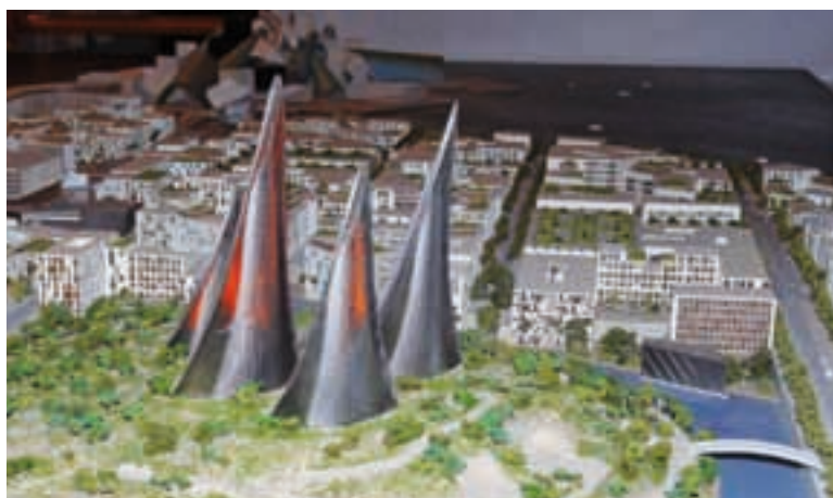
Widok ogólny Muzeum Narodowego Szejka Zayed. W tle powyżej Muzeum Guggenheim Abu Dhabi

wadzono z kształtu skrzydeł sokoła, ulubionego ptaka Arabów i szejka Zayed. Wieże mają lekką konstrukcję stalową i wysoce wystudiowaną formę w kon-