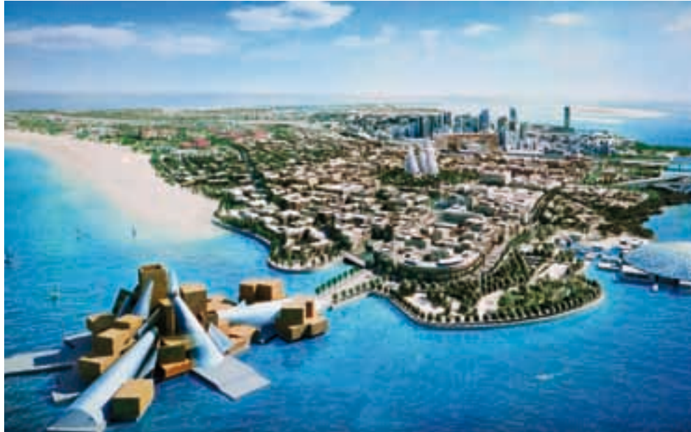
Wizualizacja zabudowy wyspy Saadiyat. Na pierwszym planie Muzeum Guggenheim Abu Dhabi oraz Muzeum Klasyczne (Louvre Abu Dhabi)

Zespół muzeum tworzy pięć smukłych wież, których kształt dość czytelnie wyprowadzono z kształtu skrzydeł sokoła, ulubionego ptaka Arabów i szejka Zayed.