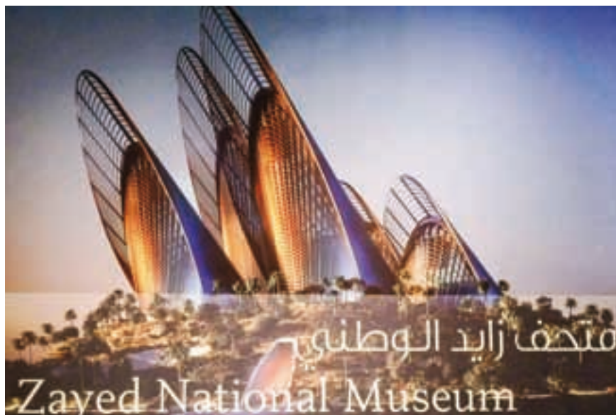
Wizualizacja projektu Muzeum Narodowego Szejka Zayed

dzictwo sztuki islamu. Oddanie obiektu do użytku przewidziano w 2017 r.