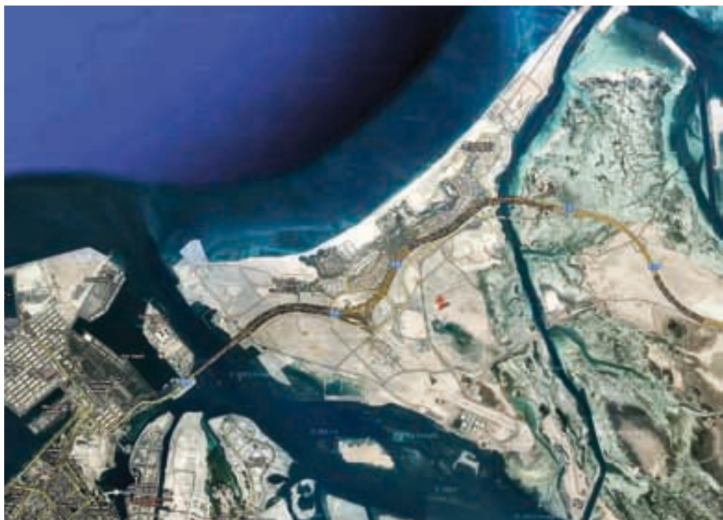
Widok satelitarny wyspy Saadiyat – wyspy Szczęścia. Stan obecny

Konkurs na zaprojektowanie muzeum wygrała słynna w świecie pracownia architektoniczna Foster+Partners. Lord Foster, główny twórca wizji architektonicznej francuskiego wiaduktu Millau oraz projektu przebudowy berlińskiego Reichstagu, stworzył w centrum dzielnicy kultury oryginalny zespół nawiązujący do tradycji i kultury arabskiej. Muzeum z jednej strony upamiętnia życie i wielkie dokonania szejka Zayed (ojca narodu), z drugiej natomiast nawiązuje, zwłaszcza formą, do dynamicznych przemian społecznych, politycznych, gospodarczych i kulturowych, jakie już nastąpiły i współcześnie trwają w ZEA. Zespół muzeum tworzy pięć smukłych wież, których kształt dość czytelnie wypro-