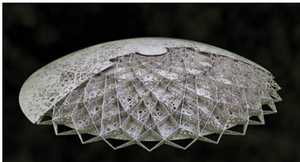
Muzeum Klasyczne (Louvre Abu Dhabi) – konstrukcja przekrycia