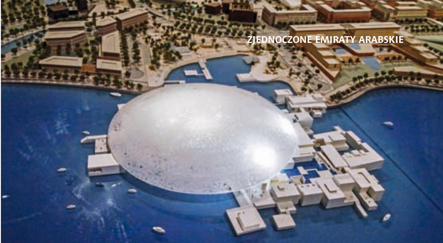
Muzeum Klasyczne (Louvre Abu Dhabi). Model w układzie urbanistycznym dzielnicy kultury

ZEA aspirują do roli nowego centrum kulturalnego w tej części świata, dążąc do promowania w świecie dorobku kultury i sztuki wszystkich Arabów.