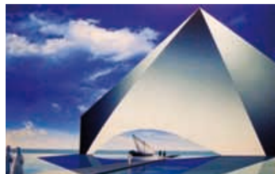
Muzeum Morskie – wizualizacja

raty na przełomie XX i XXI w. w wielki plac budowy, a osiągnięte rezultaty będą podziw w skali globalnej. Abu Dhabi i Dubaj przeobraziły się w wielkie światowe metropolie. Biedny, niewielki kraj, utrzymujący się z rybołówstwa i połowu pereł w pierwszej połowie XX wieku, stał się w jego końcowych dekadach wielkim eksporterem ropy naftowej, która jest głównym źródłem dochodu i dobrobytu jego obywateli. Obserwacja inicjatyw tego państwa na początku XXI w. wskazuje na podejmowanie wielu wysiłków w kierunku dywersyfikacji źródeł dochodów. Turystyka, handel oraz nowe technologie (np. proekologiczne nowe miasto Masdar na obrzeżach Abu