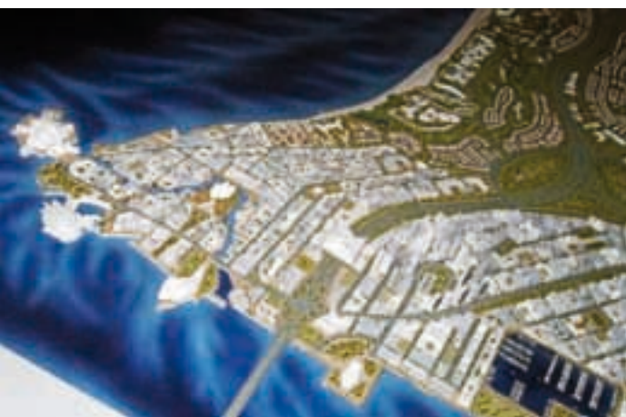
Dzielnica kultury na wyspie Saadiyat. Muzeum Guggenheim Abu Dhabi (północny zachód wyspy). W kolejności na brzegu wyspy: Muzeum Klasyczne (Louvre Abu Dhabi), Centrum Teatru, Tańca i Muzyki (Performing Arts Centre), Muzeum Morskie (za mariną, poza fotografią), w centrum dzielnicy – Muzeum Narodowe Szejka Zayed, fot. K. Ryż

zmu, mógł przystąpić do projektowania trzeciego, największego na świecie (30 000 m 2 ) Muzeum Guggenheima w Abu Dhabi. Wielobryłowy, zróżnico-