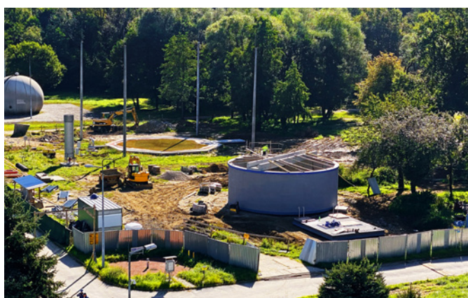
Widok ogólny budowy

W oczyszczalni Kujawy, drugim co do wielkości zakładzie oczyszczania ścieków w Krakowie, modernizowane są obiekty oraz elementy sieci osadowej i biogazowej pod kątem maksymalnego wykorzystania biogazu wytwarzanego w procesie oczyszczania ścieków. W ten sposób Wodociągi Miasta Krakowa chcą zmniejszyć ślad węglowy.