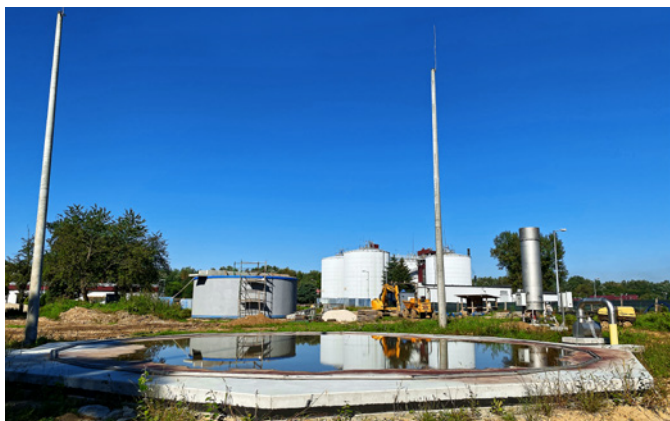
Zbiornik biogazu, podłoże

cieczowy) będzie on spełniał funkcję magazynowania nadmiaru biogazu w okresach wzrostu jego produkcji w komorach fermentacyjnych oraz funkcję stabilizacji przepływu i ciśnienia w sieci biogazu.