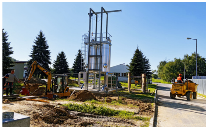
Instalacja uzdatniania biogazu

Biogaz produkowany w istniejących komorach fermentacyjnych będzie kierowany do nowego, niskociśnieniowego, dwumembranowego (membrana zewnętrzna daje zbiornikowi kształt zewnętrzny, a membrana wewnętrzna tworzy przestrzeń magazynową) zbiornika biogazu o pojemności 2380 m 3 (obecny zbiornik posiada pojemność 330 m 3 ). Wraz z urządzeniami towarzyszącymi (wentylatory powietrza oraz bezpiecznik