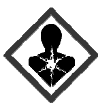
GHS08. Hasło ostrzegawcze „Uwaga”