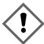
GHS07. Hasło ostrzegawcze „Uwaga”