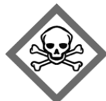
GHS06. Hasło ostrzegawcze „Niebezpieczeństwo”