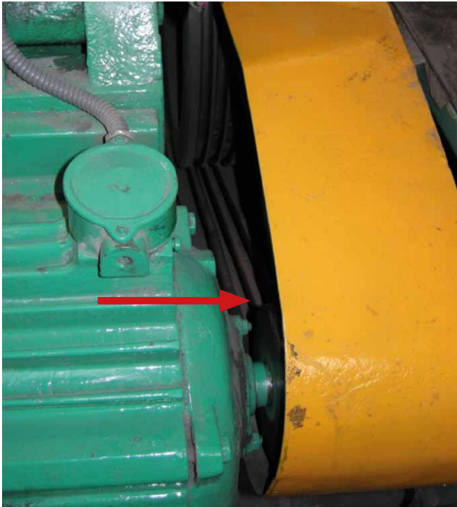
Rys. 1. Miejsce pochwycenia dłoni uszkodzonego przez elementy napędowe gilotyny