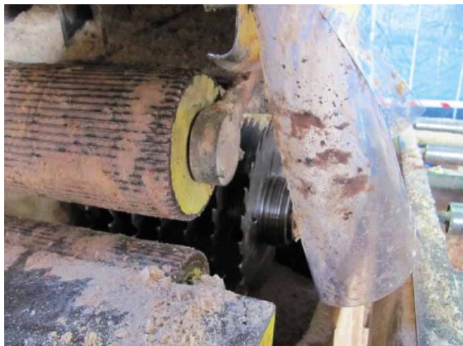
Rys. 5. Osłona boczna wielopięty

Obowiązki pracodawcy dotyczące bezpieczeństwa maszyn zostały zawarte w przepisach art. 215–219 Kodeksu pracy, stanowiących treść rozdziału IV działu dziesiątego tej ustawy, zatytułowanego „Maszyny i inne urządzenia techniczne”.