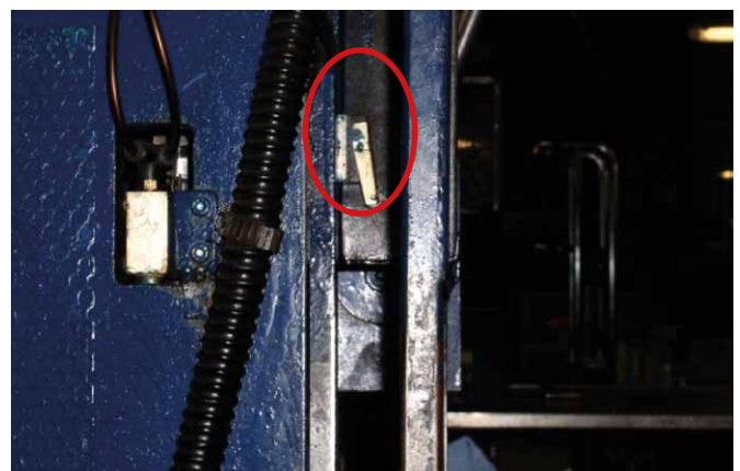
Rys. 4. Element sterujący uruchamiany przez opadającą osłonę przednią

Ponadto ustalono, że ruch stempla jest inicjowany przez element sterujący uruchamiany przez opadającą osłonę przednią (rys. 4).