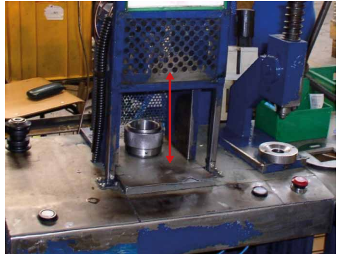
Rys. 2. Urządzenie do pneumatycznego wciskania tulejek

W czasie kontroli inspektora pracy stwierdzono, że nie zabezpieczono dostępu do strefy niebezpiecznej po obu stronach przedniej osłony ruchomej (rys. 3).