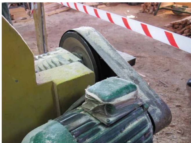
Rys. 6. Osłona elementów napędowych