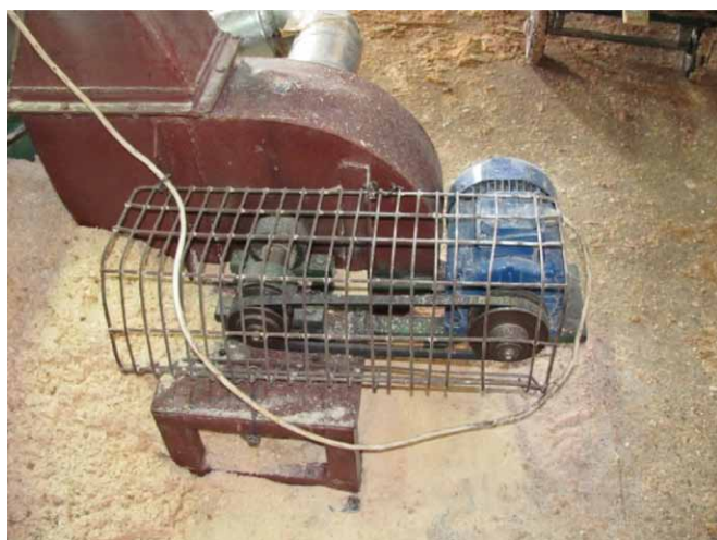
Rys. 7. Osłona elementów napędowych

W art. 215 ustalono w sposób ogólny wymagania, jakim powinny odpowiadać konstruowane i budowane maszyny, inne urządzenia techniczne i narzędzia pracy. Nacisk położono na