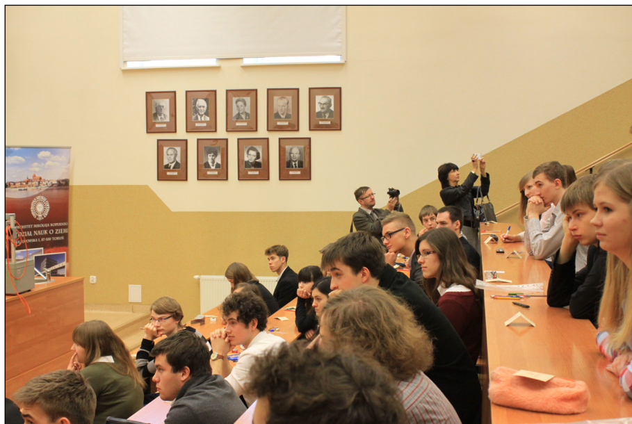
Ryc. 1. XXXVIII Olimpiada Geograficzna – zawody II stopnia rozgrywane w Toruniu