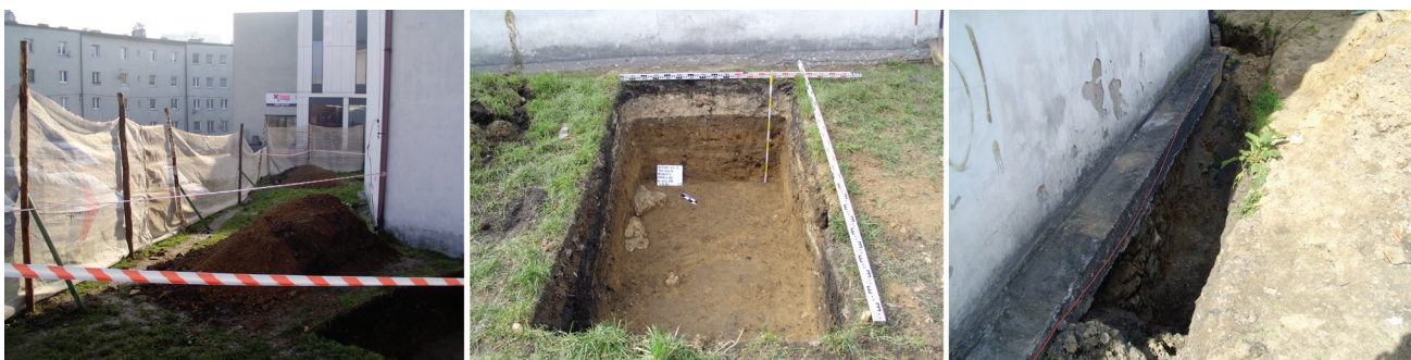
Fot. 2. Badania wykopaliskowe z 2020 r. – lokalizacja sondaży, wykop 2 z luźno usytuowanymi kamieniami, zakłócenie kamiennego wątku fundamentu w ścianie północnej (fot. J. Świącicki MGB)

Niestety archeologom nie udało się odnaleźć żadnych pozostałości starszych obiektów. Wykopy sondażowe nie objęły okolicy miejsca, w którym wcześniej zidentyfikowano ich ślady, natomiast wykop liniowy, okalający obiekt, zapewne ze względów technicznych (bezpieczeństwo obecnej budowli) nie osiągnął głębokości posadowienia fundamentów i nie można było sprawdzić, co znajduje się poniżej. Oglądając natomiast odsłonięty pas fundamentów, daje się zaobserwować szereg zaburzeń. I tak poczynając od ściany północnej, w jej środkowej części – zakłócenie kamiennego wątku i szew murów, na kolejnej ścianie, w pobliżu narożnika północno-wschodniego – zmianę wątku oraz wypukłość, wschodni narożnik – zaburzenie i nieregularne wyokrąglenie oraz w połowie ściany południowo-zachodniej wystające dwa kamienie. Podobne kamienie zlokalizowano w wykopie 2 [odrzuczone podczas budowy?] (rys. 1., fot. 2., fot. 3.). Ponadto występuje zmiana wątków pomiędzy górną