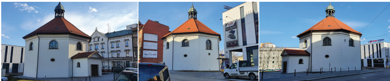
Fot. 1. XVIII-wieczna kaplica św. Ducha (fot. aut.)

Teren nie cieszył się zainteresowaniem archeologów aż do lat 90. XX w., kiedy to w związku z zaistniałymi uszkodzeniami górniczymi podjęto decyzję o remoncie kaplicy, a następnie także o przeprowadzeniu badań archeologicznych w jej wnętrzu. Obejmowały one eksplorację jam grobowych odsłoniętych po zdjęciu posadzki – w poł.-zach. części kaplicy (sześć grobów i pozostałości siódmego) oraz w partii północnej. Ze względu na niewielkie środki finansowe przeznaczone na ten cel wykonano tylko badania sondażowe w ograniczonym zakresie – 1. na styku apsyd południowej i zachodniej oraz 2. w zachodniej części apsydy północnej [7]. (Kaplica jest wprawdzie budowlą orientowaną, czyli częścią prezbiteriałną zwrócona ku wschodowi, jednak posiada wyraźne odchylenie osi w kierunku wschód – zachód, stąd umowne przyjęcie głównej apsydy ołtarzowej jako wschodniej).