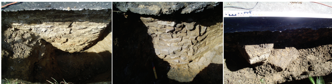
Fot. 3. Zaburzenia kamiennego wątku murów fundamentowych, odsłoniętych częściowo w 2020 r. – ściana północno-wschodnia: zmiana wątku i wypukłość (4) oraz narożnik (7), ściana południowo-zachodnia: wystające kamienie (8)

i dolną częścią fundamentu, co zostało zaobserwowane na osi wykopu nr 2 (nie wiadomo, czy tak dzieje się tylko na tym fragmencie, czy także w innych miejscach).