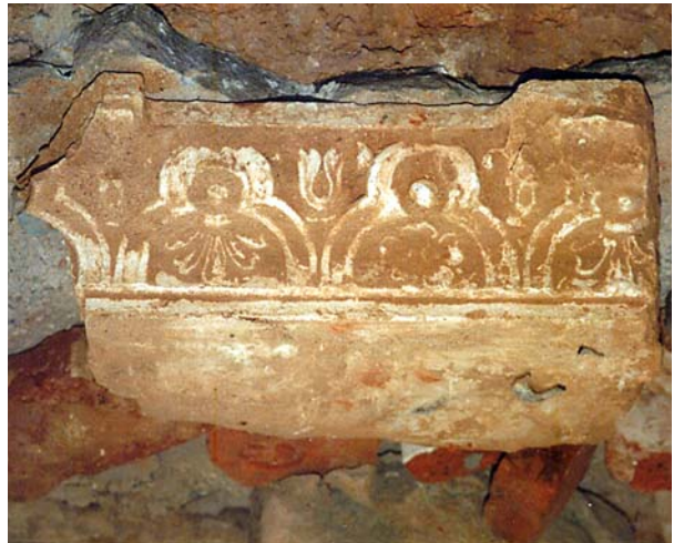
Ryc. 4. Wydobyty z zasypu detal manierystyczny