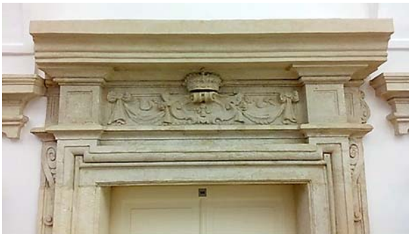
Ryc. 1. Wyeksponowane detale historyczne w budynku tzw. Podchorążówki, obecnej siedziby WAPK