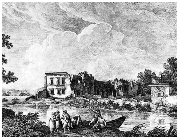
Ryc. 5. Widok stanu zachowania pałacu w Łobzowie wg Zygmunta Vogla