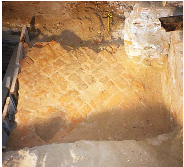
Ryc. 3. Widok odsłoniętej w trakcie badań fragmentarycznie zachowanej posadzki ceglanej