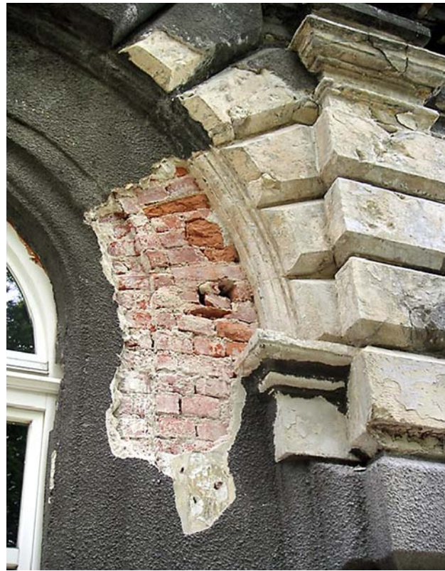
Ryc. 6. Detale architektoniczne zachowane w elewacji południowej obecnej Podchorążówki, pochodzące z pałacu w Łobzowie z fazy Trevana