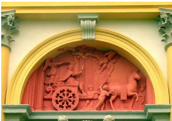
Ryc. 4. Triumf Jana III – płaskorzeźba w archiwoltce na elewacji zachodniej korpusu głównego