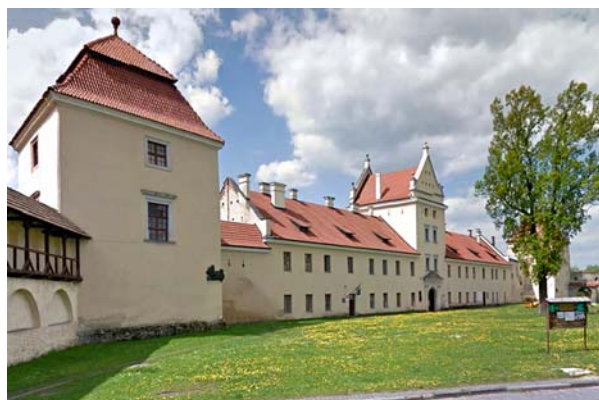
Ryc. 2. Zamek w Żółkwi Fig. 2. Castle in Żółkiew

Przebudowa zamku w Żółkwi była kolejnym przedsięwzięciem architektonicznym króla. Zamek ten już za czasów jego ojca Jakuba został przebudowany, stając się reprezentacyjną rezydencją, jednak dopiero Jan III Sobieski uczynił z niego barokową rezydencję, zlecając swoim nadwornym architektom Piotrowi Beberowi i Augustynowi Loccemu pracę nad rozbudową i przebudową wnętrz. Dodano wtedy między innymi nową galerię oraz portyk kolumnowy z dwubiegowymi schodami 9 . Pracujący wtedy na dworze króla architekci bardzo chętnie implementowali w fundowane przez niego budowle (zarówno te przebudowywane, jak i stawiane od podstaw) tak cenione przez niego wzorce architektury antycznej. Szczególnie Augustyn Locci, nazywany przez samego króla „najbliższym przyjacielem i naszym sekretarzem”, dzięki swojej pomysłowości oraz niezwykłym umiejętnościom technicznym, potrafił w niebanalny sposób nawiązywać do największych