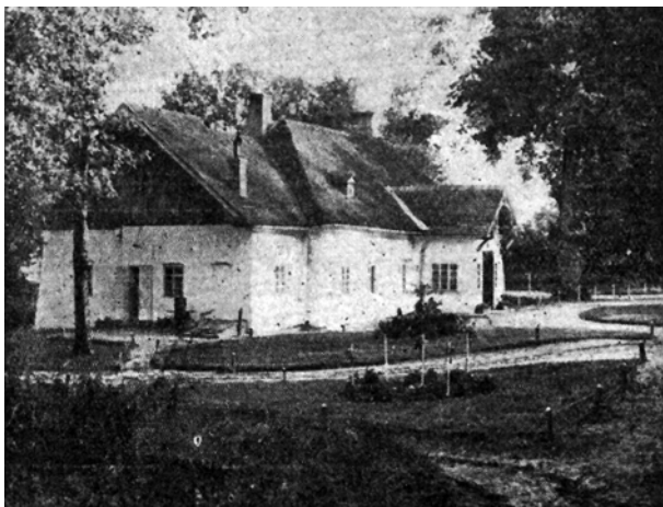
Ryc. 1. Dwór w Jaworowie (widok od północnego zachodu), „Rolnik 1867–1937”, czasopismo rolniczo-przemysłowe, Lwów 1938, s. 86 Fig. 1. Manor in Jaworow (view from the north-west), „Rolnik 1867–1937”, agricultural and industrial periodical, Lviv 1938, p. 86

majątkiem ziemskim, które po latach mógł przenieść do kompleksu pałacowego w Wilanowie 6 .