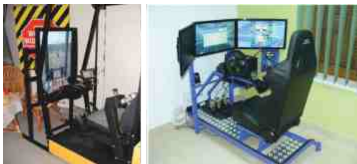
Rys. 2. Symulator wózka widłowego i samochodu osobowego [4] Fig. 2. A forklift truck and car simulator [4]