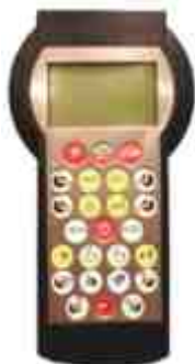
Rys. 4. Radiowy Sterownik Operatorski RSO-25, kombajnu ścianowego Fig. 4. Remote controller RSO-25 of combined cutter-loader

Użytkownik gry symulacyjnej występuje w roli operatora kombajnu ścianowego (Rys. 3.), którym może sterować przy użyciu Radiowego Sterownika Operatorskiego RSO-25 (Rys. 4.). Sterownik ten służy do zdalnego sterowania prawdziwych kombajnów ścianowych. Po uruchomieniu przenośnika oraz organów kombajnu można włączyć posuw, a wtedy po zawrębieniu się w caliznę węglową nastąpi urabianie węgla. Towarzyszy temu wzrost stężenia metanu wydobywającego się z urobku oraz powolny wzrost temperatury związanej z wydzielaniem się ciepła z napędów przenośnika oraz kombajnu. Uruchomione zraszacze na organach powodują wzrost wilgotności w wyrobisku. Jeśli stężenie metanu przekroczy 2% nastąpi wyłączenie zasilania w wyrobisku przez system metanometrii automatycznej.