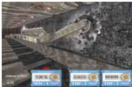
Rys. 3. Wygląd ekranu aplikacji Fig. 3. Screen of application

Technik Innowacyjnych EMAG. W opracowanej aplikacji przedstawiono związki zachodzące pomiędzy szybkością urabiania pokładu węgla a parametrami atmosfery kopalnianej.