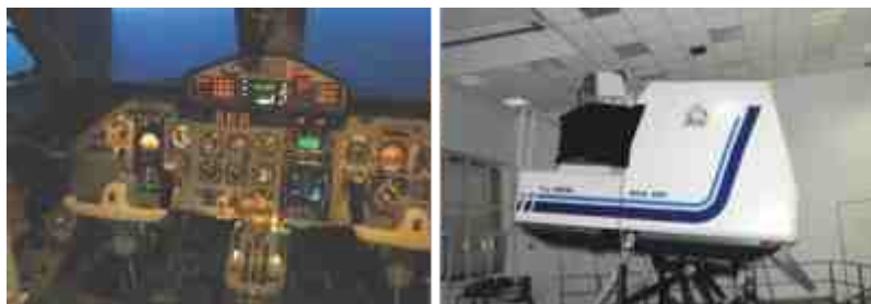
Rys. 1. Symulator samolotu Bryza [3] Fig. 1. Flight simulator of airplane „Bryza” [3]

Przykładem może być symulator samolotu Bryza, użytkowany już od kilkunastu lat na lotnisku w Siemirowicach. Symulator przeznaczony jest do szkolenia i egzaminowania załóg tych maszyn. Urządzenie symuluje właściwości realnego lotu, działanie i sterownie silnikami oraz funkcjonowanie wszystkich systemów pokładowych. Zastosowane w nim rozwiązania pozwalają na kontrolowanie działania załogi i wpływanie na przebieg lotu poprzez wprowadzanie przez instruktora zmian warunków lotu, złożoności sytuacji radionawigacyjnej oraz symulowanie usterek poszczególnych układów. Symulator przeznaczony jest również do szkolenia z postępowania w sytuacjach awaryjnych i niebezpiecznych [1, 3]. Symulator odwzorowujący w pełni realistyczny kokpit lub panel sterowania jest zdecydowanie najlepszym rozwiązaniem w szkoleniach załóg, gdyż użytkownik ma bezpośredni kontakt dotykowy i wzrokowy z realnymi elementami sterowanego urządzenia. Odczuwa również ruch urządzenia poprzez zmieniające się obrazy za oknem oraz zmiany położenia kokpitu realizowane przez siłowniki.