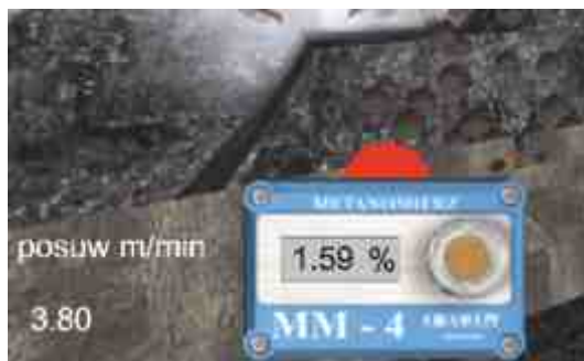
Rys. 5. Sygnalizacja świetlna informująca o przekroczeniu stężenia metanu powyżej 1,5% Fig. 5. Light signals of methane exceeding