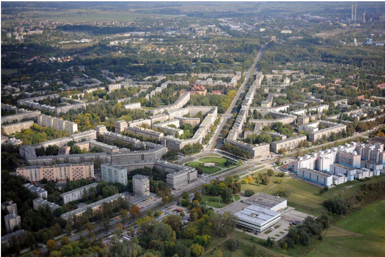
Ryc. 1. Centrum Nowej Huty od południowego zachodu. Fot. Wiesław Majka, 2009