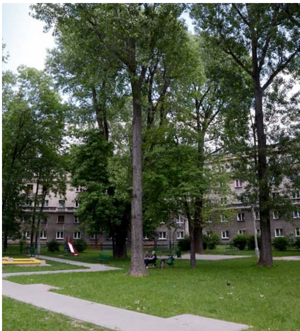
Ryc. 4. Niepielegnowana zielen Nowej Huty – konflikt z architekturą.

Architektura Nowej Huty lat pięćdziesiątych szczęśliwie uniknęła większych przekształceń. Jednak proces drobnych modernizacji, mnożonych przez efekt skali, daje zauważalnie negatywne skutki. Znaczące były pod tym względem zwłaszcza lata osiemdziesiąte, gdy służby