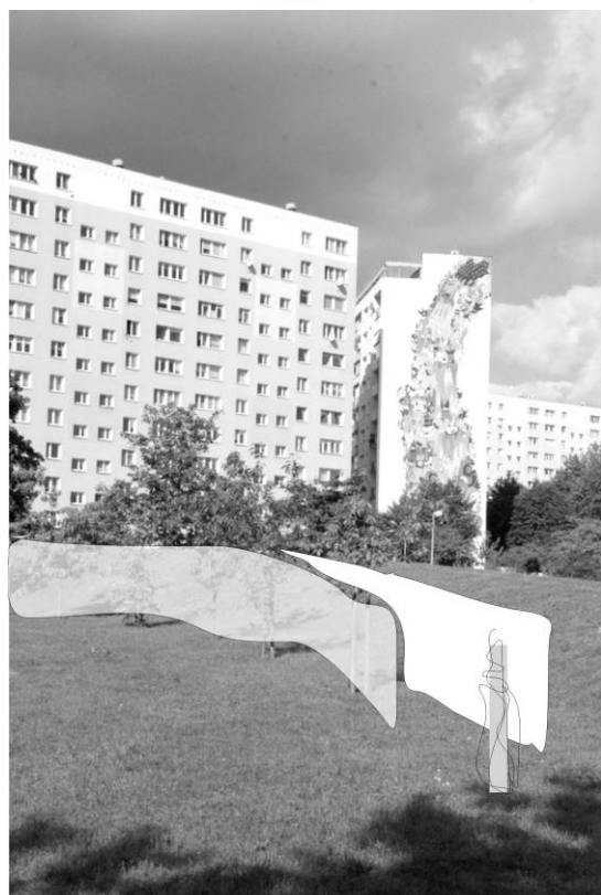
Fig. 3. Sketch to the 'shelter' project prepared for the 'Images Painted with Fire' Artistic Festival scheduled for October 2016 in the Zaspá district of Gdańsk. Source: illustration by A. Kurkowska

Ryc. 3. Szkic do projektu 'schronienie' przygotowany na Festiwal Artystyczny 'Obrazy Ogniem Malowane' planowany na październik 2016 w gdańskiej dzielnicy Zaspá. Źródło: il. A. Kurkowska