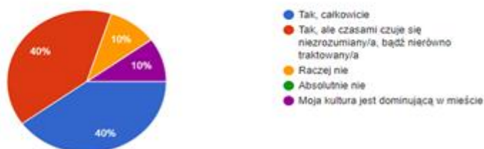
Rys. 4. Diagram pochodzący z ankiety badawczej [O. Kłosowska]

Czy czujesz się akceptowany/akceptowana jako członek innej kultury niż dominująca w mieście?