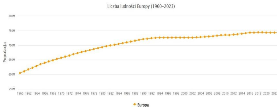
Rys. 2. Wykres przedstawiający liczbę ludności Europy [Ludność Europy 2023]

Współistnienie różnych kultur w przestrzeni miejskiej jest obecnie nieodłącznym elementem współczesnych miast-miejsc, w których kultury pochodzące z różnych części świata spotykają się, mieszają i oddziałują na siebie nawzajem. Zjawisko to jest wynikiem procesów globalizacji, migracji ludności oraz rosnącej mobilności społeczeństw. W miastach można zaobserwować zróżnicowanie kulturowe zarówno na poziomie lokalnym, jak i globalnym, co sprawia, że wielokulturowość miast staje się jednym z najważniejszych wyzwań społecznych i badawczych XXI w. Analiza zjawiska wielokulturowości w kontekście miast jest złożonym zadaniem, które wymaga interdyscyplinarnego podejścia różnych dziedzin, takich jak socjologia, antropologia, psychologia społeczna, geografia, urbanistyka czy politologia. Współistnienie różnych kultur w przestrzeni miejskiej nie tylko niesie ze sobą wyzwania, takie jak konflikty, wykluczenie czy asymilacja, ale również otwiera nowe możliwości, takie jak tworzenie nowych form dialogu, współpracy i kreatywności między różnymi kulturami.