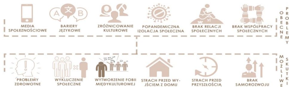
Rys. 1. Obecne problemy i możliwe skutki braku rozwinięcia integracji kulturowej [O. Kłosowska]

Artykuł ma na celu przyczynienie się do rozwoju interdyscyplinarnych badań nad współistnieniem różnych kultur w przestrzeni miejskiej, a także do zgłębiania złożoności procesów interakcji międzykulturowych w przestrzeni publicznej. Przedstawione wyniki mogą być użyteczne dla badaczy, urbanistów, planistów, polityków oraz innych praktyków zajmujących się tematyką wielokulturowości i przestrzeni miejskiej