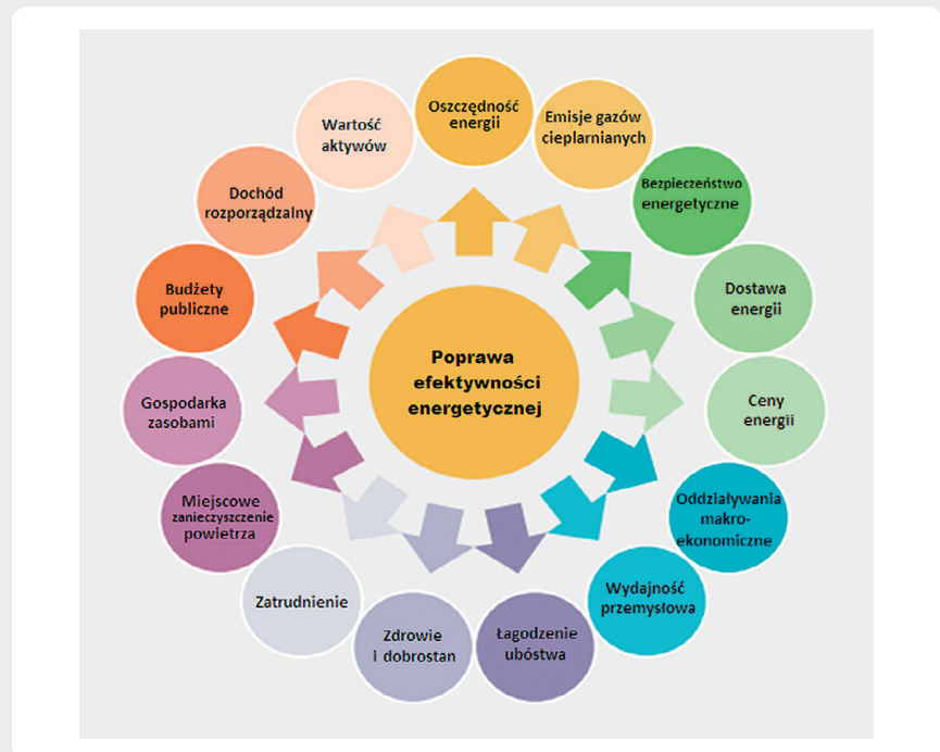
Rys. 1. Wielorakie korzyści z efektywności energetycznej MAE, 2014

Komisja Europejska przedsięwzięła wiele środków w celu poprawy efektywności energetycznej w krajach członkowskich UE i zaproponowała wiążący cel 30% efektywności energetycznej na 2030 rok (obecny cel to co najmniej 27%). Rozszerzono też obowiązek oszczędzania energii, wymagając od dostawców i dystrybutorów energii oszczędności 1,5% energii rocznie